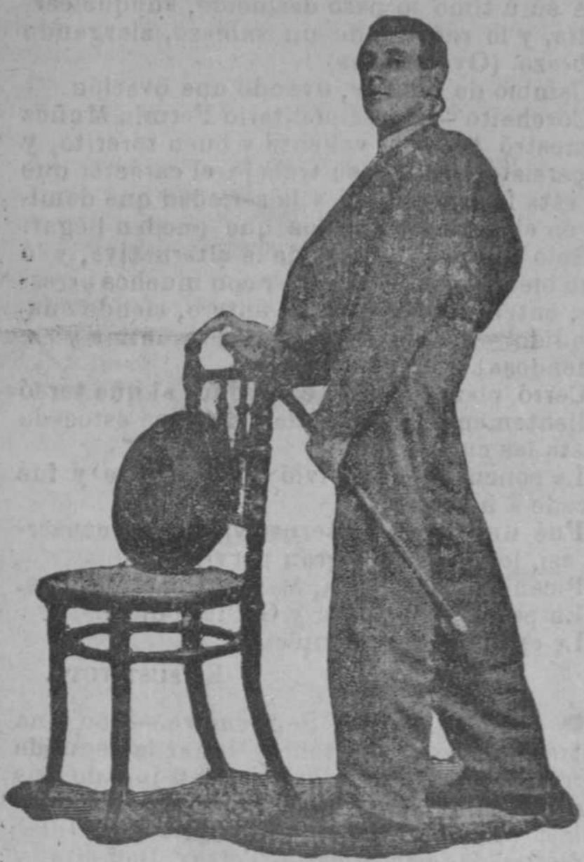
CHIPA DE CARABANHEL