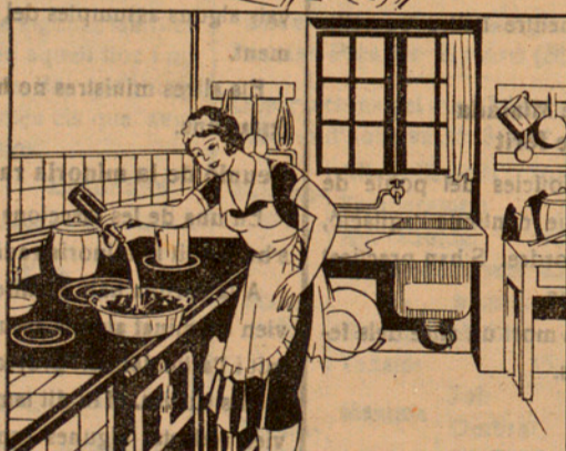
Amb la solució preparada mullo 15 quilos de carbó que abans hauré posat en un cubell, fins que quedi ben mullat. ¡Questió d'un minut!