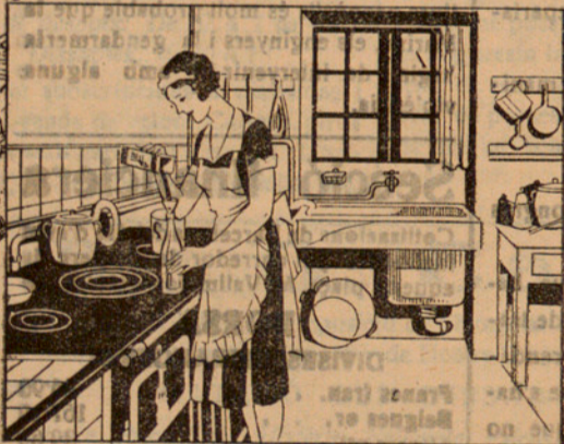
En una botella de litre plena d'aigua, hi poso dues cullerades de Oxigenante de Carbones i remeno la botella...

Vegi gràficament la manera senzilla i pràctica de preparar el carbó, només un minut cada dia