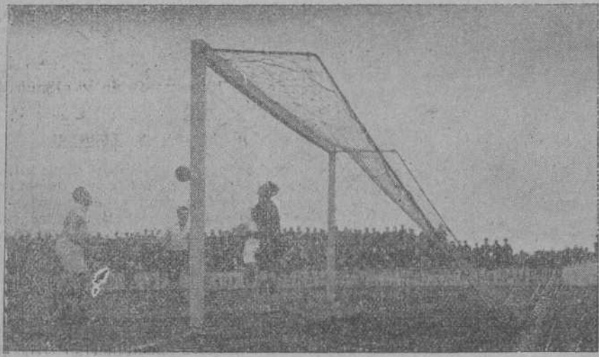
DEL PARTIDO GIMNASTICA-RACING.—El portero gimnástico para un chute de Oscar.

Sería a los tres minutos escaseo de comenzar: el Deportivo se mar-