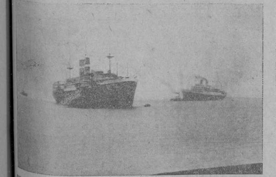
EN NUESTRA BAHIA.—Dos grandes buques, el «Edam», de la Compañía holandesa, y el «Cuba», de la francesa, hacen, con toda facilidad, operaciones de atraque y desatraque, en la bajamar, para convenir a algunos queridos colegas filipinos de que sus quillas no tocan en el fondo.

Unas cuartillas de Alba. SAN SEBASTIAN, 7.—A las 0,40 llegaron en automóvil los Reyes, acompañados del ministro de Estado y personal palatino. En Hendaya abandonaron el tren especial, siendo cumplimentados por todas las autoridades y ovacionados por el público. Los Soberanos se dirigieron al Hotel Cristina, quedándose doña Victoria en sus habitaciones. Don Alfonso, acompañado del señor Quiñones de León y del alcalde de San Sebastián, recorrió en automóvil el circuito automovilista de la península que están organizando para el próximo verano. Luego se encaminaron al barrio de Loyola, inspeccionando las obras del nuevo cuartel. Al regresar al Hotel se encontró en el «hall» con el ministro de Estado, conferenciando ambos. El señor Alba leyó al Monarca algunos despachos que acababa de recibir, y luego recibió a los periodistas, a quienes dijo que estaba satisfechísimo del viaje, entregándoles