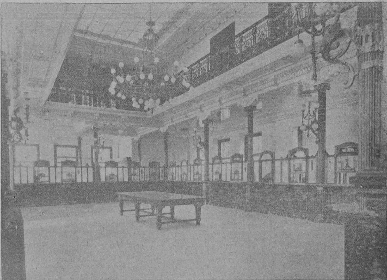
VISTA GENERAL DEL GRAN HALL DEL BANCO DE SANTANDER

Advertimos a los colaboradores espontáneos que la Dirección no mantiene correspondencia acerca de los originales que se le envían, ni devuelve aquellos que no estime convenientes publicar.