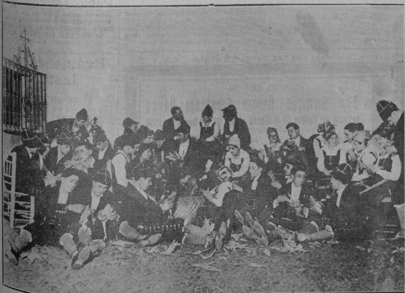
El coro montañés "El Sabor de la Tierra", que el martes sale para Sevilla con objeto de actuar en la Exposición, en una escena de la estampa folk-lórica de Manuel Llano, "La Jila".

Lloremos la muerte de la ilusión heroica. Ya no será posible que ninguna empresa aérea nos emocione. El avión y el dirigible se han convertido en la cosa prosaica y útil que es la locomotora en la actualidad. ¿Qué pena da que las aventuras se conviertan en realidades y los heroísmos en cosas prácticas!