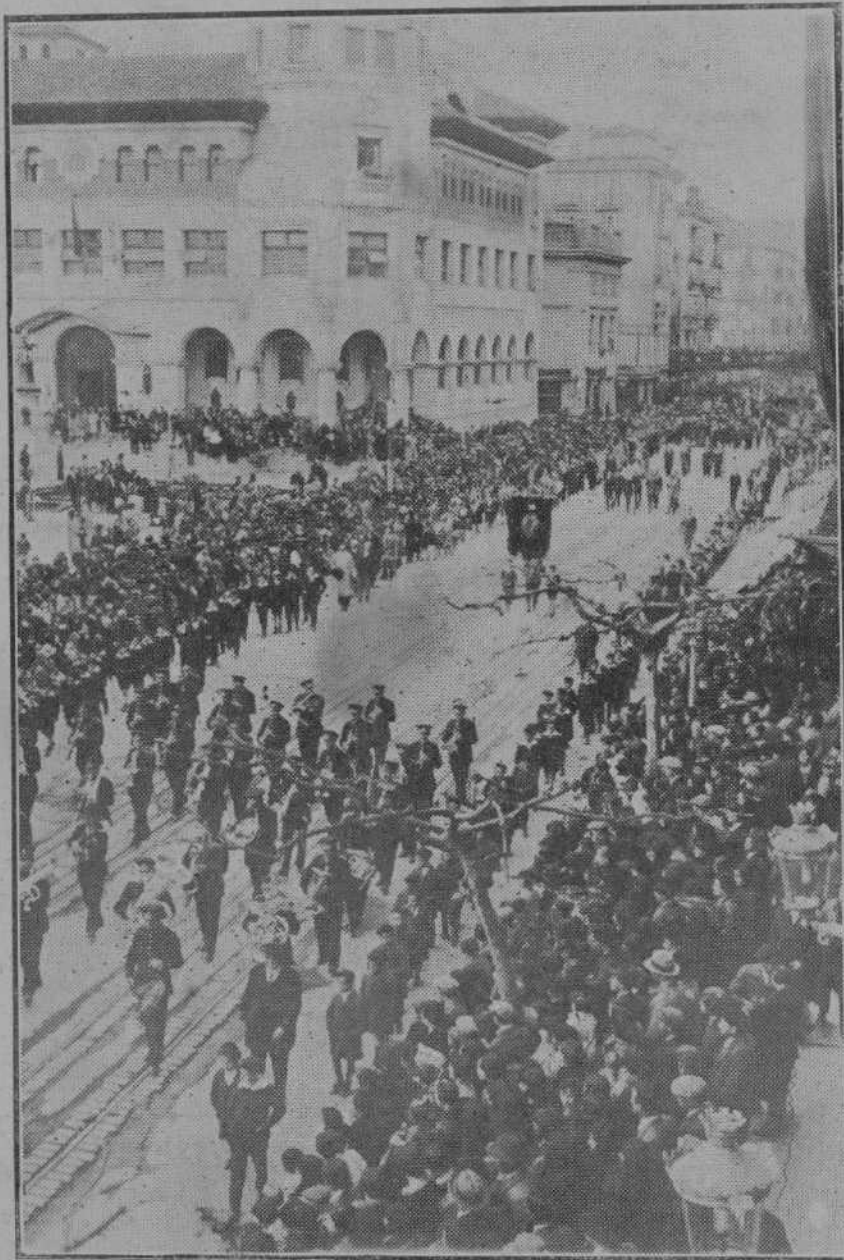
La procesión de ayer tarde, a su paso por la Ribera.

Entre jardines. Sobre la falda florida del cerro en que se apoya la ciudad. El convento tiene tapias blancas por las que trepa la madre-selva. Hay un aroma fuerte, penetrante y cándido de flores frescas de primavera. El interior es diminuto, pulcro y risueño como un camarín. ¿Qué sensación percibimos dentro? De alivio, de gozo, de limpieza; una sensación pareja a la que sentimos en el baño. Dos monjitas en dos reclinatorios. La cofia almidonada tiembla en la cabeza, como una mariposa sobre una flor.