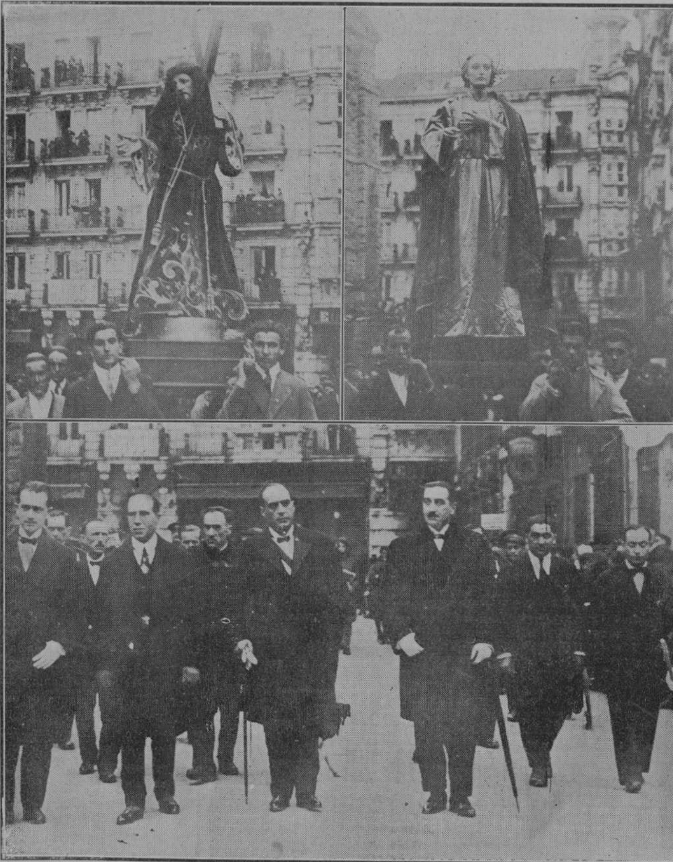
Los "pasos" de Jesús con la Cruz a cuestas y San Juan, que figuraron en la procesión de ayer.—Las autoridades presidiendo la procesión. (Fotos CASA GARCIA).

Con motivo de la festividad de Viernes Santo, el gobernador ha ordenado que sean puestos en libertad todos los detenidos en nuestra prisión provincial no sujetos a procedimiento judicial.