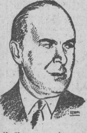
MacCloy, cuyo nombre suena como sucesor de Dulles.

Washington.—El secretario de Estado, Foster Dulles, ha pasado una noche muy tranquila en el Hospital de Walter Reed, según se informa en el Departamento de Estado. Un portavoz del citado Departamento ha declarado que Dulles, que sufre cáncer, continúa en estado "satisfactorio". "El secretario ha pasado una noche muy tranquila—ha declarado el portavoz—; su pulso, temperatura y presión sanguínea, son estables. Su estado continúa siendo satisfactorio. (Efe.)"