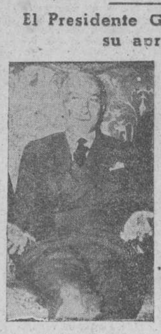
El profesor Antonio Segni, que acaba de constituir el Gobierno.

El Presidente Gronchi ha dado su aprobación