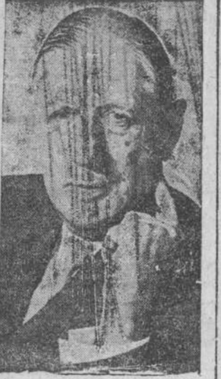
M. Charles de Gaulle, Presidente de la República francesa.

Washington.—El entusiasmo popular se ha desbordado en esta nueva etapa del viaje de De Gaulle. Los campesinos hicieron sonar las campanas de las iglesias de sus pueblos cuando la caravana del Presidente de la República pasaba frente a ellos. A lo largo de la carretera, grupos de campesinos franceses hacían ondear banderas y agitaban sus boinas negras en señal de saludo al general. El general respondió desde el coche con su ya clásico ademán de brazos abiertos en señal de victoria.