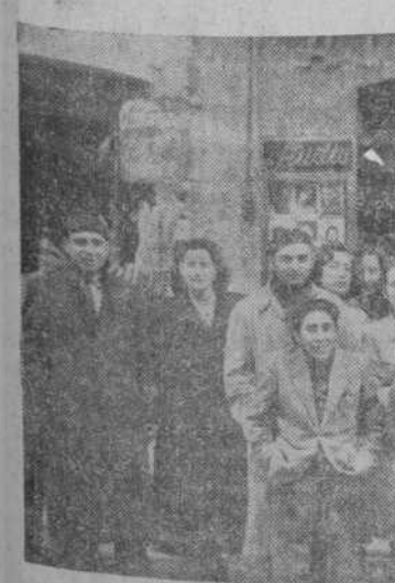
Los empleados de Foto Almaraz, agraciados con participaciones del quinto premio, rodean a su jefe

Estos datos son ya, de por sí, bastante halagadores para una Administración... aunque mucho más lo son para los anónimos poseedores de los décimos... cuyas