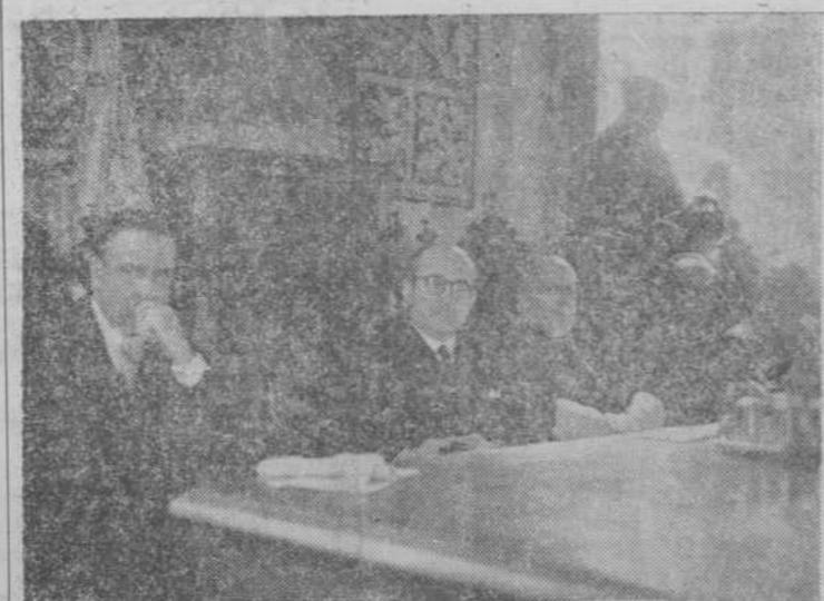
Presidencia del acto académico en el Paraninfo de la Universidad, en la que figuran los ministros de Asuntos Exteriores y Educación Nacional, el rector y representantes iberoamericanos.

La Universidad española ha dejado de arrastrar una vida lánguida incompatible con su elevada misión y con el hecho de ser el organismo rector de las aspiraciones científicas nacionales.