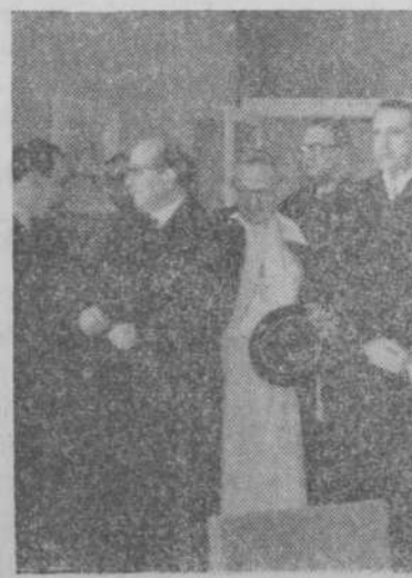
Los ministros, prelado de la diócesis, embajadores y autoridades, en el salón de profesores del nuevo establecimiento universitario.

El obispo de la diócesis, reverendísimo de medio pontifical, precedió a la bendición del Colegio, comenzando por la capilla para continuar por la sala de estar de los alumnos y primera planta del edificio. Terminada la sencilla ceremonia de la bendición, los ministros, embajadores, encargados de Negocios, autoridades y demás invitados recorrieron con detenimiento las distintas salas y dependencias del nuevo Colegio Mayor hispanoamericano «Hernán Cortés», haciendo grandes elogios de su magnífica instalación y del gusto que ha presidido la realización de esta magnífica obra.