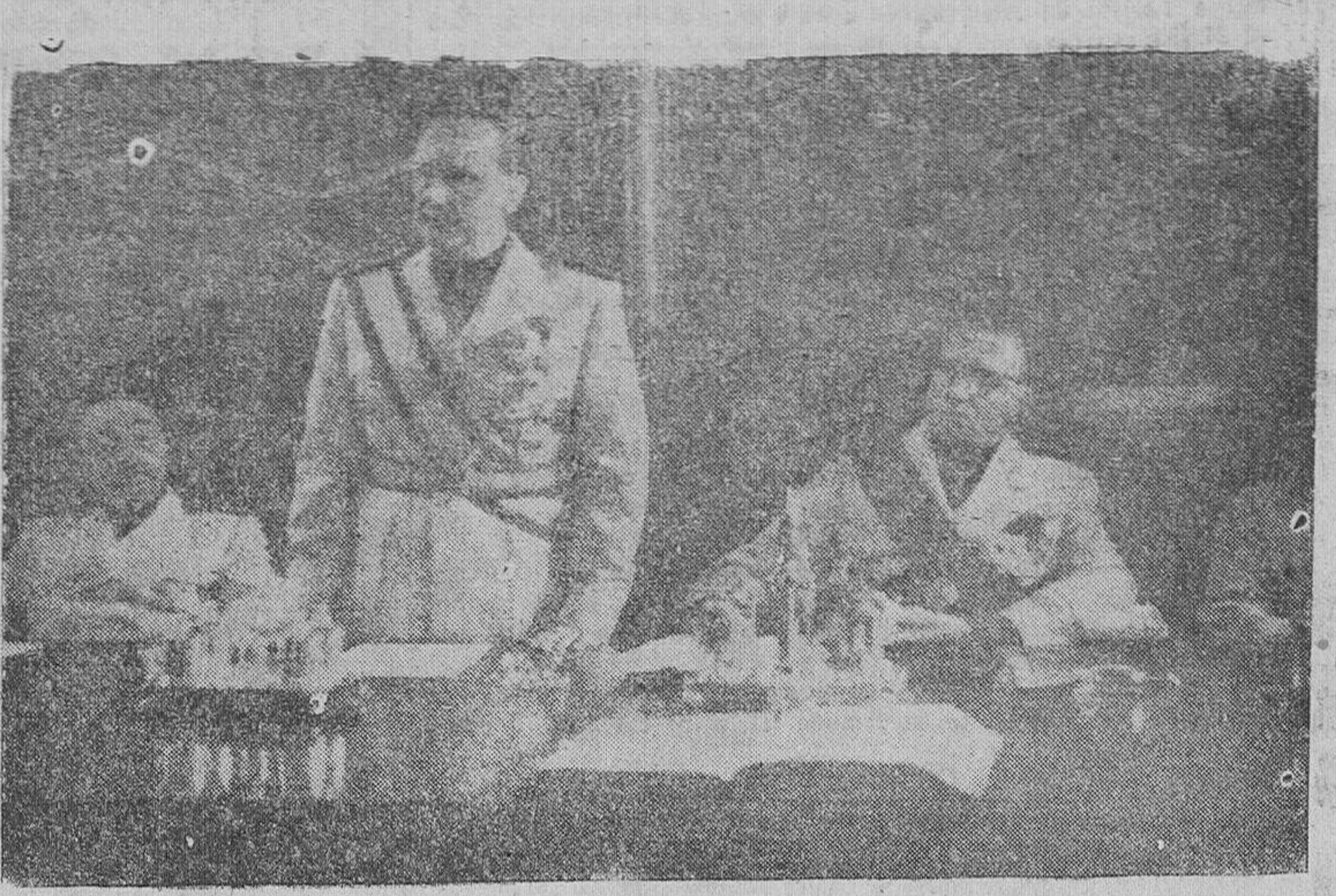
El Excmo. Sr. D. Raimundo Fernández Cuesta, en el acto de la toma de posesión de la presidencia del Consejo de Estado