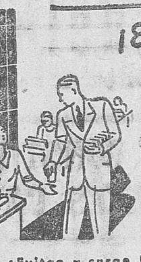
Evita y cura las anginas. Preserva del contagio. Tubo de 15 pastillas. Caja de 30 pastillas. Envase original. Regalo.