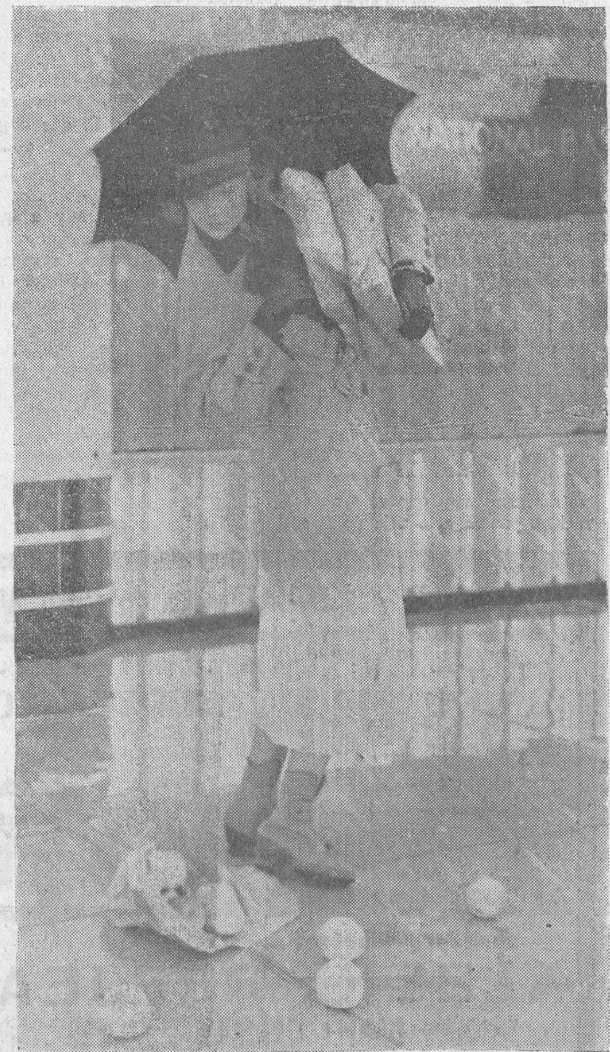
Tal como se presenta el tiempo—casi a las puertas del verano, como quien dice—nos parece de utilidad recomendar a nuestras lectoras el presente modelo de traje para lluvia, llamado a tener gran aceptación