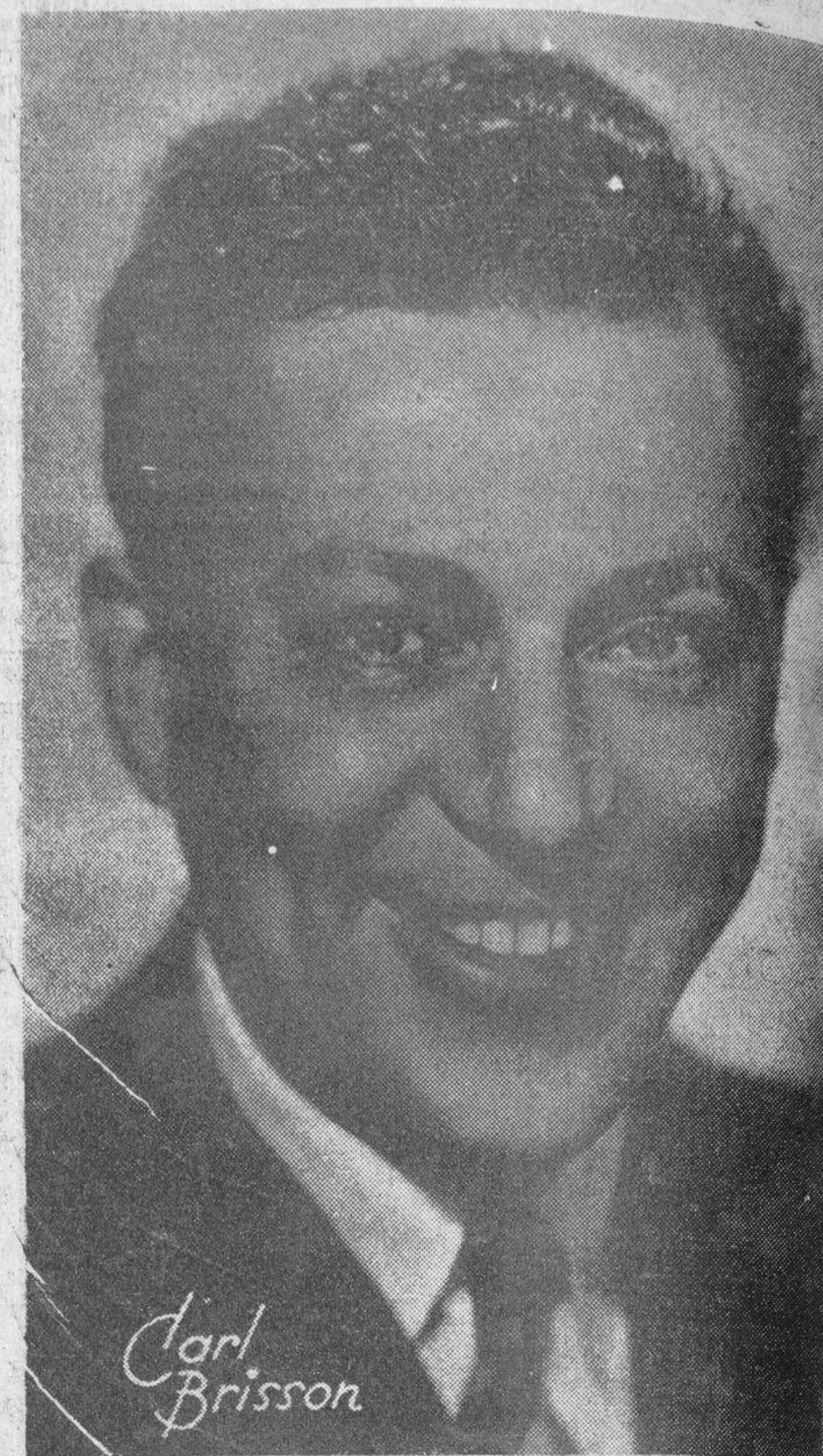
Carl Brisson, de tan destacada actuación en la pantalla