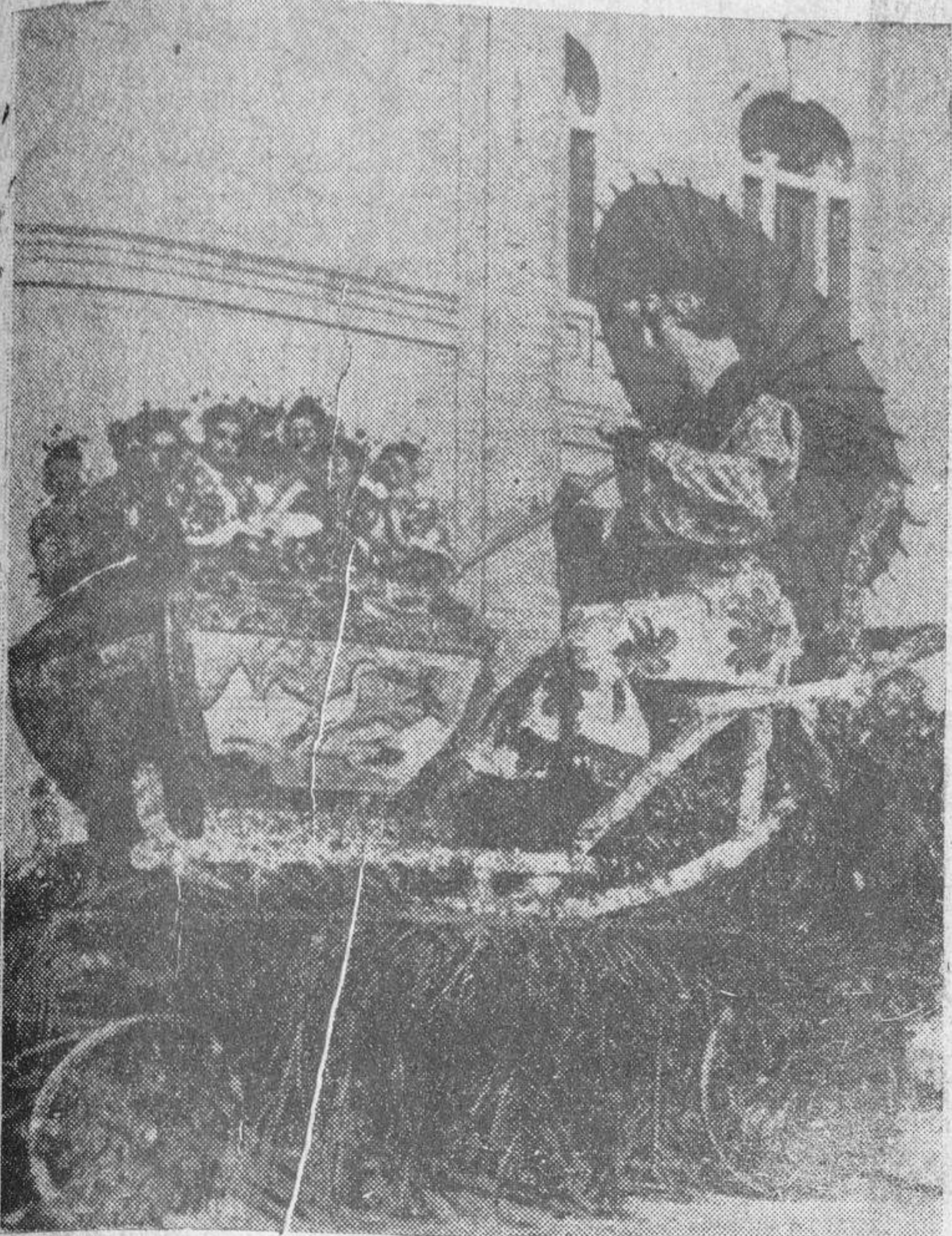
Carroza presentada por la Cámara de Comercio en las fiestas celebradas últimamente en Castellón de la Plana