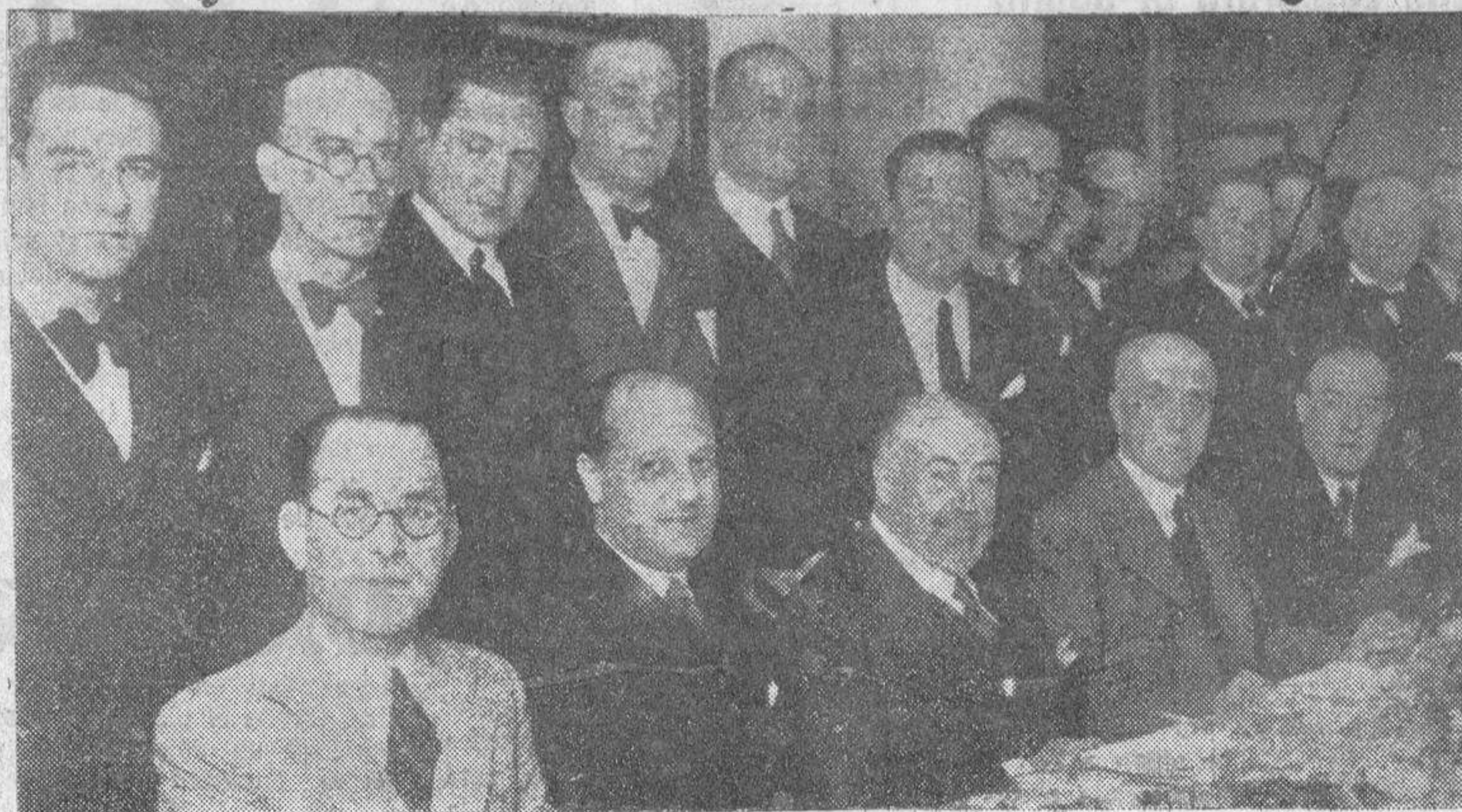
Los redactores de los diarios madrileños que hacen información parlamentaria, obsequiaron el martes con un almuerzo al Presidente de las Cortes, don Santiago Alba. Fue aquí un grupo de comensales