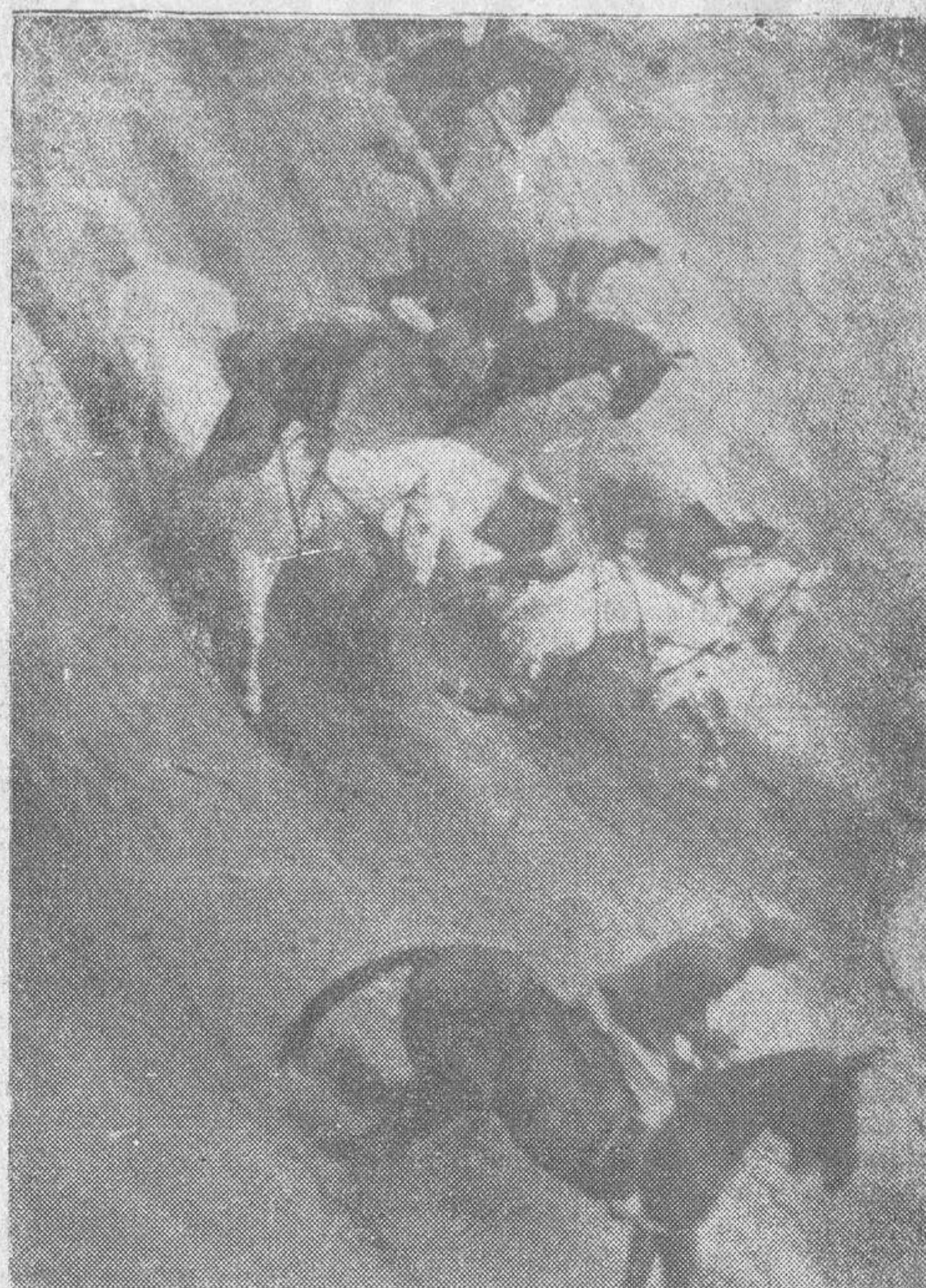
Los alumnos de la Escuela de Equitación en uno de los arriesgados ejercicios de las prácticas que han venido celebrando durante estos últimos días