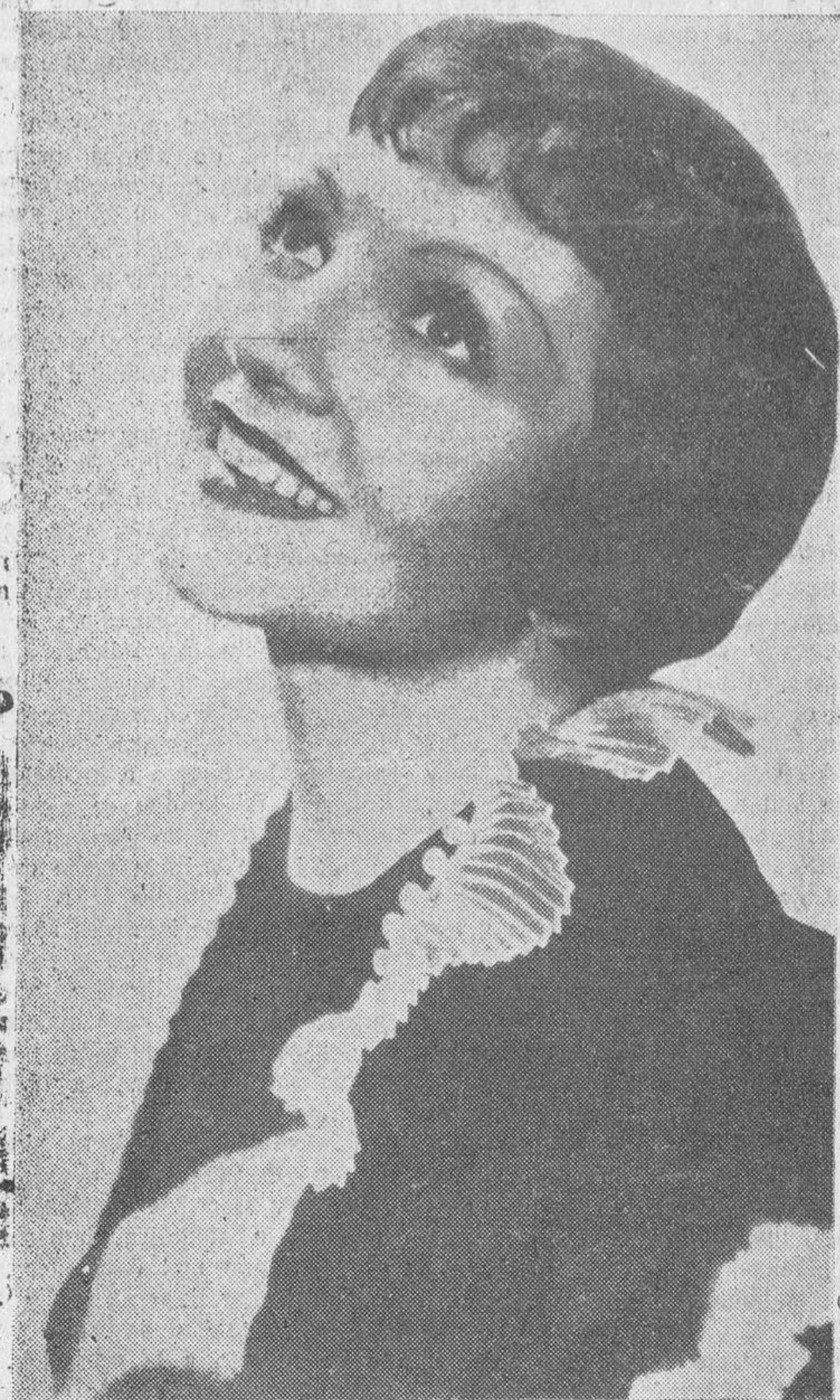
Claudette Colbert, famosa «estrella» francesa del séptimo arte