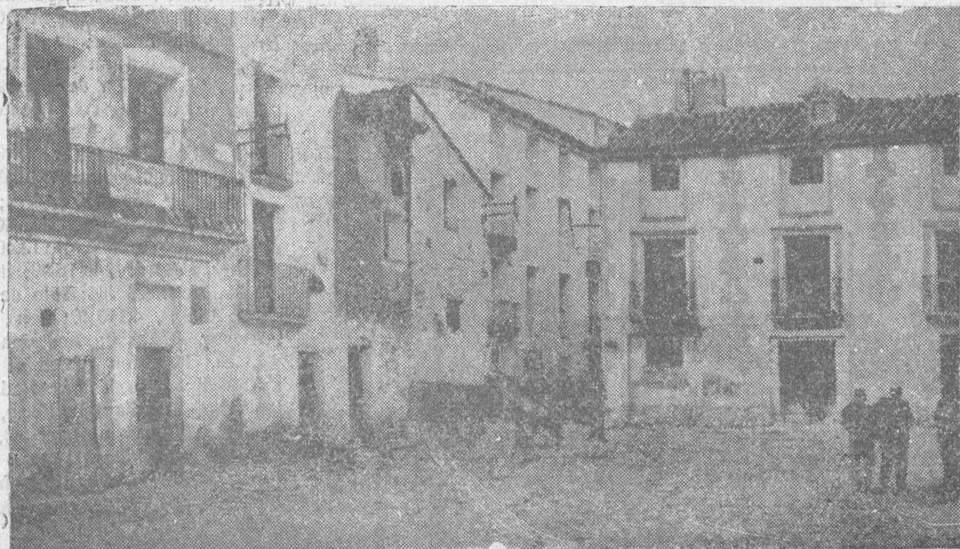
La plaza del pueblo de Novallas, donde se desarrollaron los sangrientos sucesos del domingo último después de la celebración de un mitin de Renovación Española