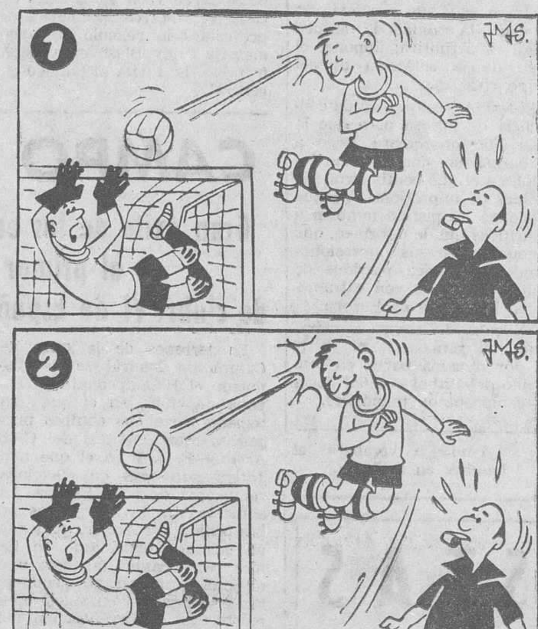
Estos dos dibujos son aparentemente iguales. Siete diferencias los separan. Si es usted buen observador debe descubrirlos antes de cinco minutos (La solución mañana)