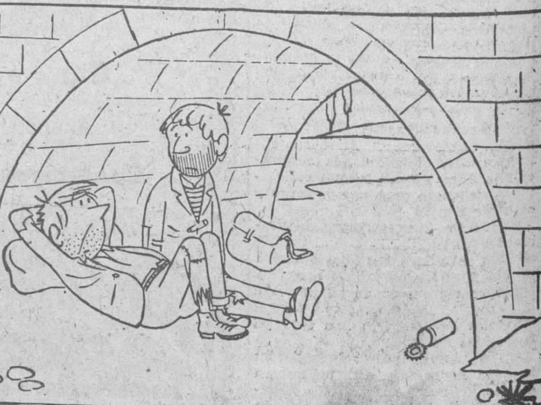
—Estoy baldado; figúrate que me he pasado toda la noche soñando que trabajaba.