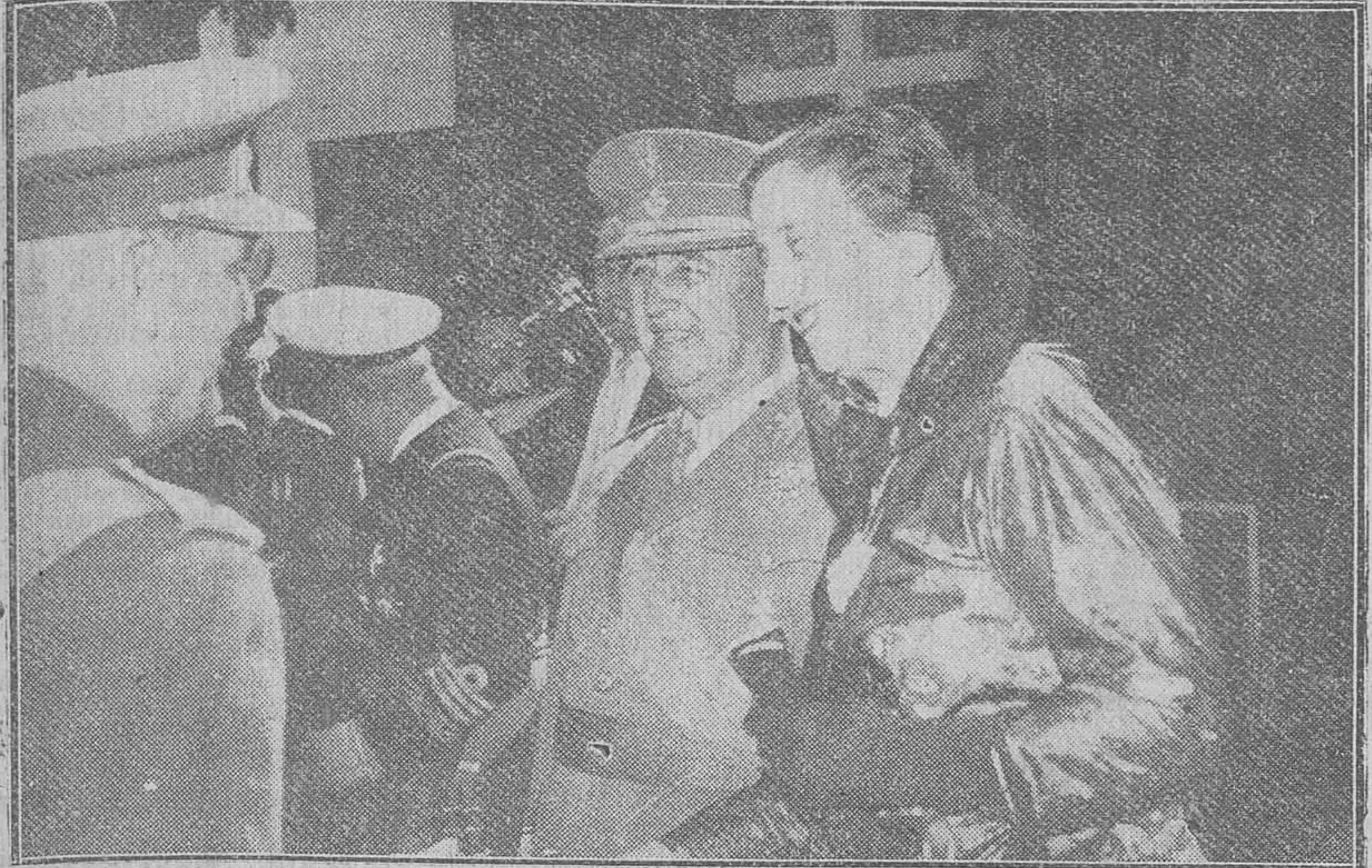
Madrid. — S. E. el jefe del Estado, acompañado de su esposa, doña Carmen Polo de Franco, recibe la felicitación de uno de los generales del Ejército de Tierra, durante la recepción celebrada en El Pardo, con motivo de la onomástica del Caudillo.