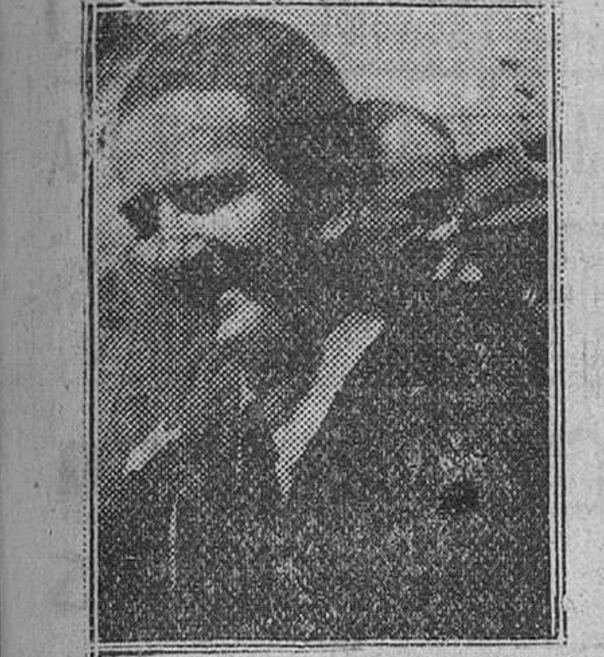
El Rey Pedro a su llegada a Madrid

La hora de verano durará hasta el 22 de Octubre en que Gran Bretaña volverá oficialmente a la hora del meridiano de Greenwich.—Efe.