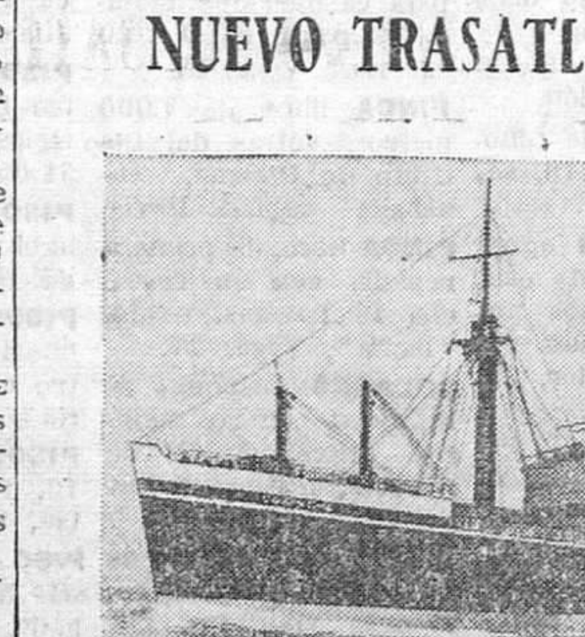
Los constructores británicos de buques siguen siendo los mejores del mundo, no obstante todas las dificultades actuales y las escaseces de material y peatros. El nuevo trasatlántico "Corinthia", de Shaw Savill, es el mayor buque construido en los astilleros del Mersey desde la guerra, y por su magnificencia hace crédito a sus constructores, Cammell Laird de Birkenhead. Desplaza 15.000 toneladas y se utilizará para el tráfico de pasajeros, y carga entre la Gran Bretaña, Africa del Sur, Nueva Zelanda y Australia.