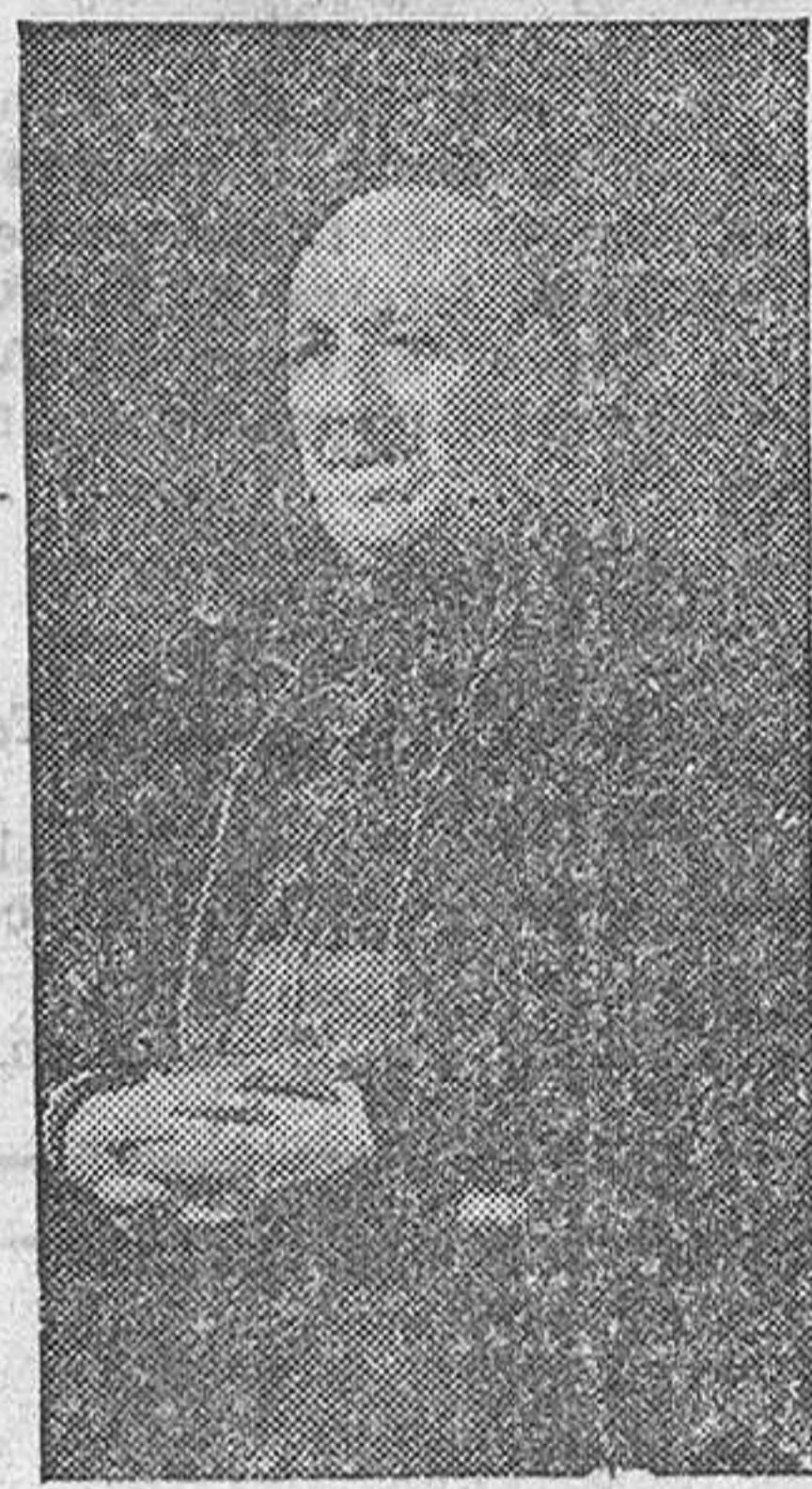
de nuestra historia y en la prosperidad y adelanto integral de la Patria. Burgos 26 de Junio de 1947.—LUCIANO, Arzobispo de Burgos.

En unidad de pensamiento y anhelo exhortamos a todos nuestros diocesanos a que, pensando en la transcendencia de la Ley y en el futuro de España, cumplan su deber patriótico y religioso, emitiendo su voto según los dictados de su conciencia y con la vista puesta en los postulados