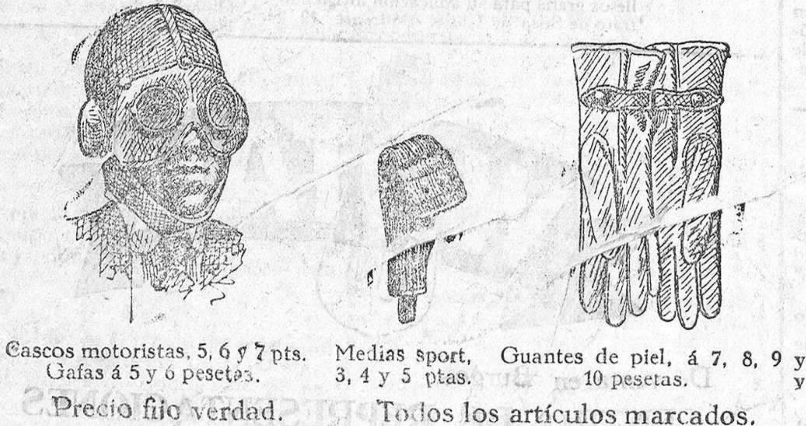
Cascos motoristas, 5, 6 y 7 pts. Medias sport, Guantes de piel, á 7, 8, 9 y 10 pesetas. Gafas á 5 y 6 pesetas. Todos los artículos marcados.