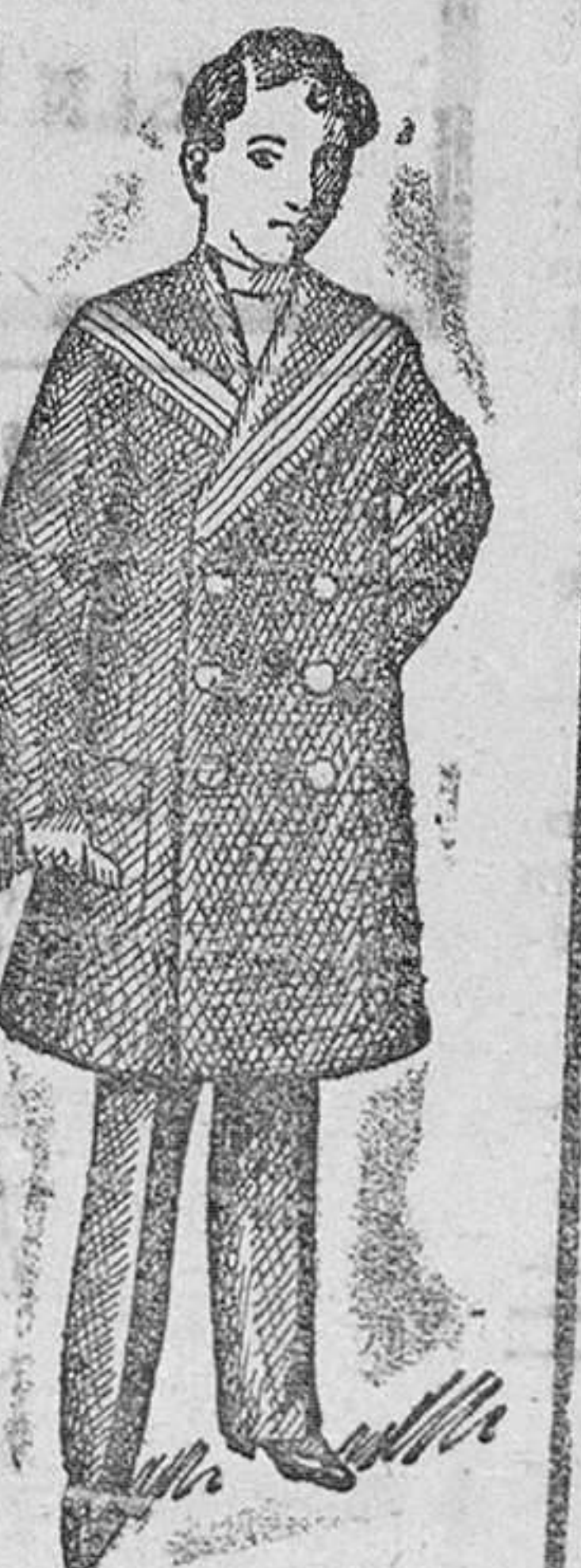
Matelos para niños, en vicuña azul y negro, desde 25 á 50 pts.