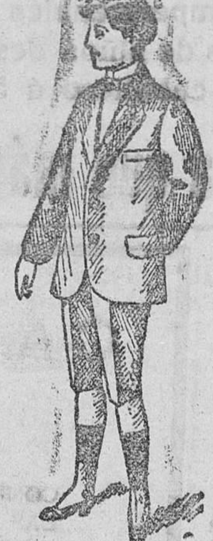
Trajecitos para jóvenes desde 25 á 50 pesetas.