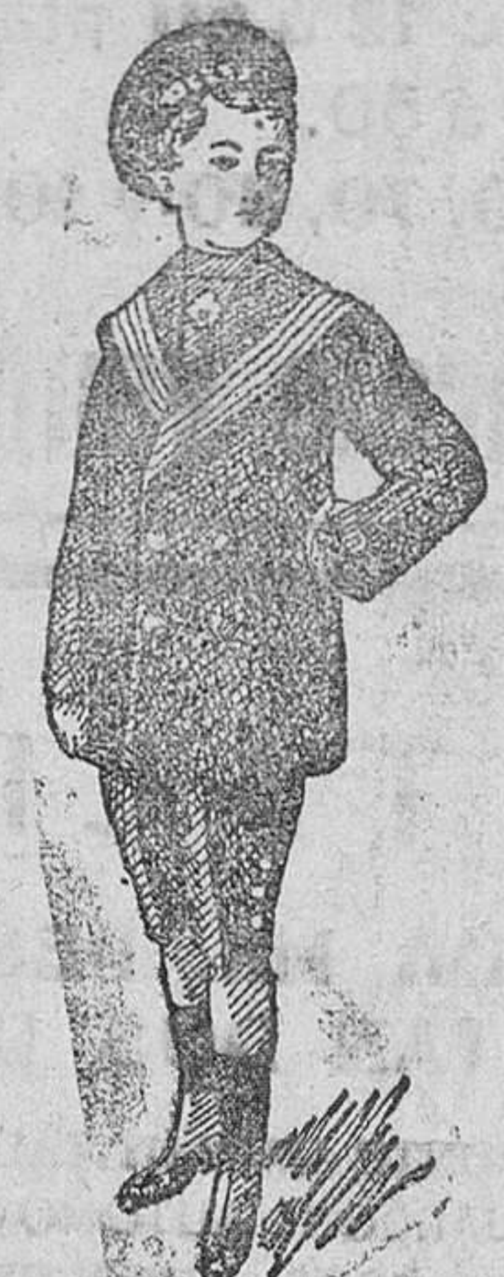
Trajes azules, casaca, desde 20 á 55 pesetas.