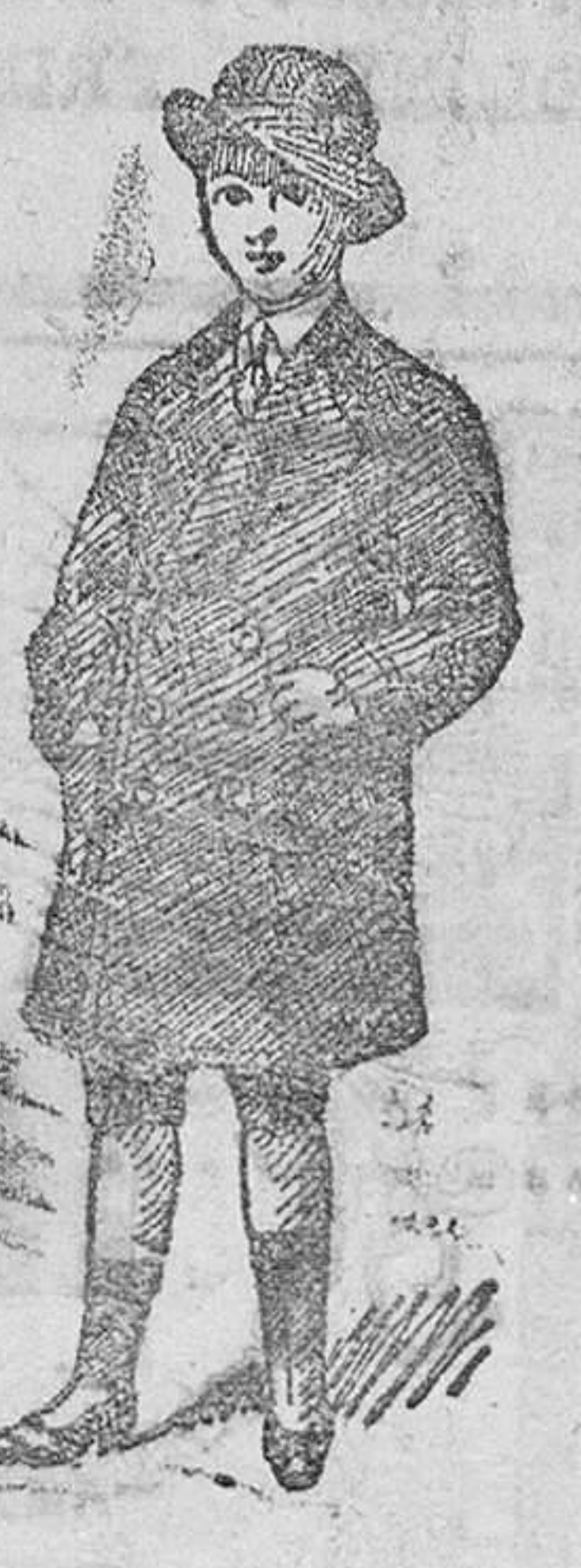
Gabancitos para jóvenes, forma novedad, desde 40 á 90 pesetas.