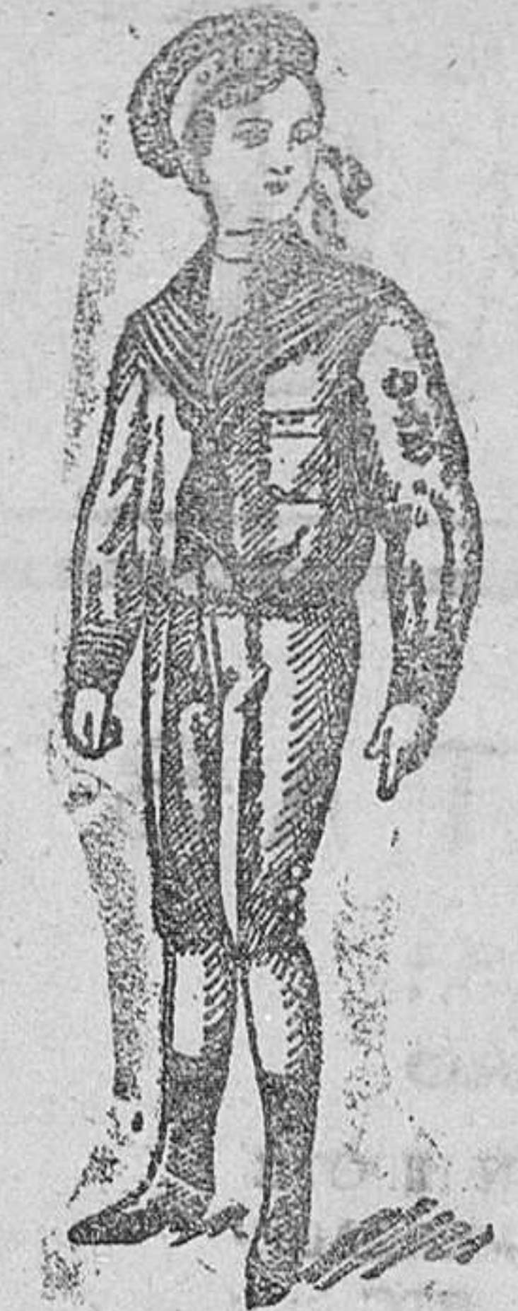
Trajecitos vicuña azul á 15, 17 y 20 pesetas.

Primera casa en confecciones de caballero, señora, niños y niñas