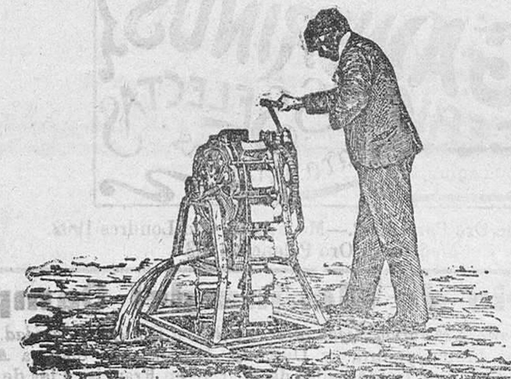
Noria de mano

Los construye de los sistemas más modernos, á precios económicos, Felix Callejo, en Sotillo de la Ribera.