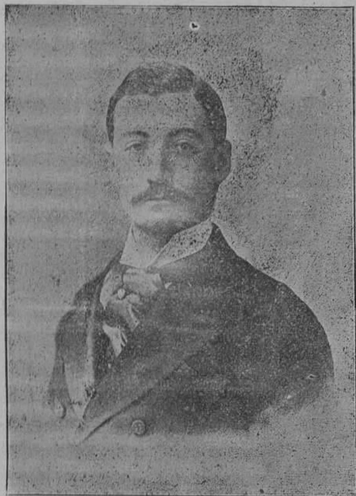
EXCMO. SR. DUQUE DE SANTOÑA Diputado á cortes por el distrito de Castro-Laredo