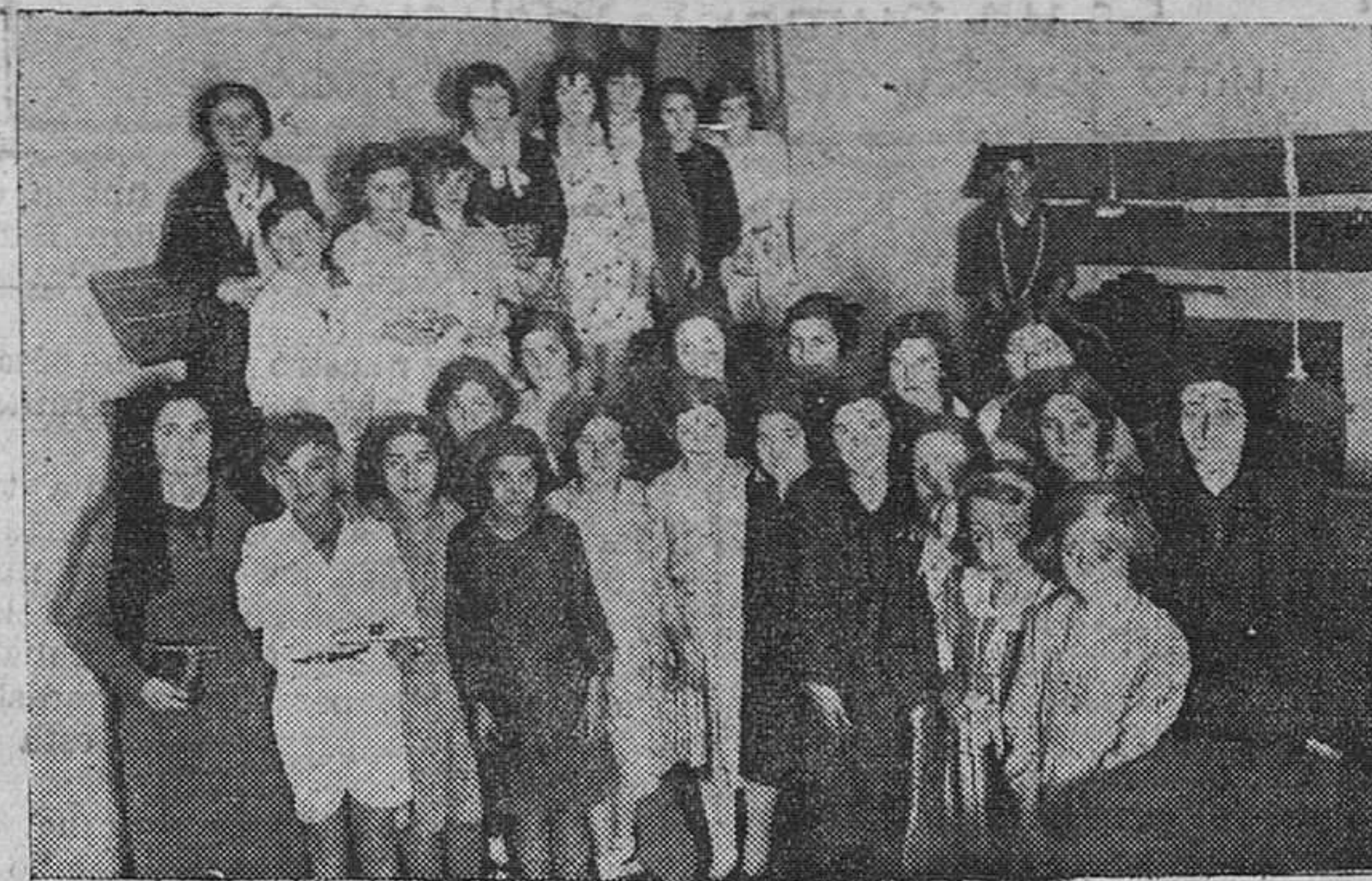
Los niños de las escuelas de San Vicente de la Barquera, en una visita que hicieron a nuestros talleres.