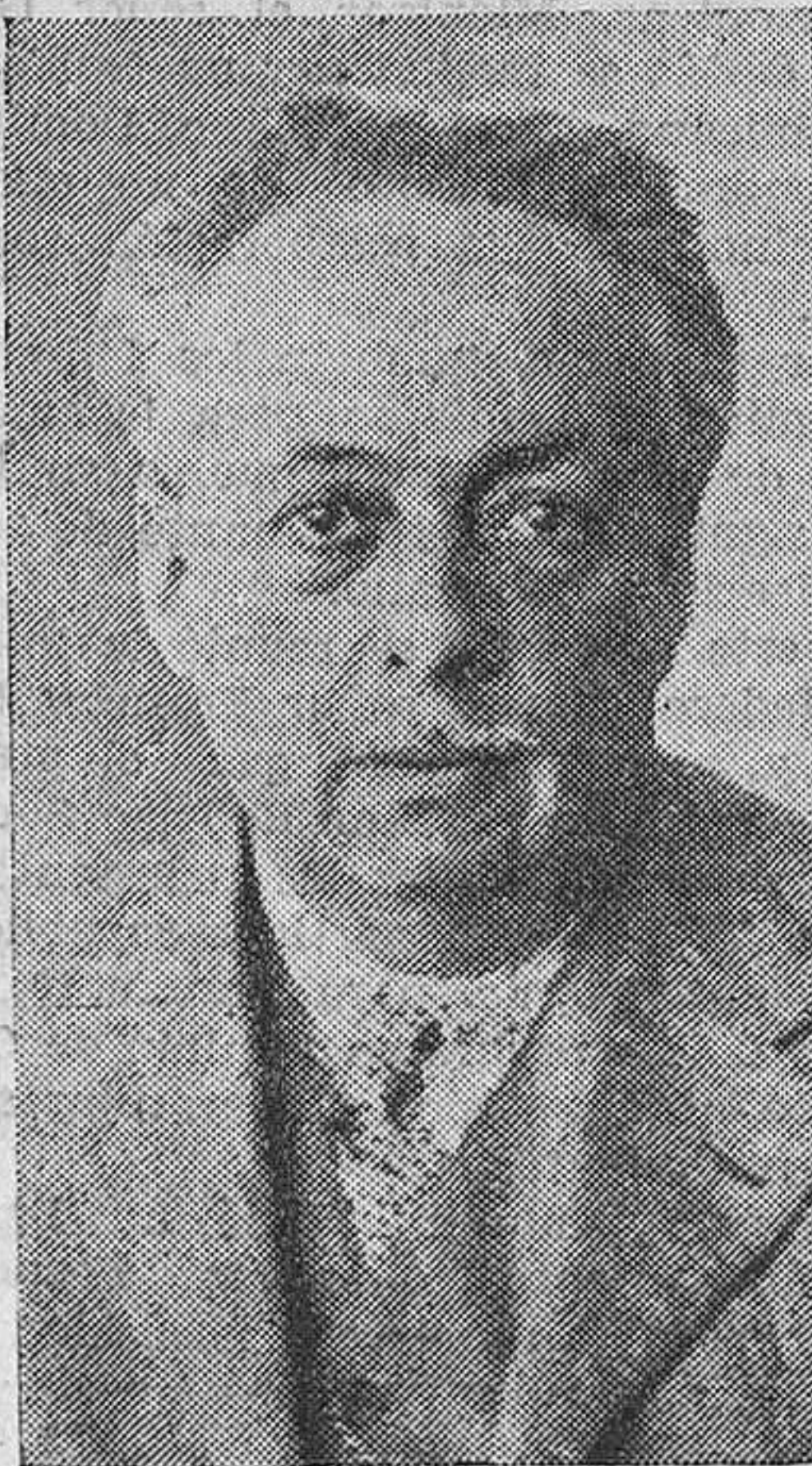
El eminente profesor español don Blas Cabrera, que explica durante esta semana, en la Universidad Internacional de verano, un curso de notables conferencias acerca de «La Materia y las radiaciones».