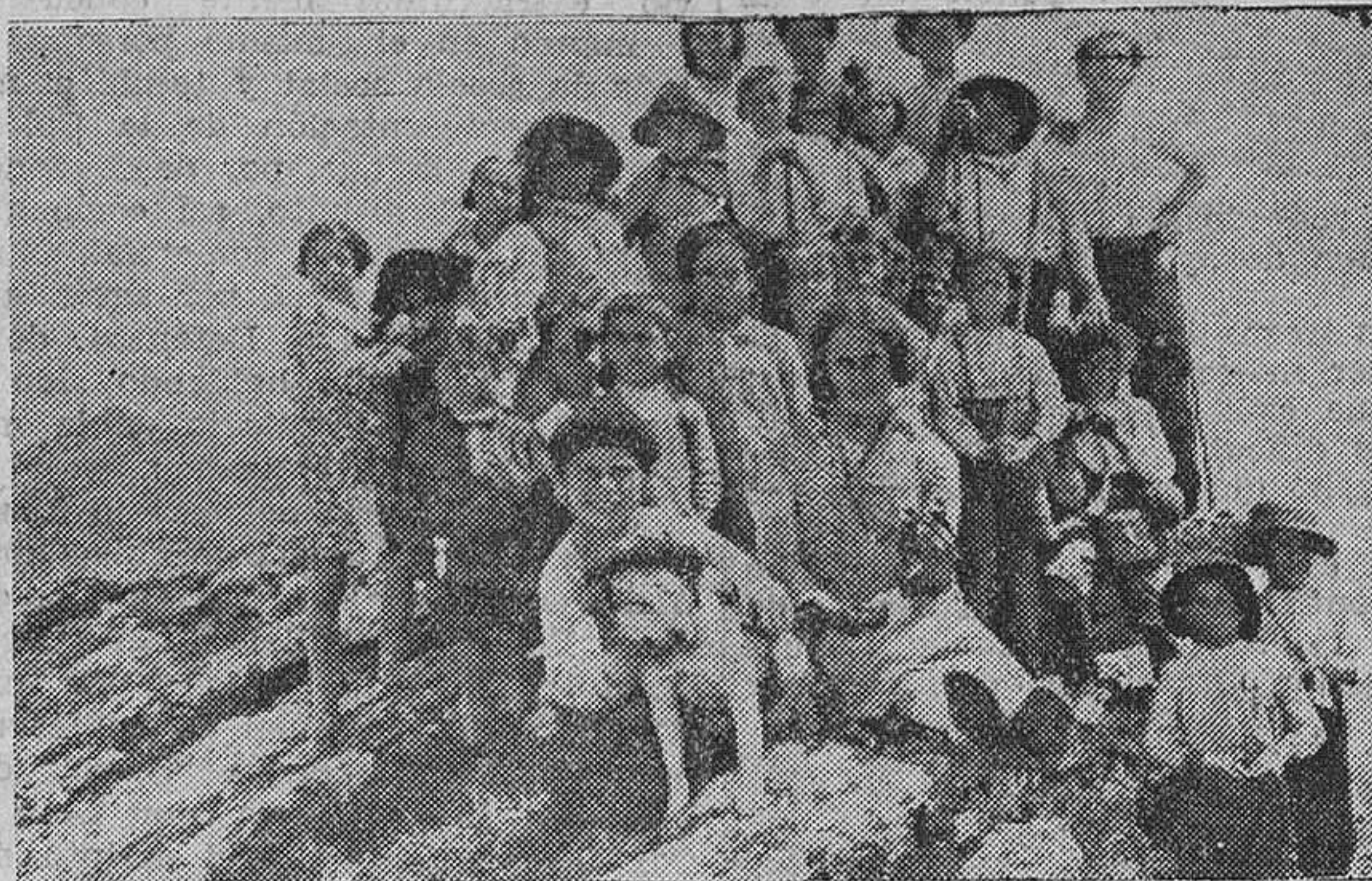
Los alumnos de la escuela de Abiada (Campoo de Arriba) en Pico Tres Mares.