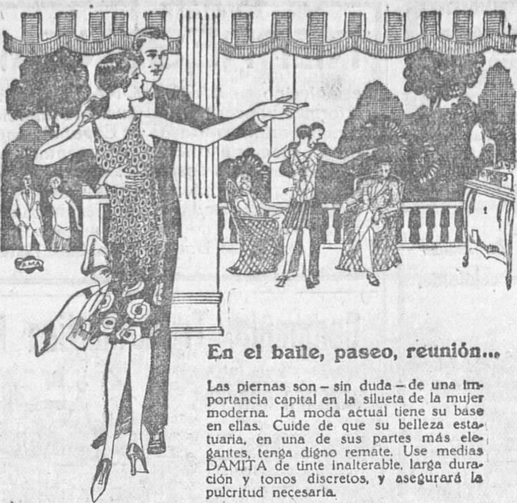
En el baile, paseo, reunión...

Las piernas son—sin duda—de una importancia capital en la silueta de la mujer moderna. La moda actual tiene su base en ellas. Cuida de que su belleza estatuaria, en una de sus partes más elegantes, tenga digno remate. Use medias DAMITA de tinte inalterable, larga duración y tonos discretos, y asegurará la pulcritud necesaria. Pídalas en todas partes por su nombre DAMITA.