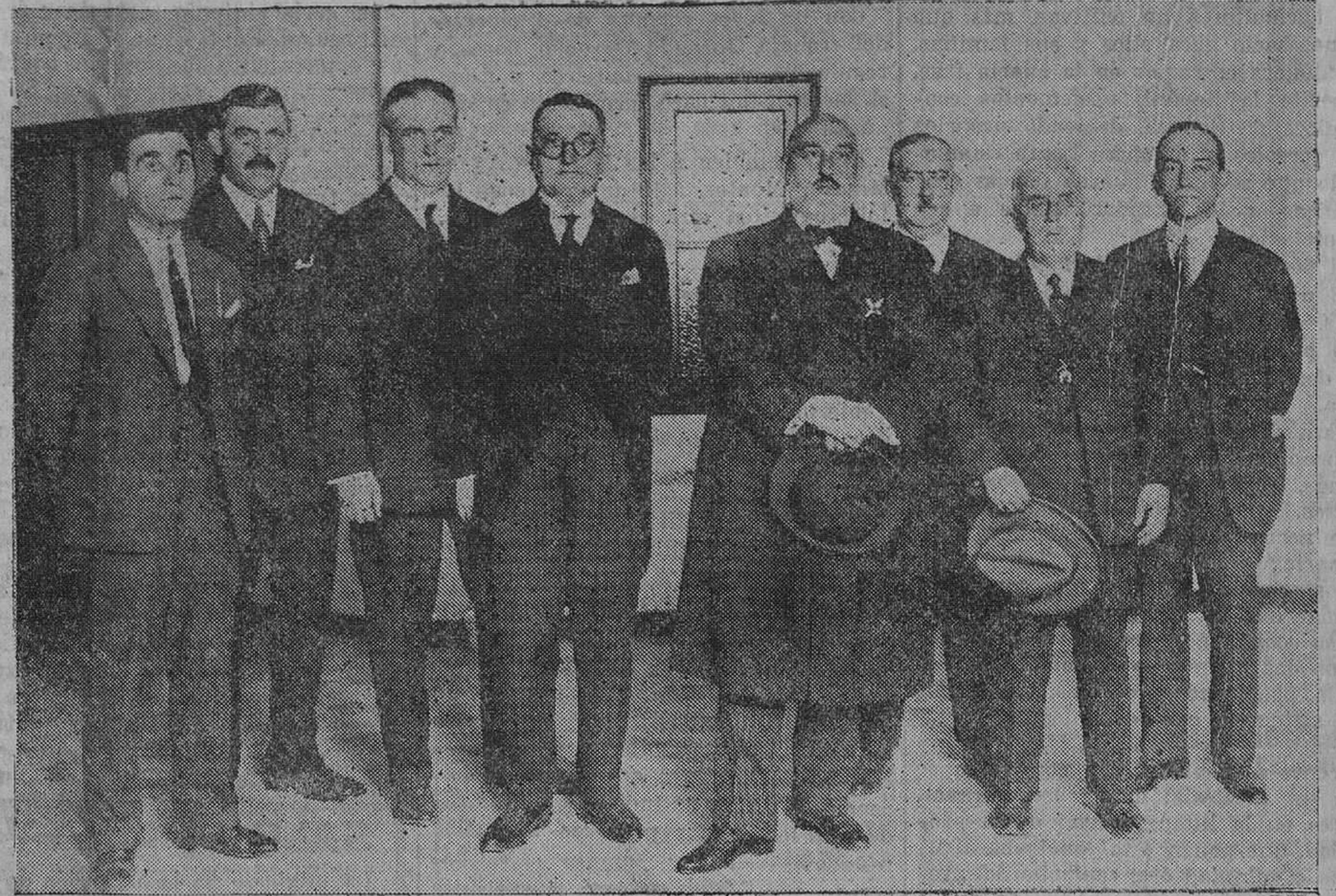
El ex ministro don Angel Ossorio, después de dar anoche su conferencia, acompañado de la Junta Directiva del Círculo Mercantil.

MEDICINA INTERNA Aparato digestivo y enfermedades de la nutrición. De 41 a 4 y de 4 a 5. ISABEL II, 2. PRIMERO