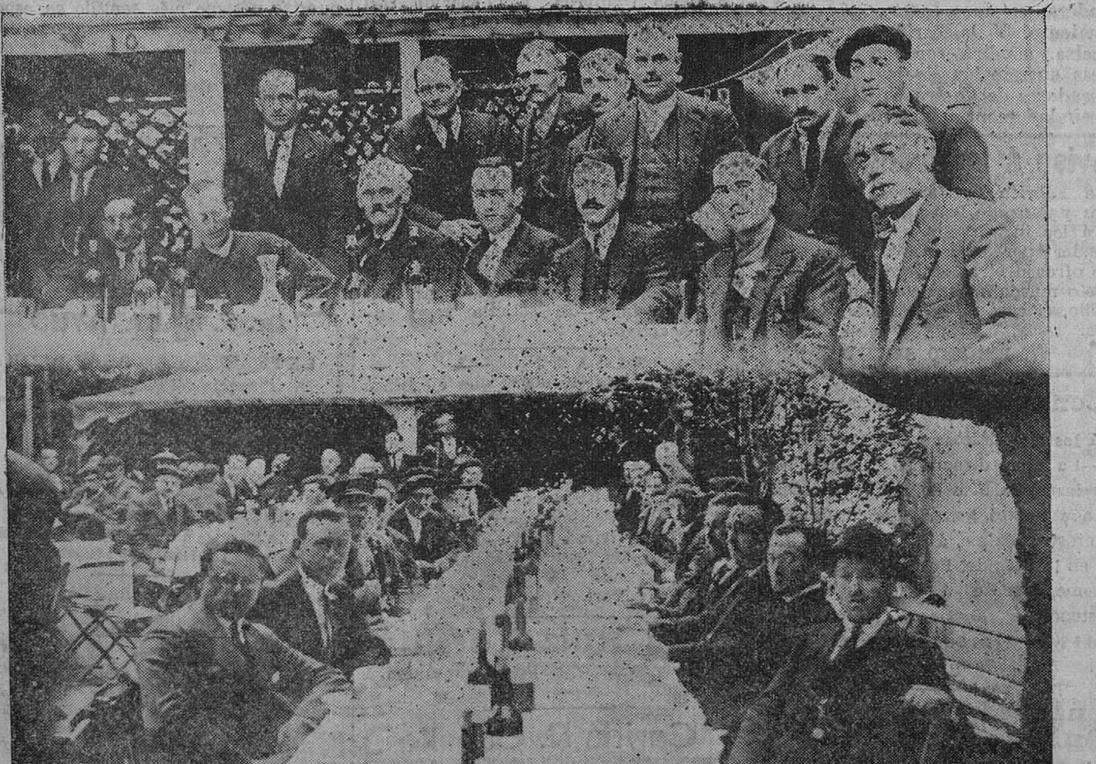
Los empleados municipales se reunieron ayer en fraternal fiesta.—La presidencia del acto y un grupo de comensales.

A medida que aumenta la población del mundo, va reduciéndose la parte que a cada uno corresponde en los bie-