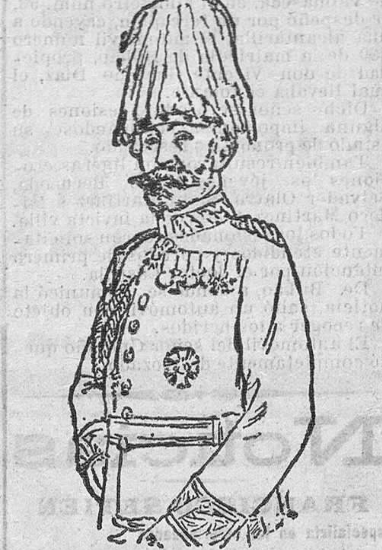
El general Bothmer, que manda el ejército austro-alemán de la región del Stirya.