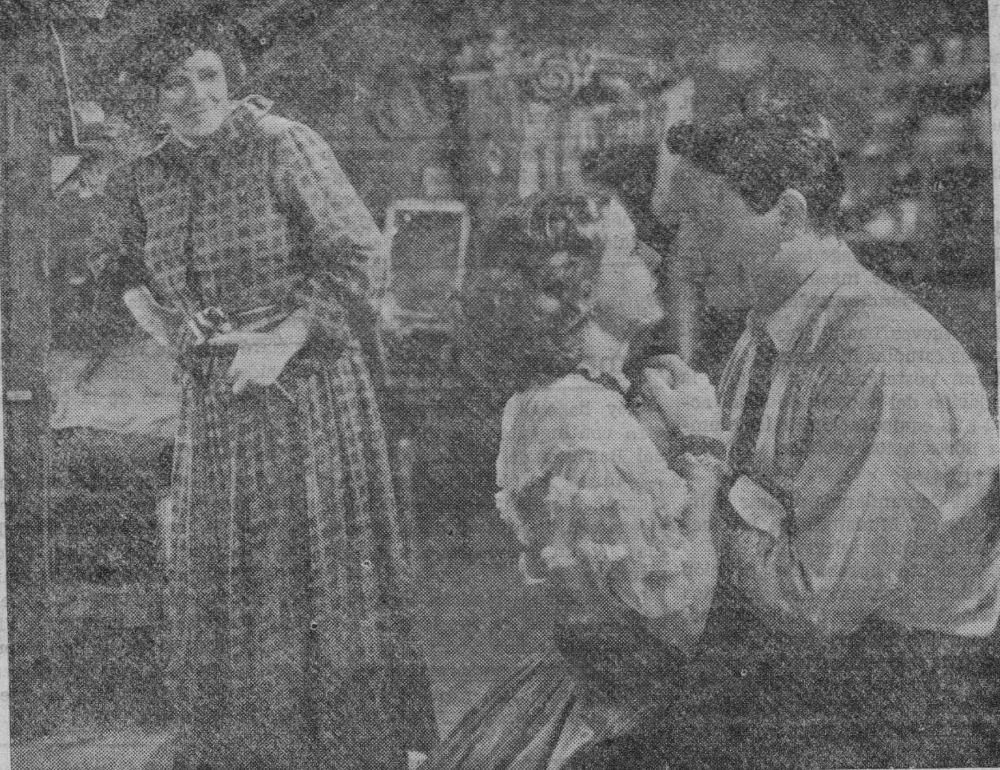
Una escena de la superproducción Columbia, hablada en español. FUEROS HUMANOS, que distribuye la CIFESA