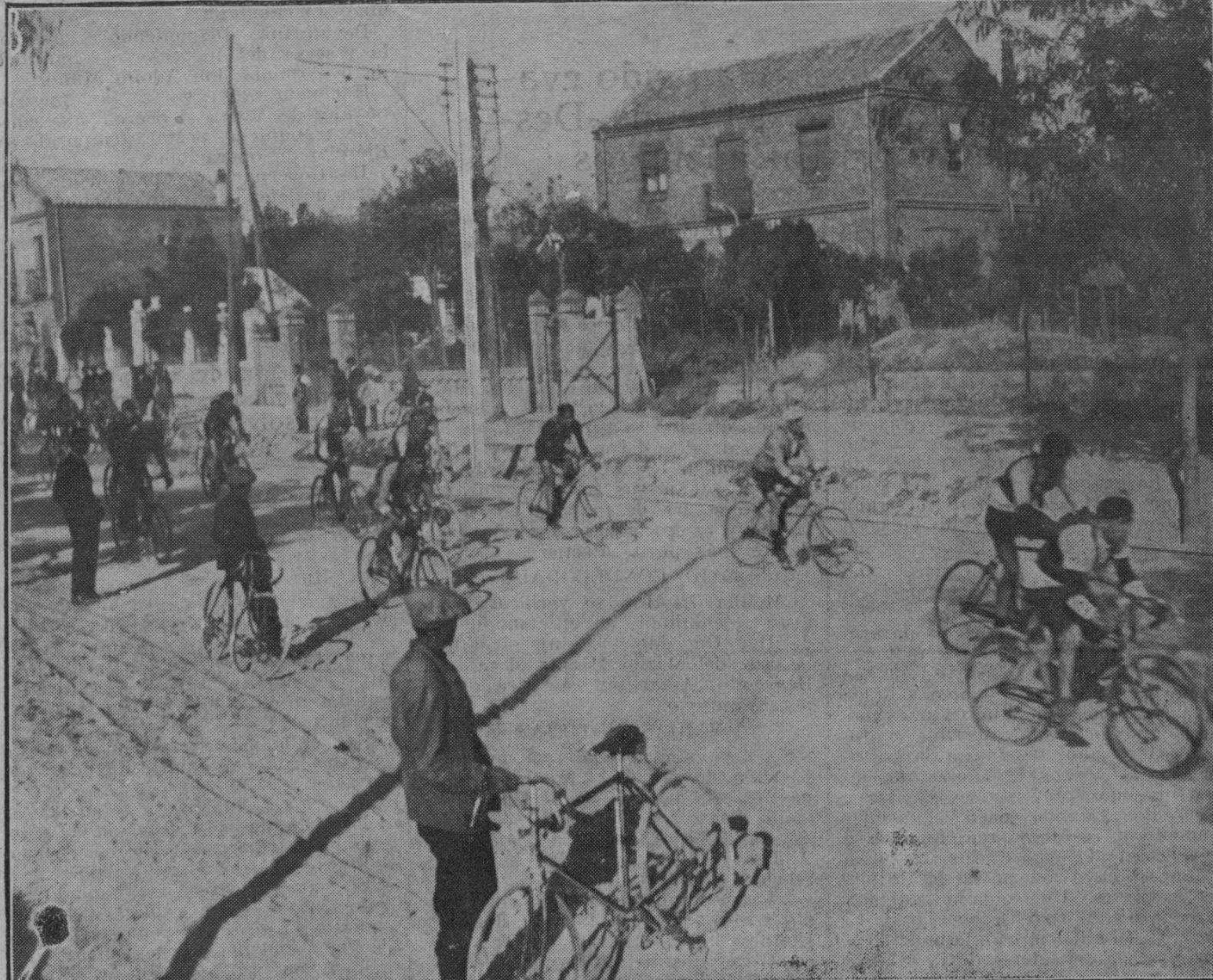
UN MOMENTO DE LA TERCERA PRUEBA CICLISTA PARA NEOFITOS, CONSISTENTE EN IDA Y VUELTA A ALCALA DE HENARES

El partido terminó con el resultado de cinco a cuatro a favor de la Gimnástica.