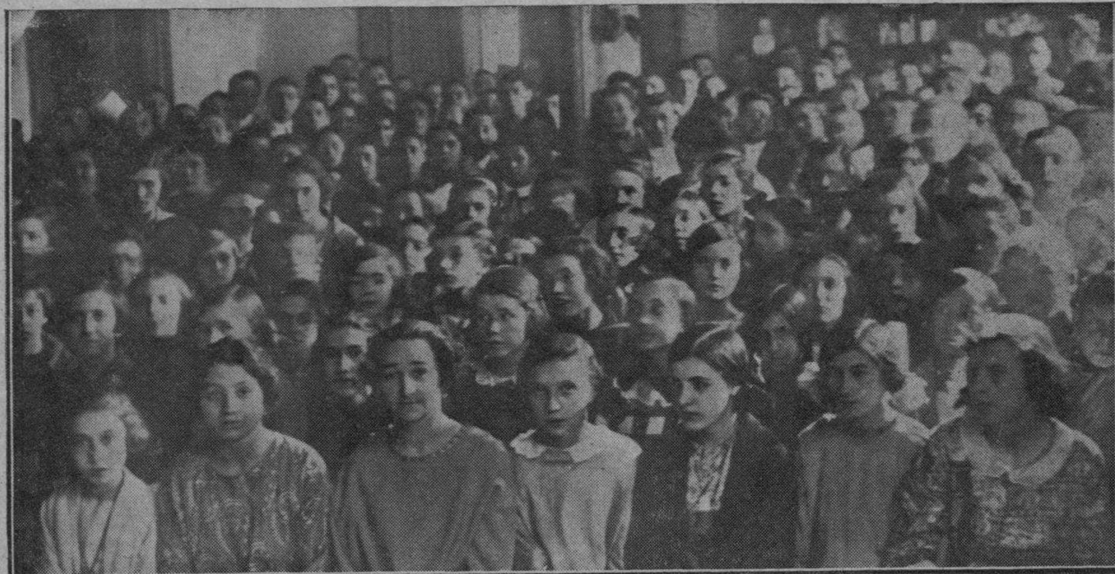
ALUMNAS Y ALUMNOS DE LA ESCUELA DE ARTES Y OFICIOS DE SESTAO, DURANTE EL ACTO MUY SIMPATICO, DE LA DISTRIBUCION DE PREMIOS

zaciones, sigue siendo, en Francia, la condecoración vistosa y honorífica.