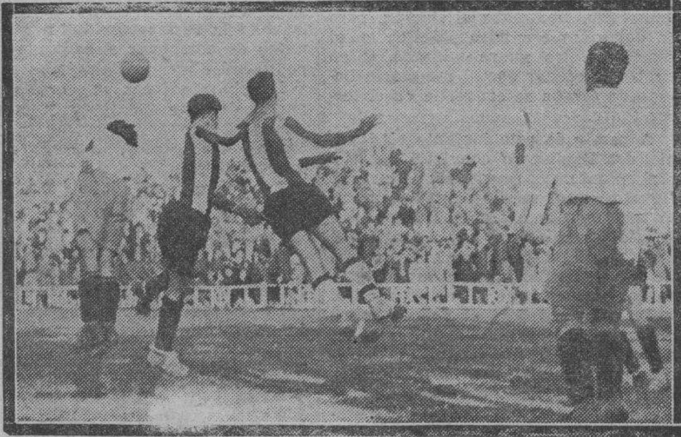
Un momento del encuentro Zaragoza-Hércules, jugado el domingo en Torrero.

Lorenzo Torres, que arbitró con acierto, formó así los equipos: