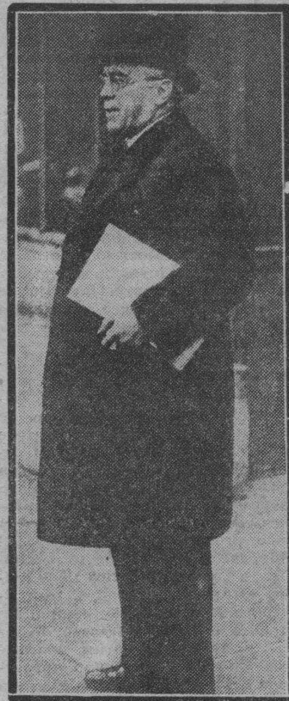
M. Albert Sarraut, presidente del Gobierno dimisionario.

Comentamos, no hace muchos días, que Francia presupuestaba para sólo aviación próximamente mil quinien-