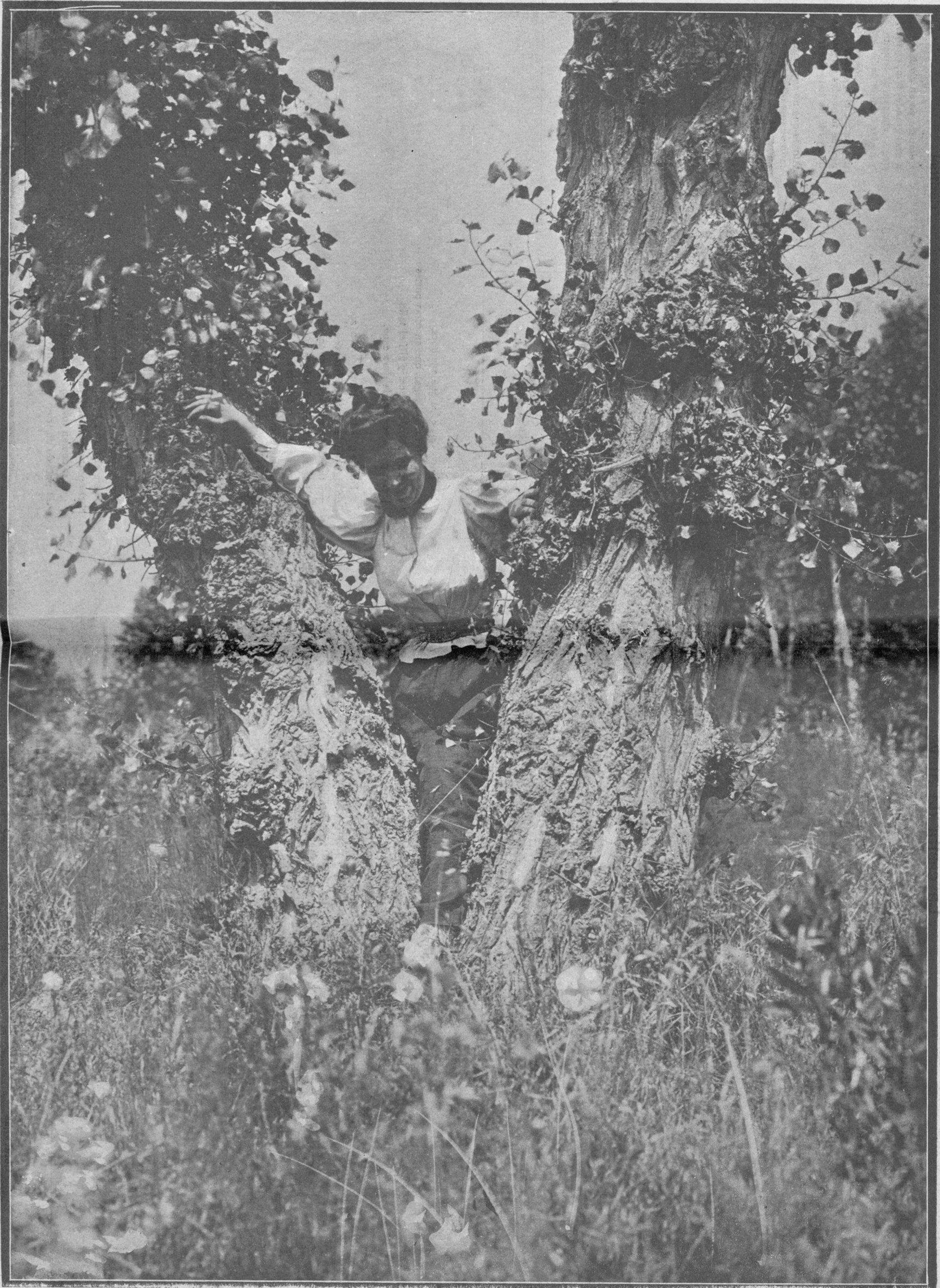
¿A QUE NO ME ENCUENTRAN?