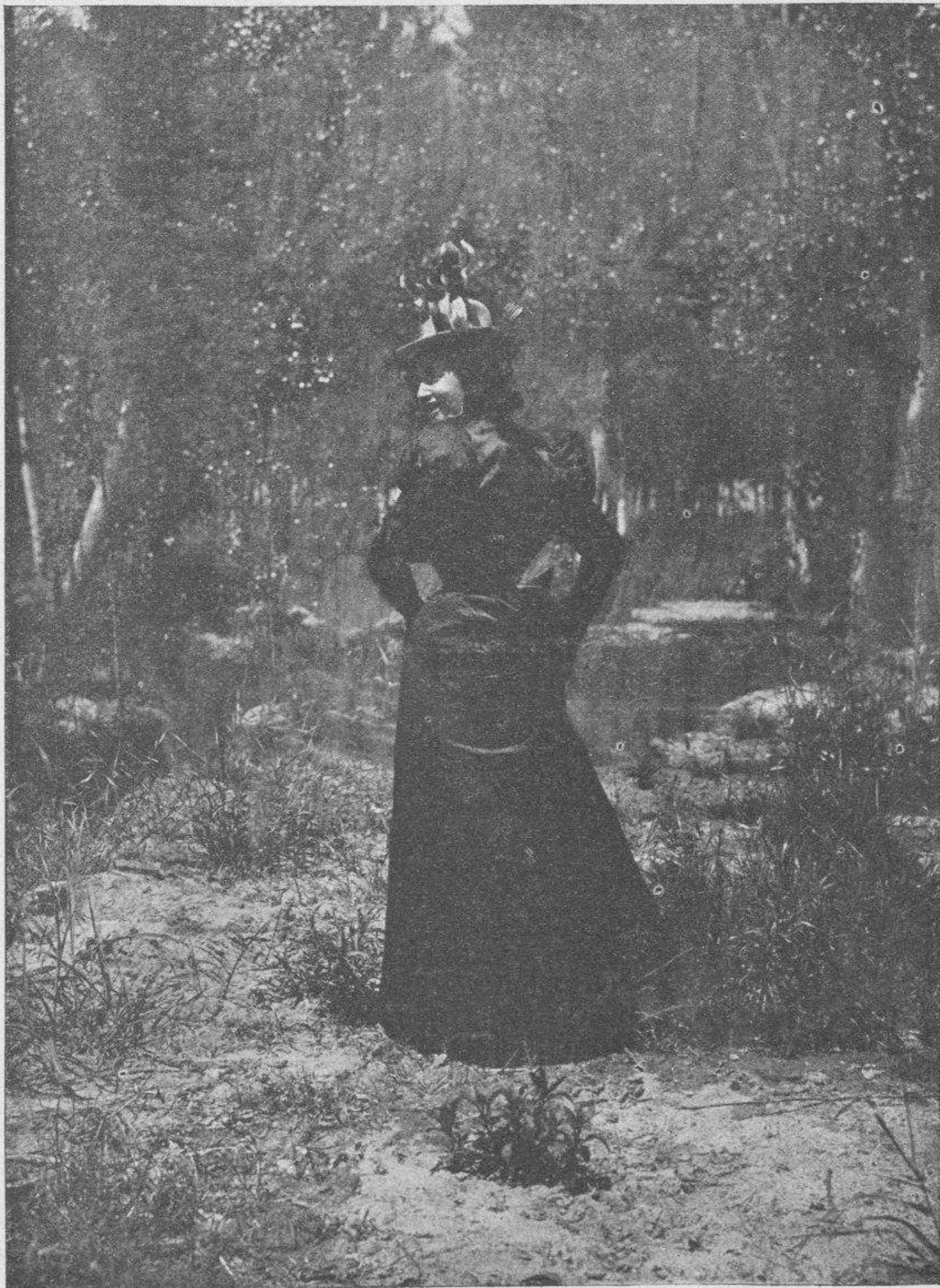
En el bosque.