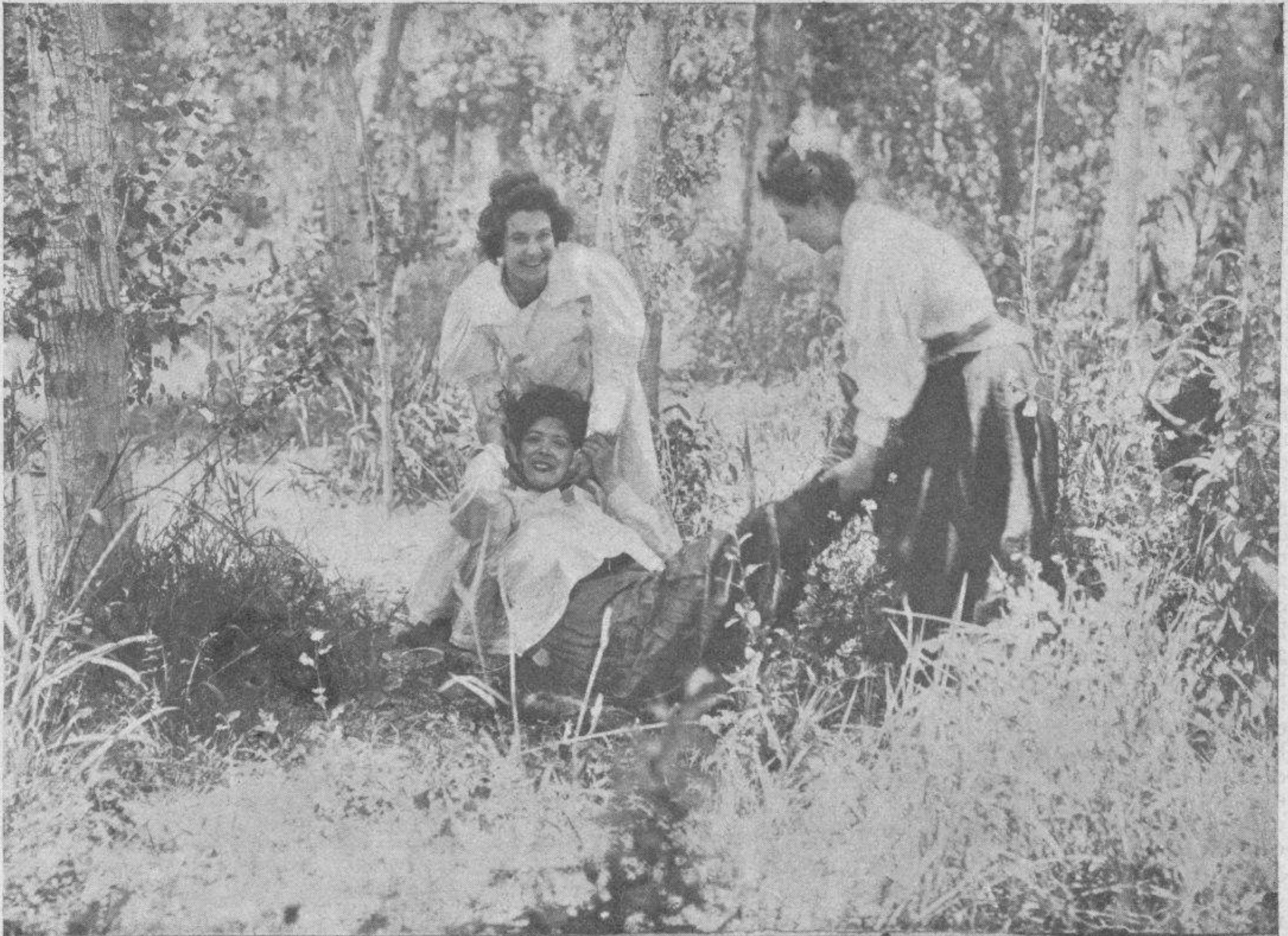
le dan tres golpecitos en el suelo,—en un lugar en donde si hay narices,—le hacen ver estrellado todo el cielo.