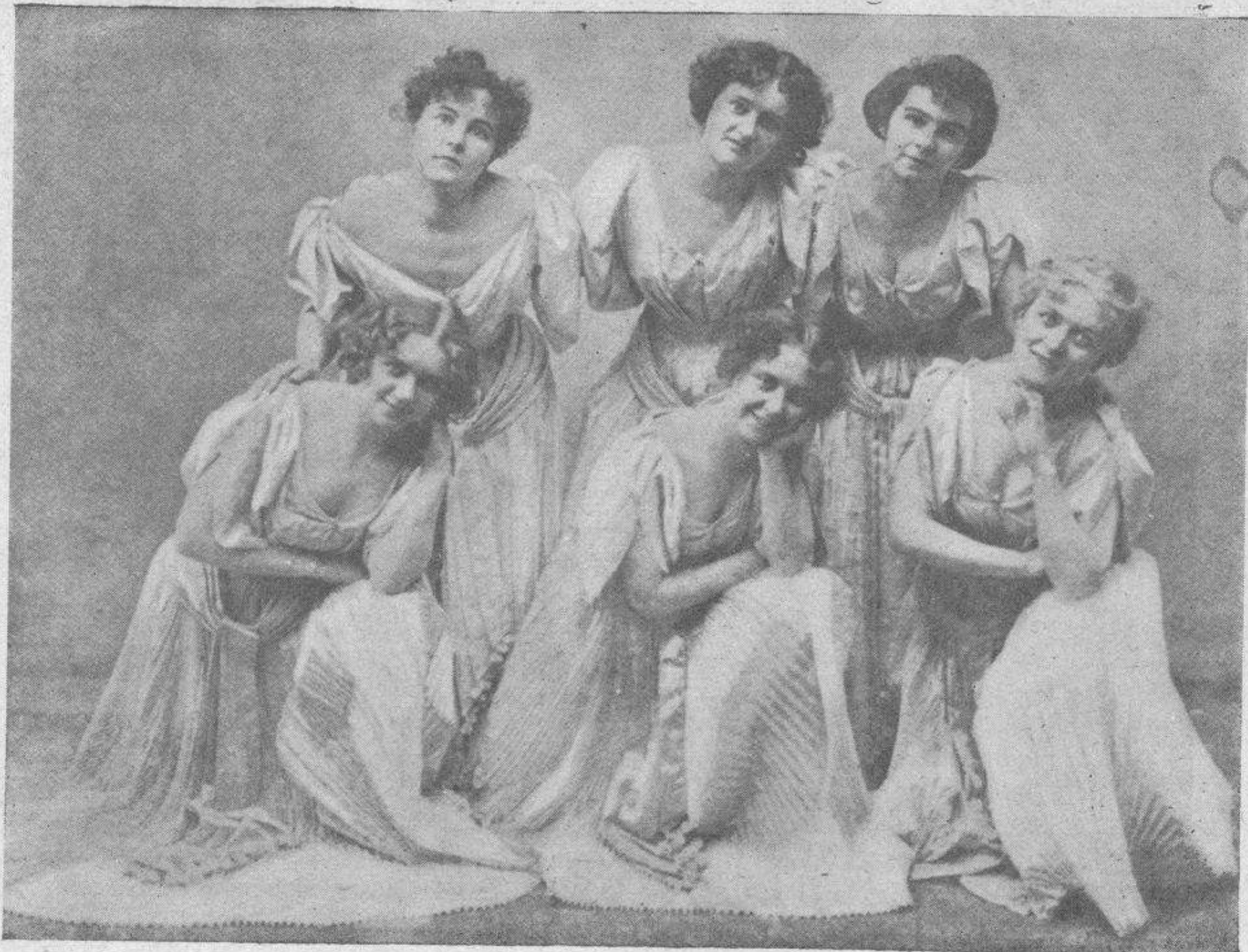
— ¿Con cuál se quedan ustedes?

Soy yo periodista, y no de los exceptuados, puesto que el ministro no exceptúa ni aun á los que hacen titeres. Cobro mis artículos donde me los pagan, (no donde me los publican, ¿qué tal, señor ministro?): ¿Y cree el señor ministro de Hacienda que voy á decirle: ahora acaban de darme cinco, diez, quince... duros? El ministro me gritará: he puesto el cinco por ciento sobre las utilidades, y yo le contestaré, repitiendo aquella célebre frase que ha quedado para memoria y lección de ministros á lo Villaverde: