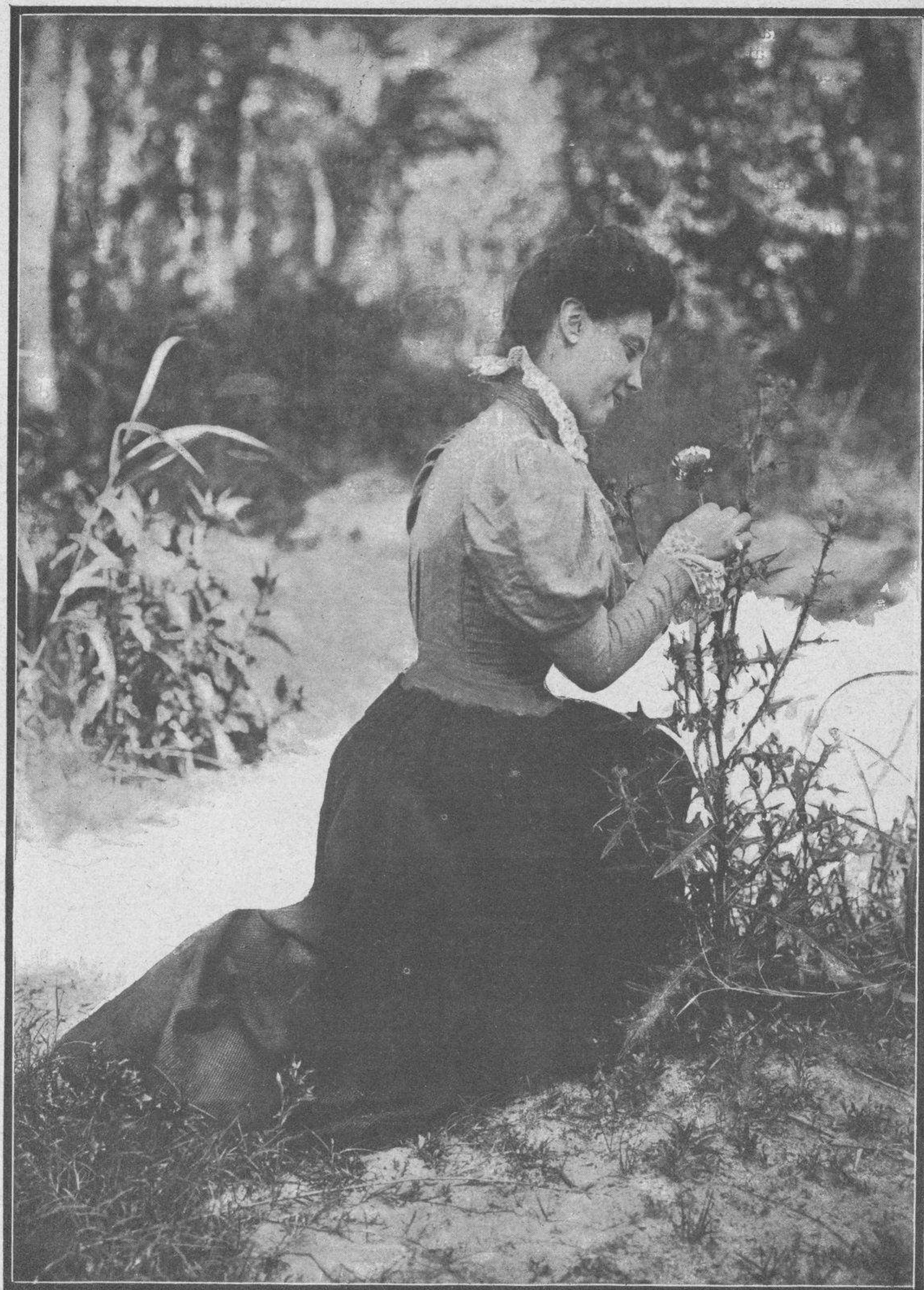
Rosa entre espinas.