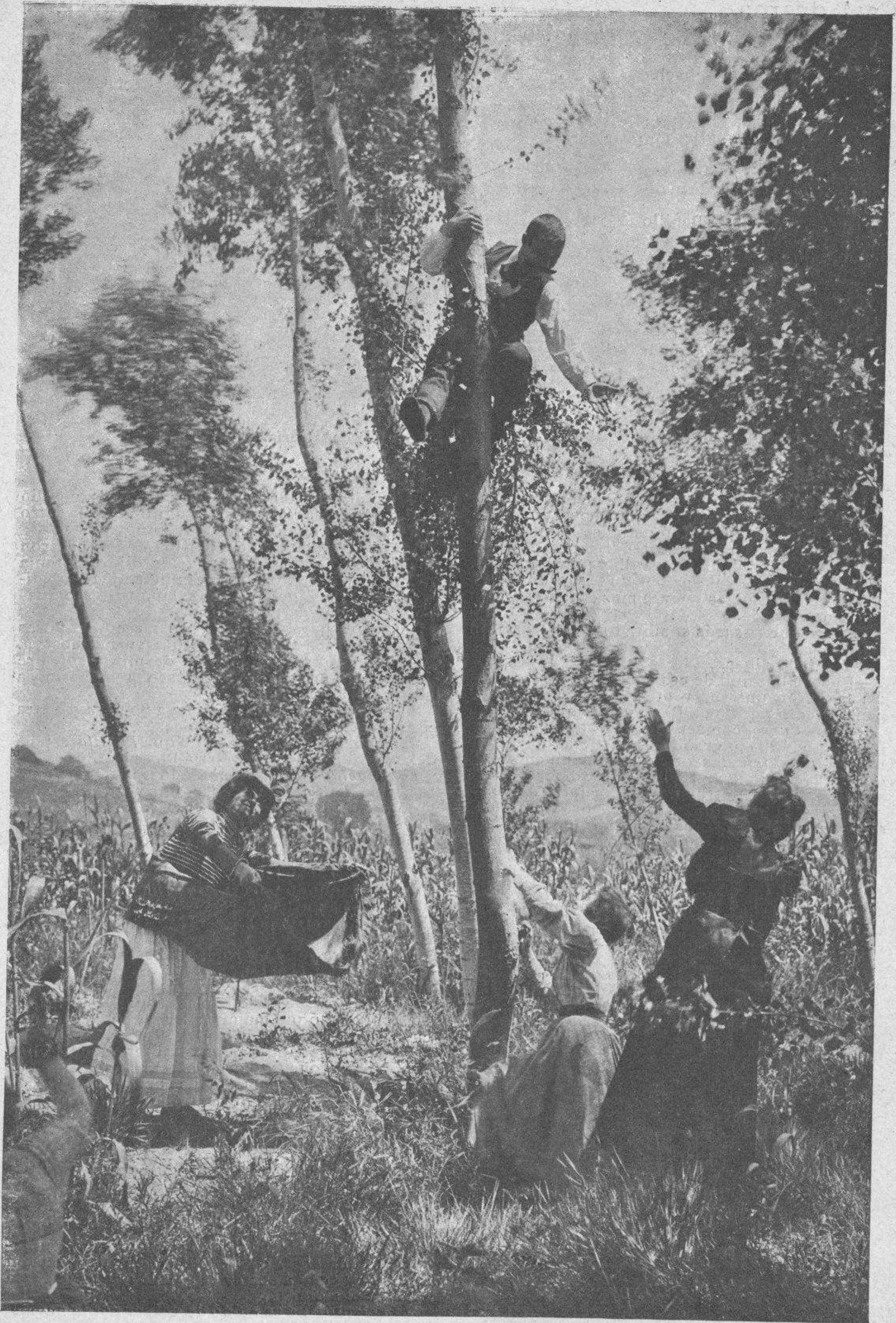
A caza de nidos,