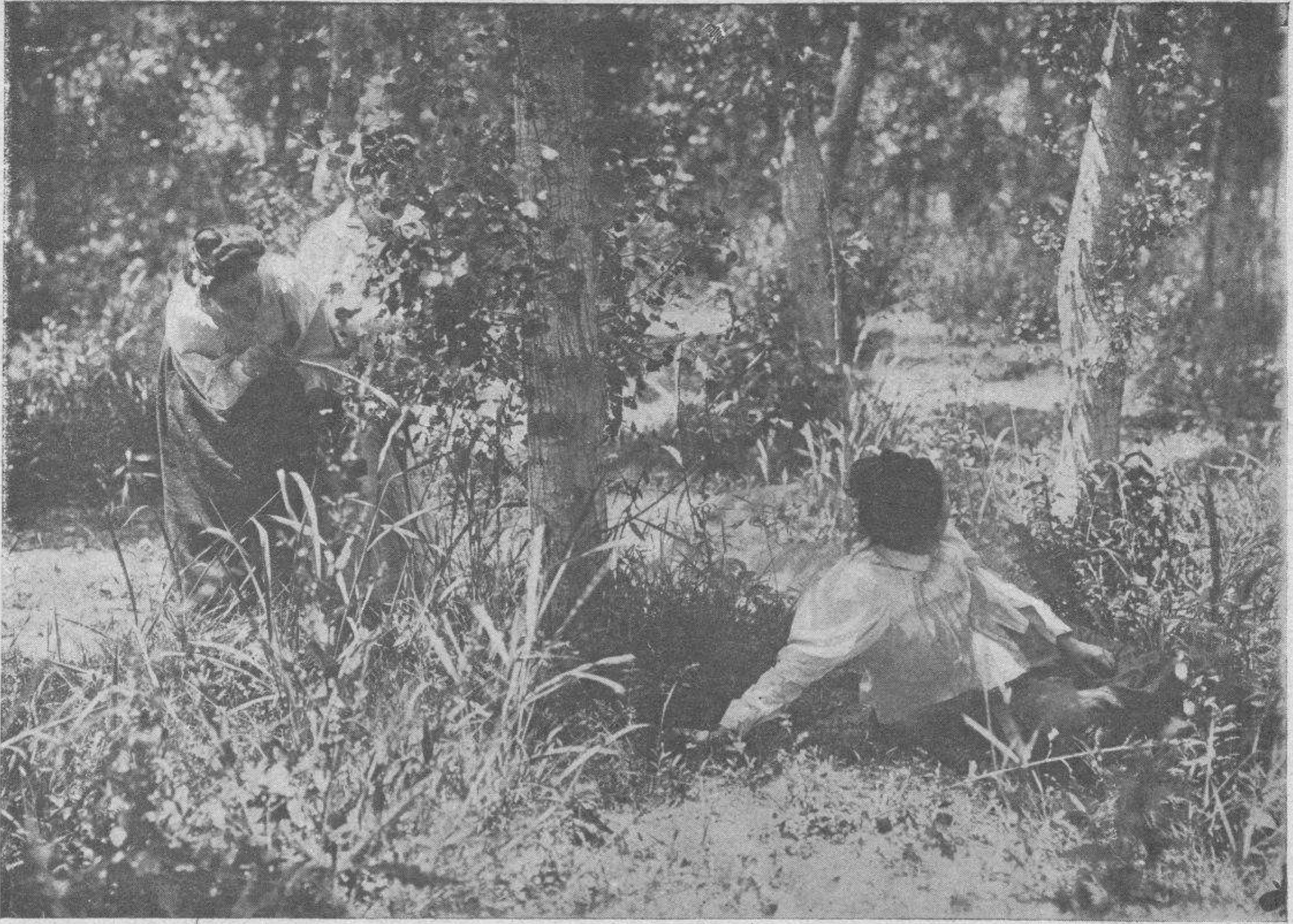
haciéndole cosquillas,—y agarrando cabeza y pantorrillas