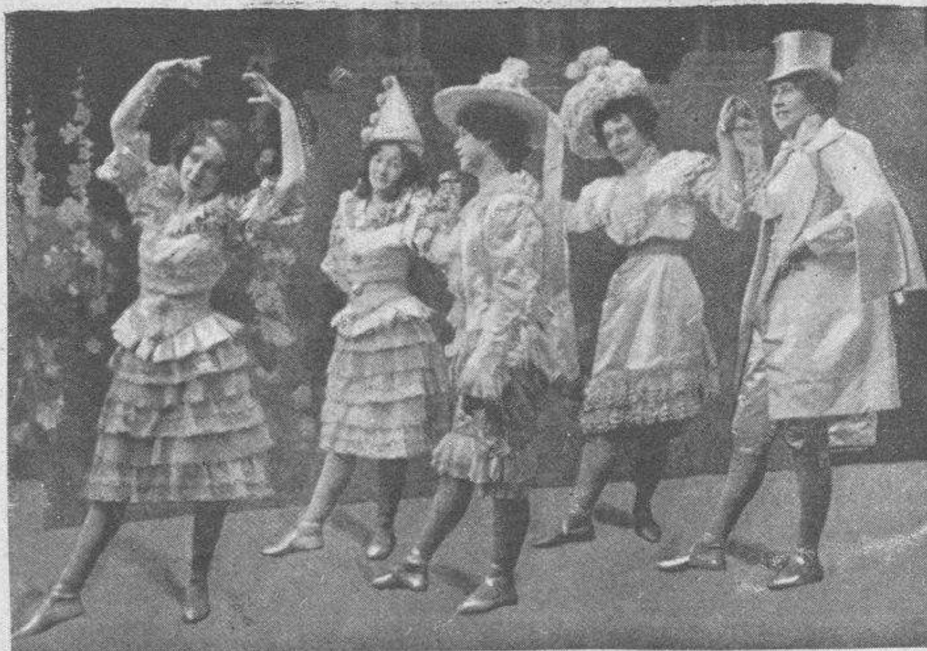
Baile de fantasía.

Comprendió que debía disimular su sentimiento y lamentó tener aquel natural de suyo envidioso que empezaba á alejarle de su mejor amigo.