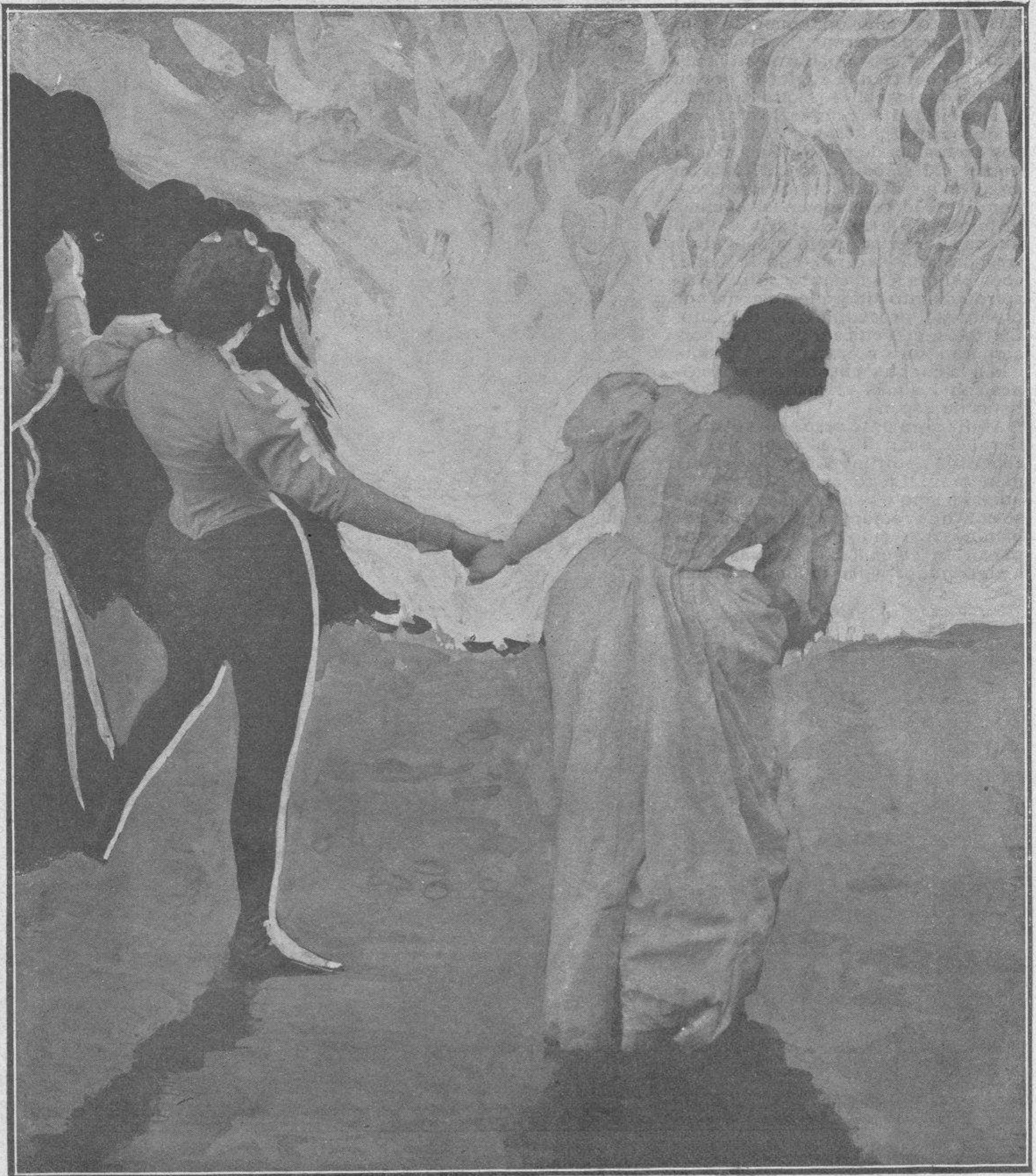
LA NOCHE DE SAN JUAN. — En las hogueras.