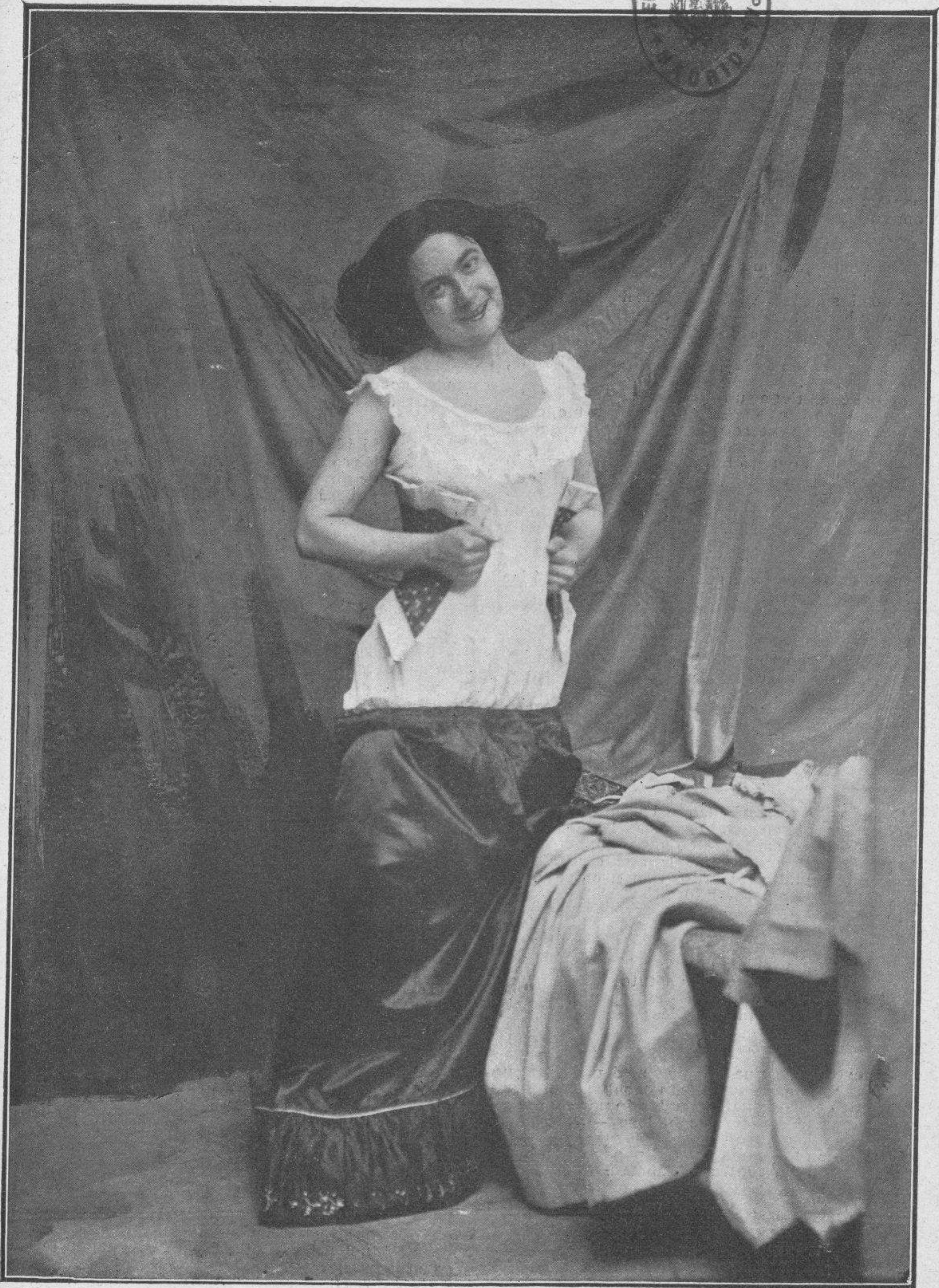
Pensando en él.