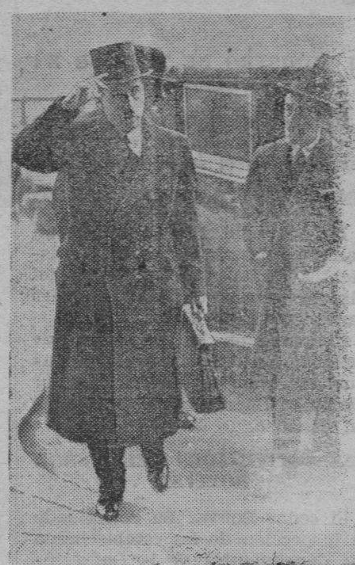
El primer ministro de Bélgica VAN ZEEELAND, a la salida de Palacio de San Jaime, en Londres.