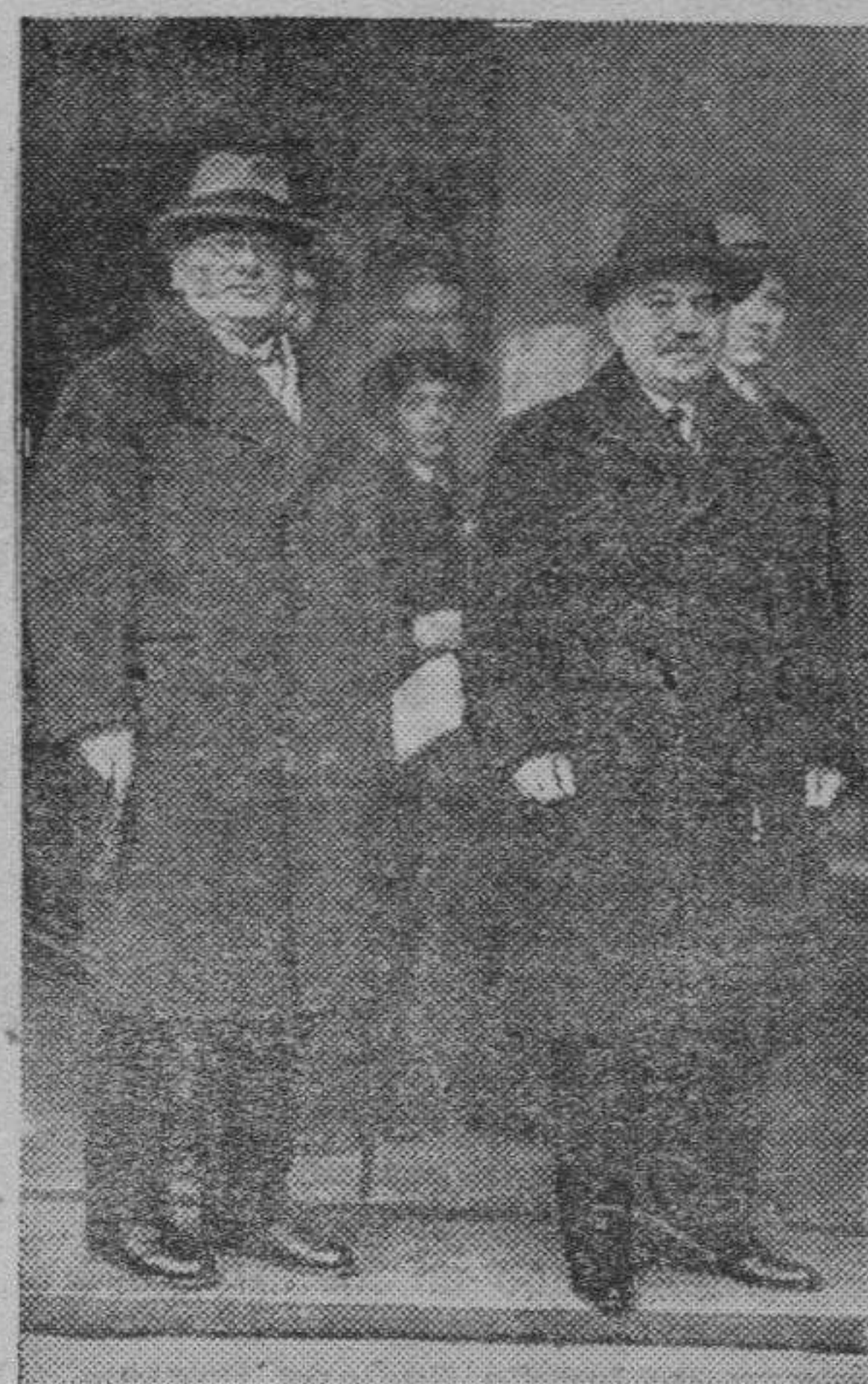
El ministro de Asuntos Exteriores de la U. R. S. S. LITVINOFF, acompañado del Embajador de los Soviets en Londres, MAISKY.