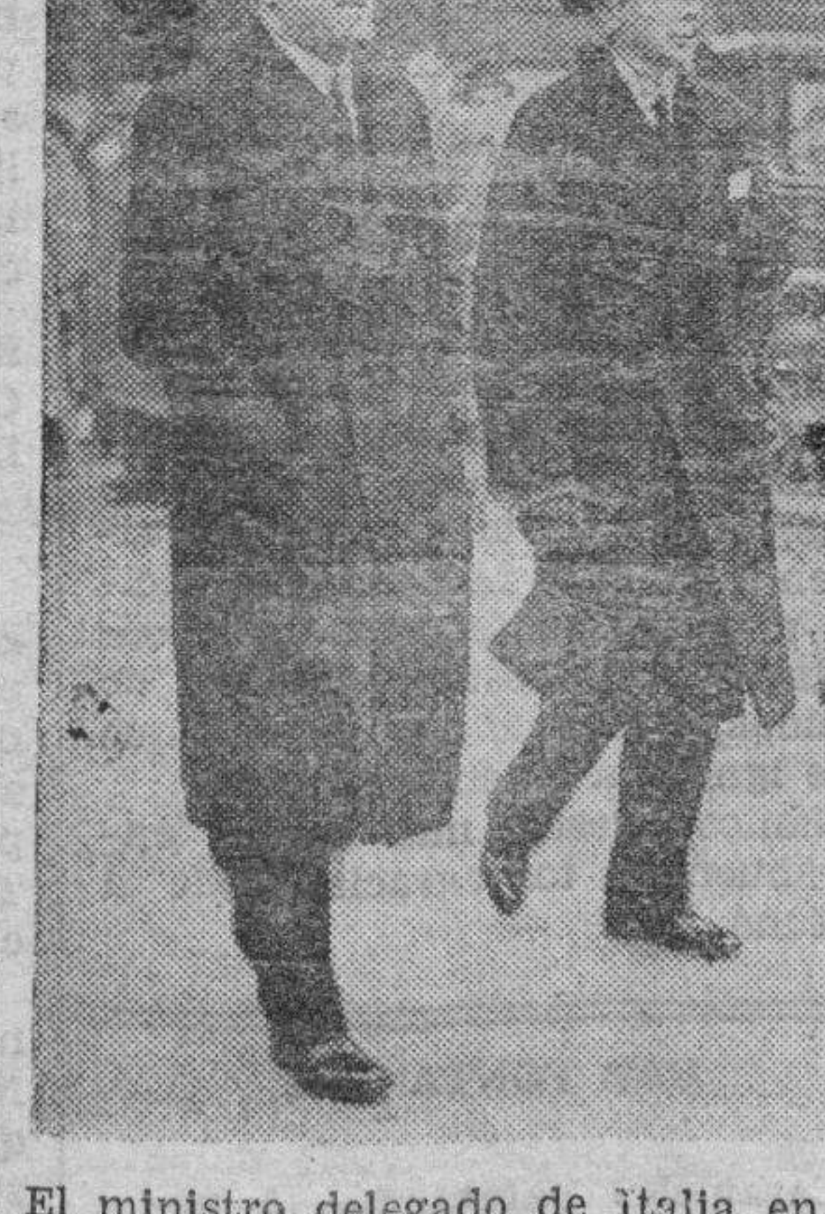
El ministro delegado de Italia en Londres, DINO GRANDI, a su llegada al Palacio de San Jaime, en donde se han celebrado las reuniones para tartar sobre la violación del Pacto de Locarno por Alemania.

Lo que se comunica a todos los contribuyentes interesados que no hayan presentado las respectivas declaraciones no obstante el requerimiento hecho por la Administración de Rentas públicas, publicado en el "Boletín Oficial" de la provincia de fecha 23 de diciembre último y periódicos de la localidad".