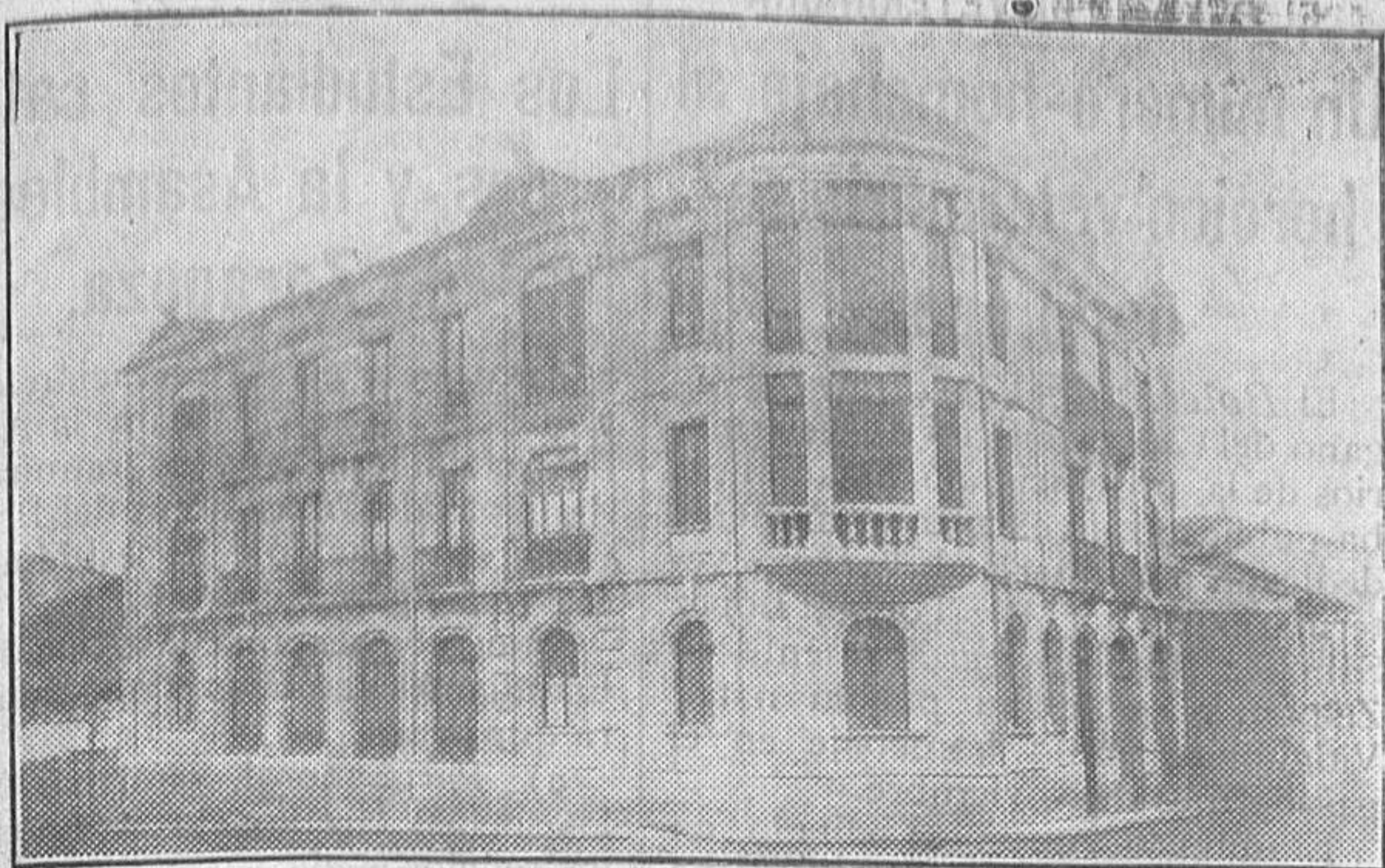
Nueva casa en la entrada de la Gran Vía (Azafranal).