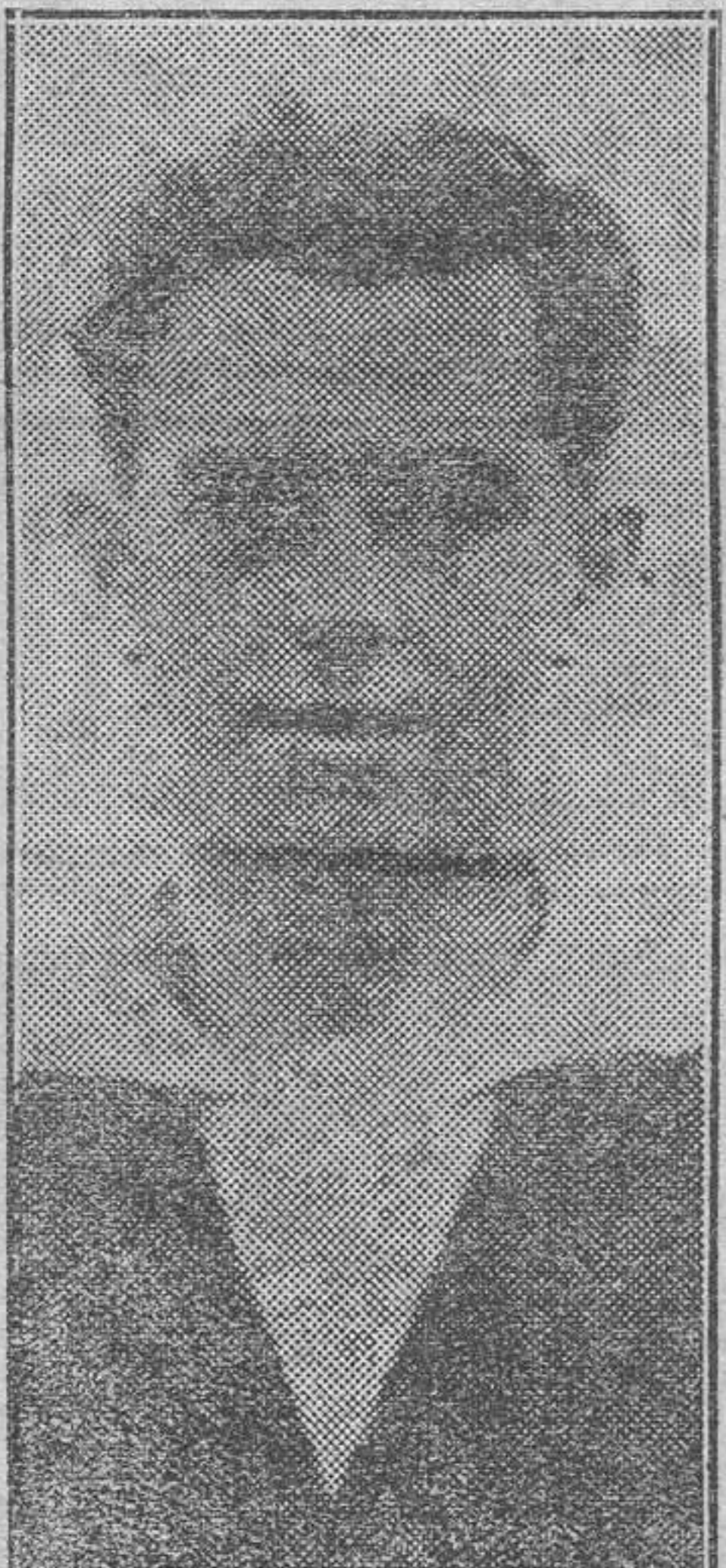
El árbitro quipuzcoano Murguía, que el domingo en Burdeos dirigirá el partido Francia-Luxemburgo