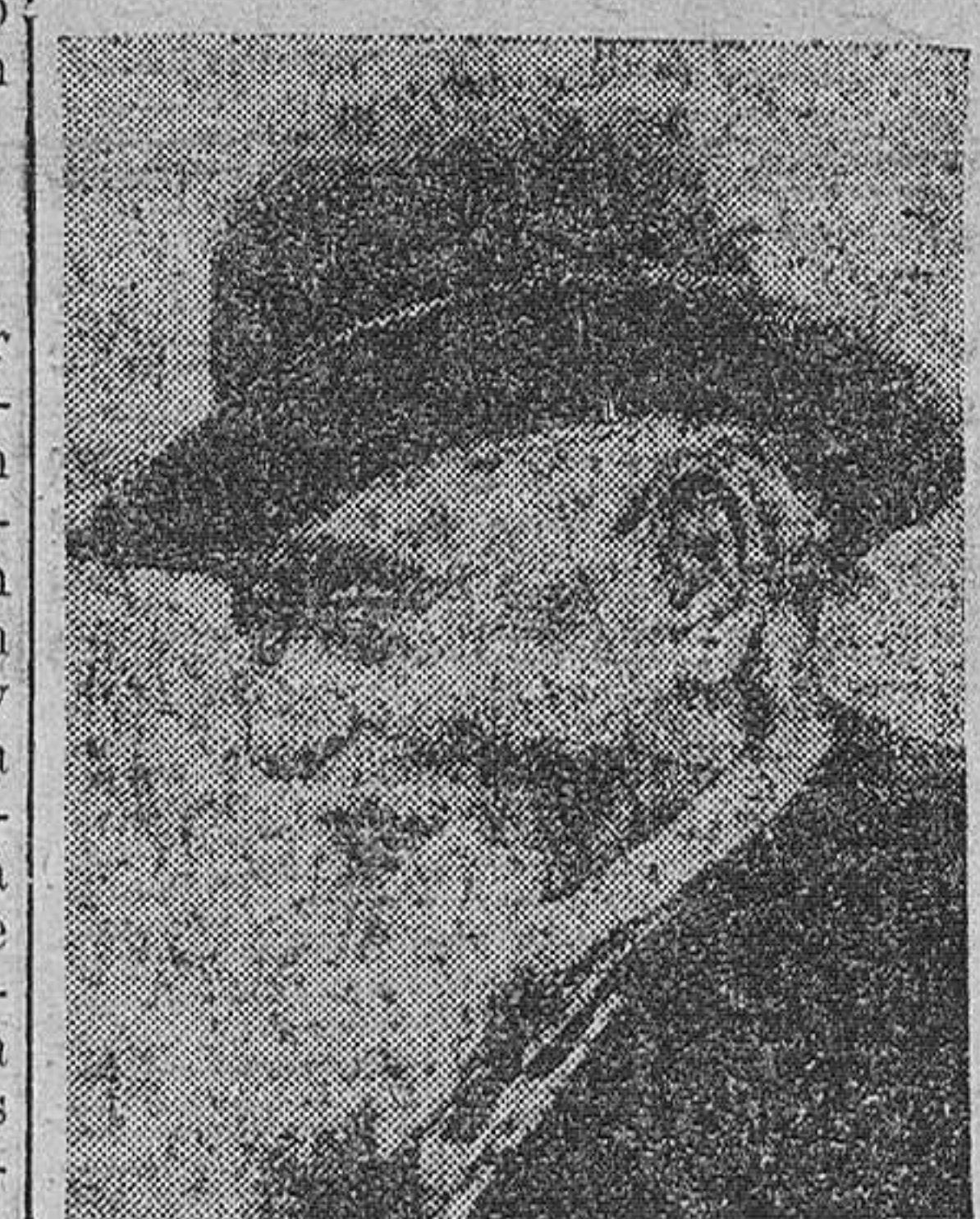
M. Fallières, ex Presidente de Francia.