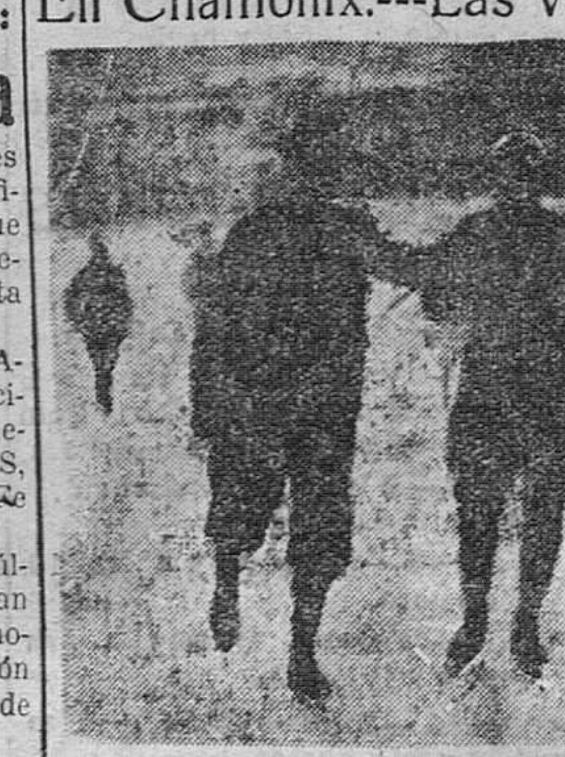
En primer término, a la izquierda, Sir Horn, Ministro del Aire de Inglaterra, entregado al deporte terrestre del patín.