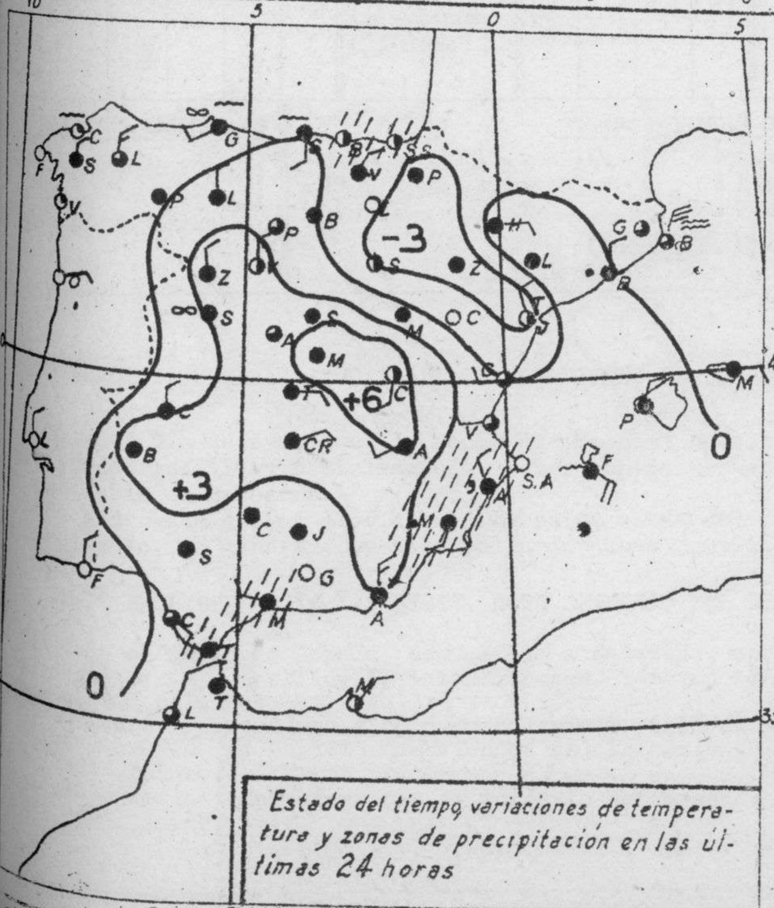
Estado del tiempo, variaciones de temperatura y zonas de precipitación en las últimas 24 horas