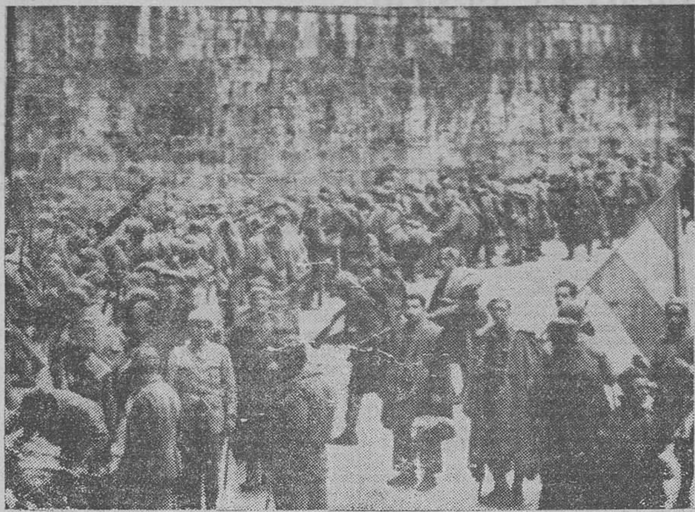
Un descanso de nuestras gloriosas tropas, para su aprovisionamiento, en el rápido avance hacia Gijón, cuya liberación ha producido el derrumbamiento del frente Norte.

En el sector oriental los soldados de España rompen la línea del Sella por el alto Sella, y en una marcha maravillosa desalojan al enemigo del Fito, cayendo sobre los atrinchamientos marxistas del Sella por la espalda. Y prosiguen su marcha por la costa hacia Villaviciosa y más al Sur rebasando Cangas de Onís, hacia Infesto. Al Sur de esta localidad parece que va a cerrarse la bolsa, en la carretera de Infesto a Campo de Caso. Se aprecian sobre el mapa las dos masas de avance, por la costa y hacia la cuenca minera. Pero en este