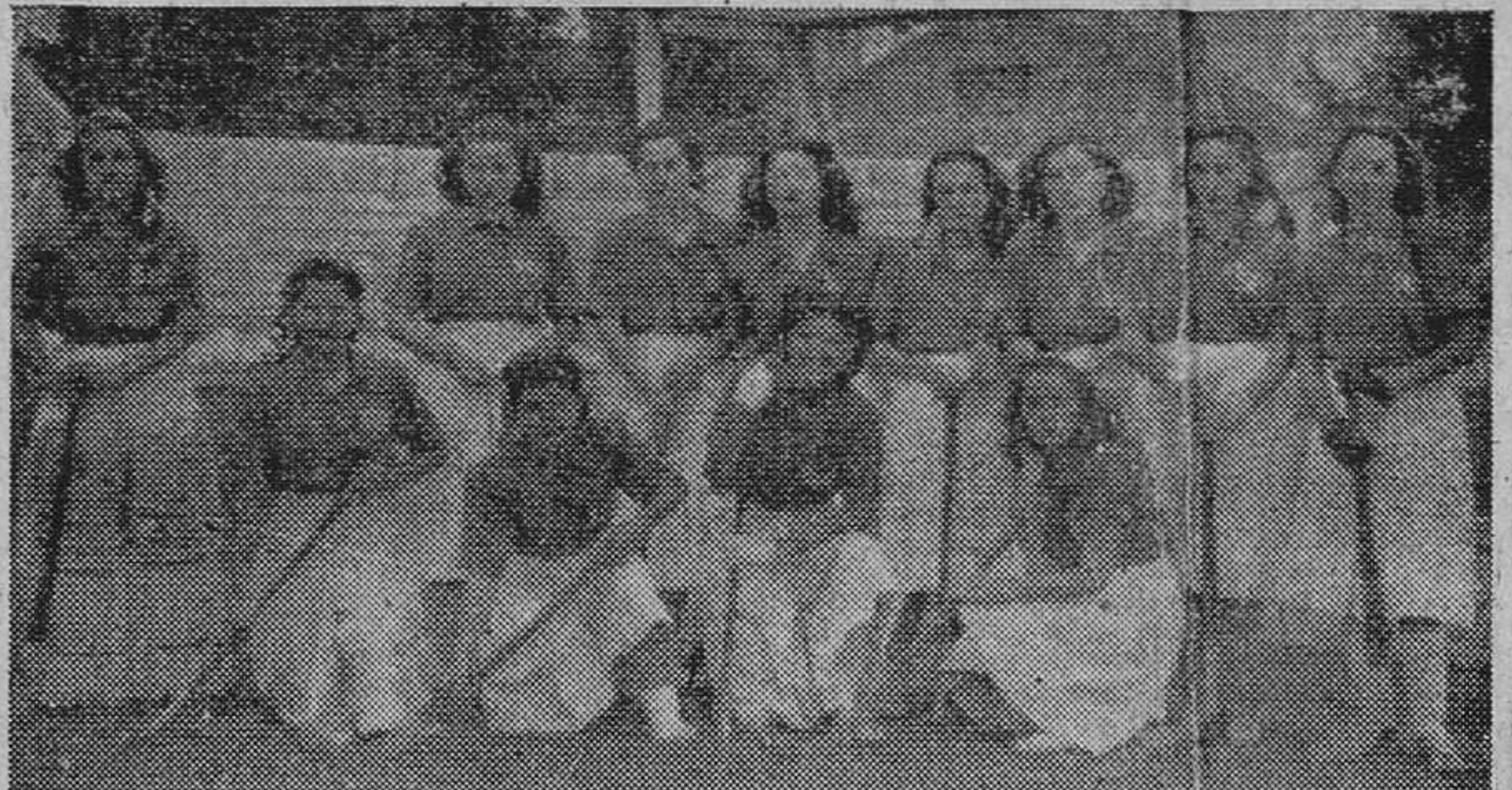
Equipo de la Sección Femenina del S. E. U. de nuestra Universidad, que ha sido proclamado vencedor en los campeonatos de «hockey» de los sectores de Zaragoza, Granada y Murcia, celebrados en la última capital