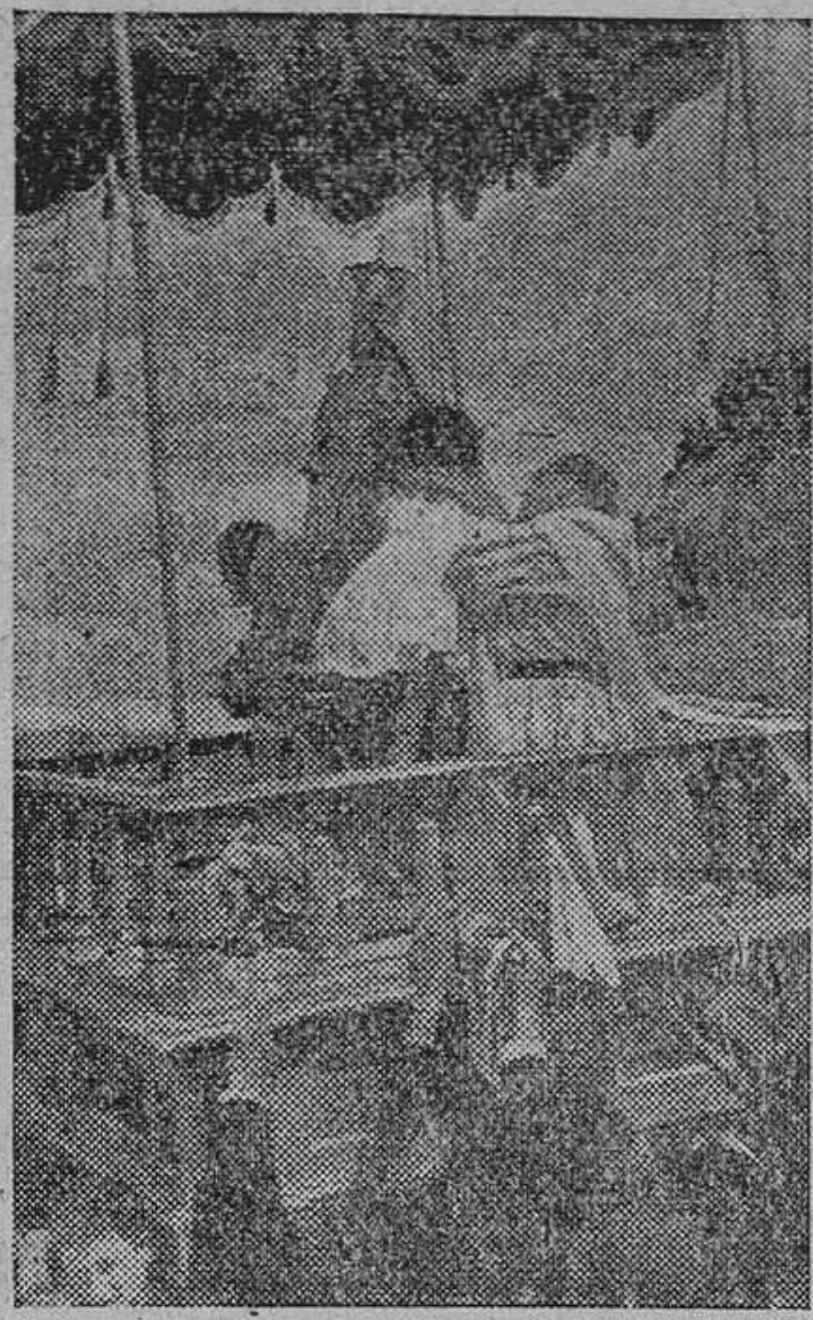
Un momento de la procesión de la Virgen de la Cabeza, por los alrededores de su Santuario