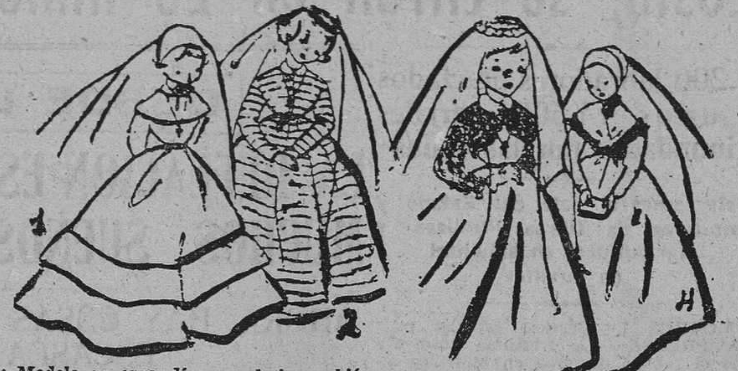
1: Modelo en organdi con pelerina y biés en la falda. Botones forrados en la espalda. Pequeña cofia completamente lisa. 2: Vestido lleno de loras. 3: En piqué completamente liso, con torera bordada en Richelieu o realce. 4: En organdi con manteleta cruzada y atada atrás con gran lazo. Lleva en el borde dos volantes de organdi planchados con tenacillas. Cofia muy sencilla.

Es obligado publicar unos modelos para primeras comuniones y hablar de ellos en nuestra sección ahora que casi todos los comercios de nuestra ciudad muestran en sus escaparates algún detalle alusivo al gran día, zapatos, rosarios, bolsos, coronas, velos, medallas, libros, estampas y lo más importante, vestidos.