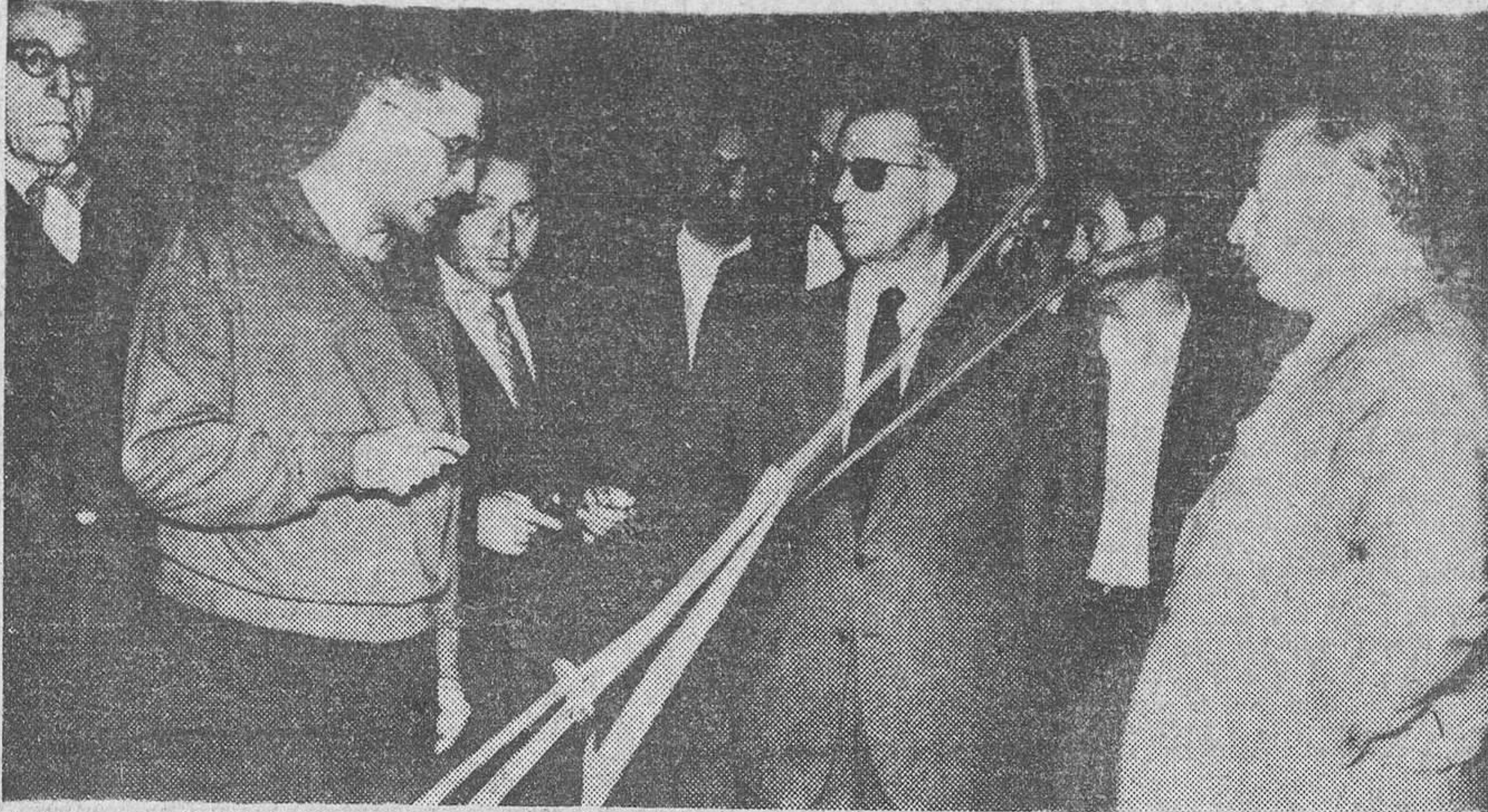
SANTANDER.—El ministro de Agricultura, señor Cánovas, visita las instalaciones de la Granja-Escuela de Heros, centro cultural y experimental agrícola-ganadero, modelo en España.