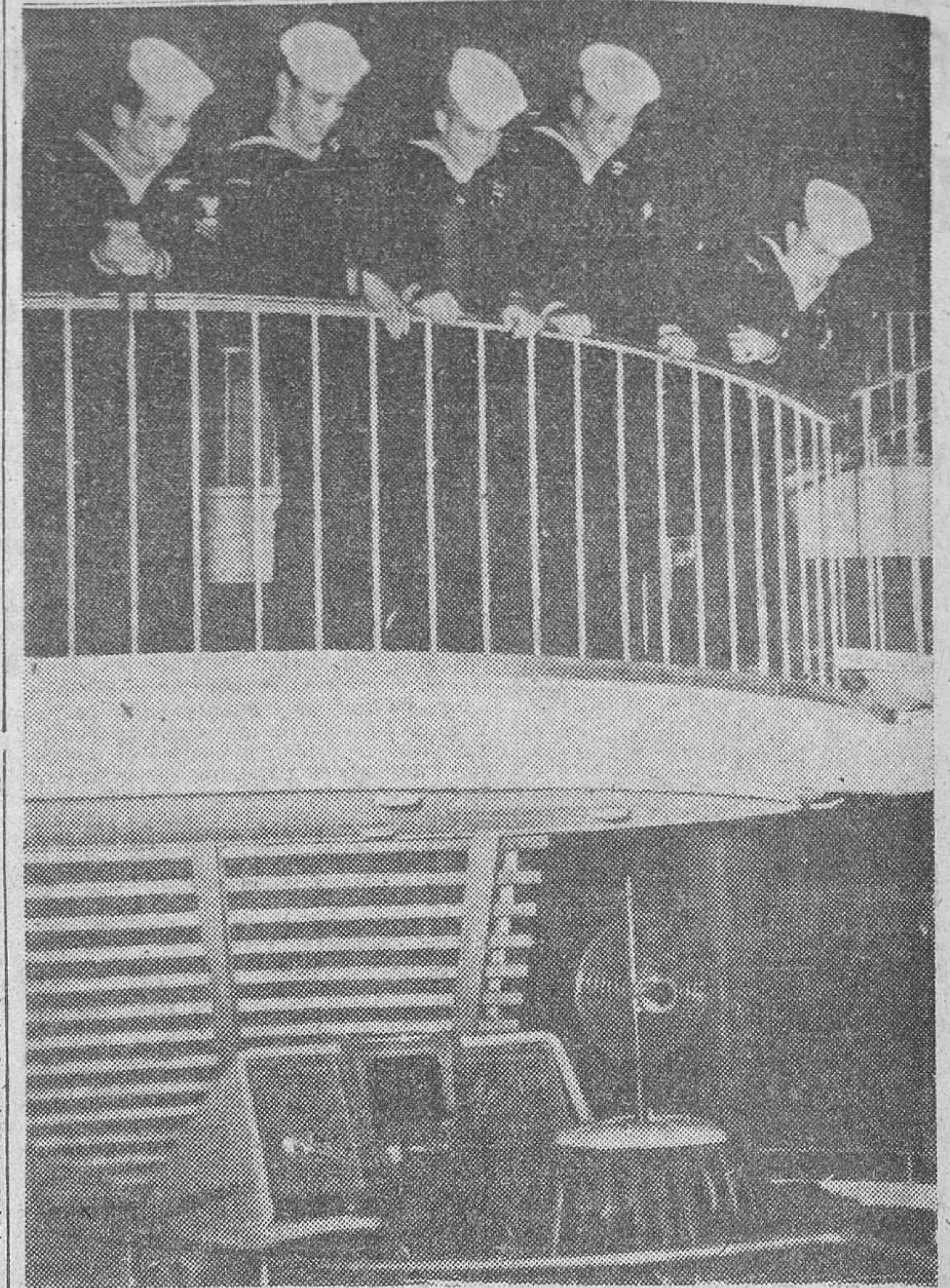
Aprovechando un corto permiso de cuarenta y ocho horas, cinco marineros del «Nautilus», el ya legendario submarino atómico americano, han llegado a Bruselas para visitar la exposición. En la «foto» aparecen durante su visita al pabellón americano, contemplando una canoa pesquera en forma de «platillo volante»