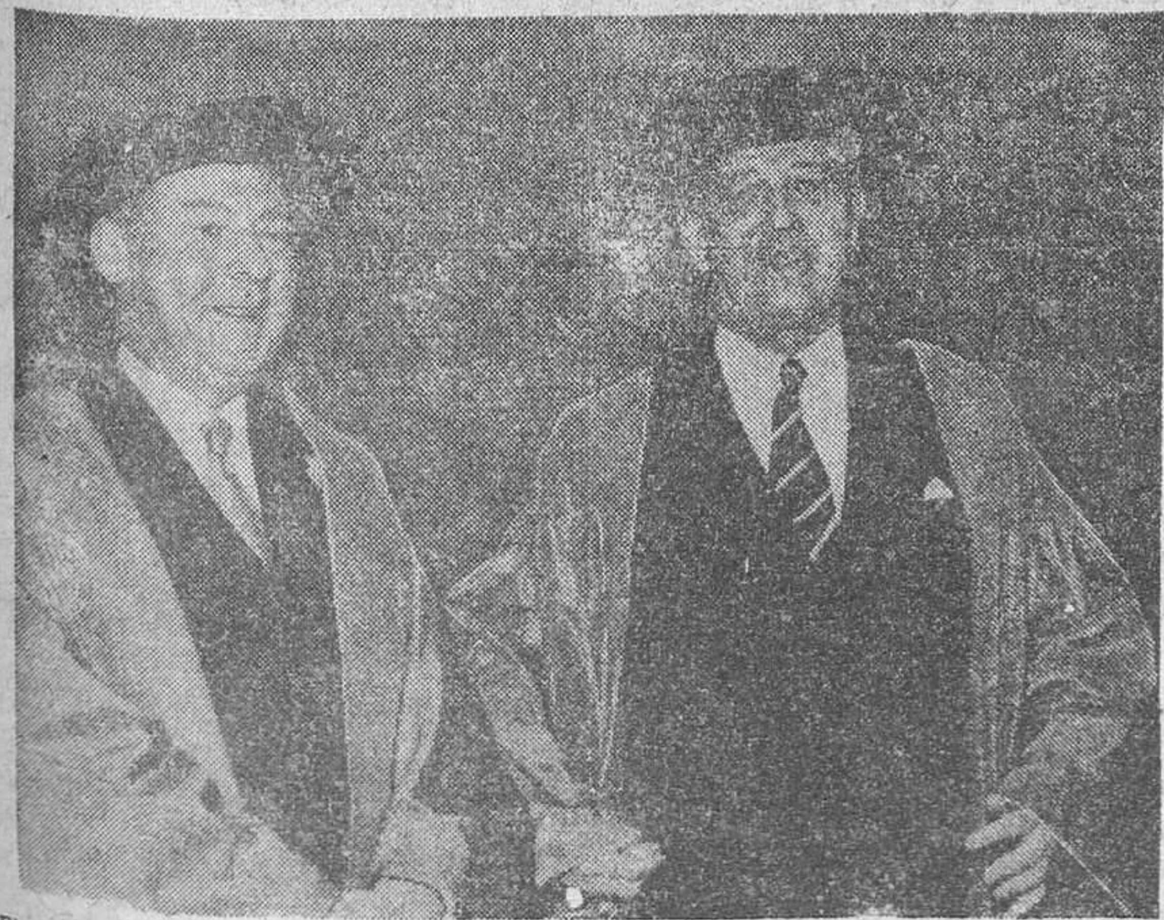
El primer ministro inglés, Harold Macmillan, y el jefe de la oposición el laborista Hugh Gaitskell, han recibido a la par honores universitarios al ser nombrados doctores "honoris causa" en De echo Civil, de la Universidad de Oxford. Ha sido una tregua en la lucha política