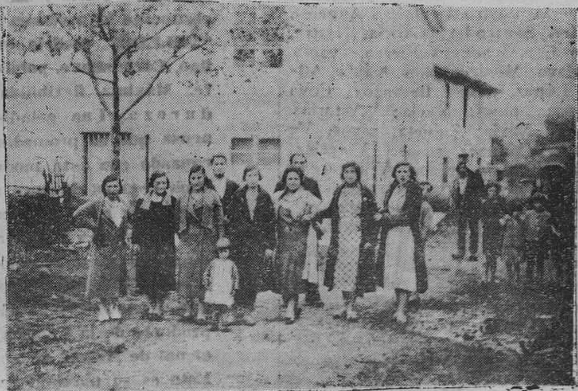
CABRANES.—Un grupo de simpáticas y bellas cabranenses posan para REGION frente a las Consistoriales.