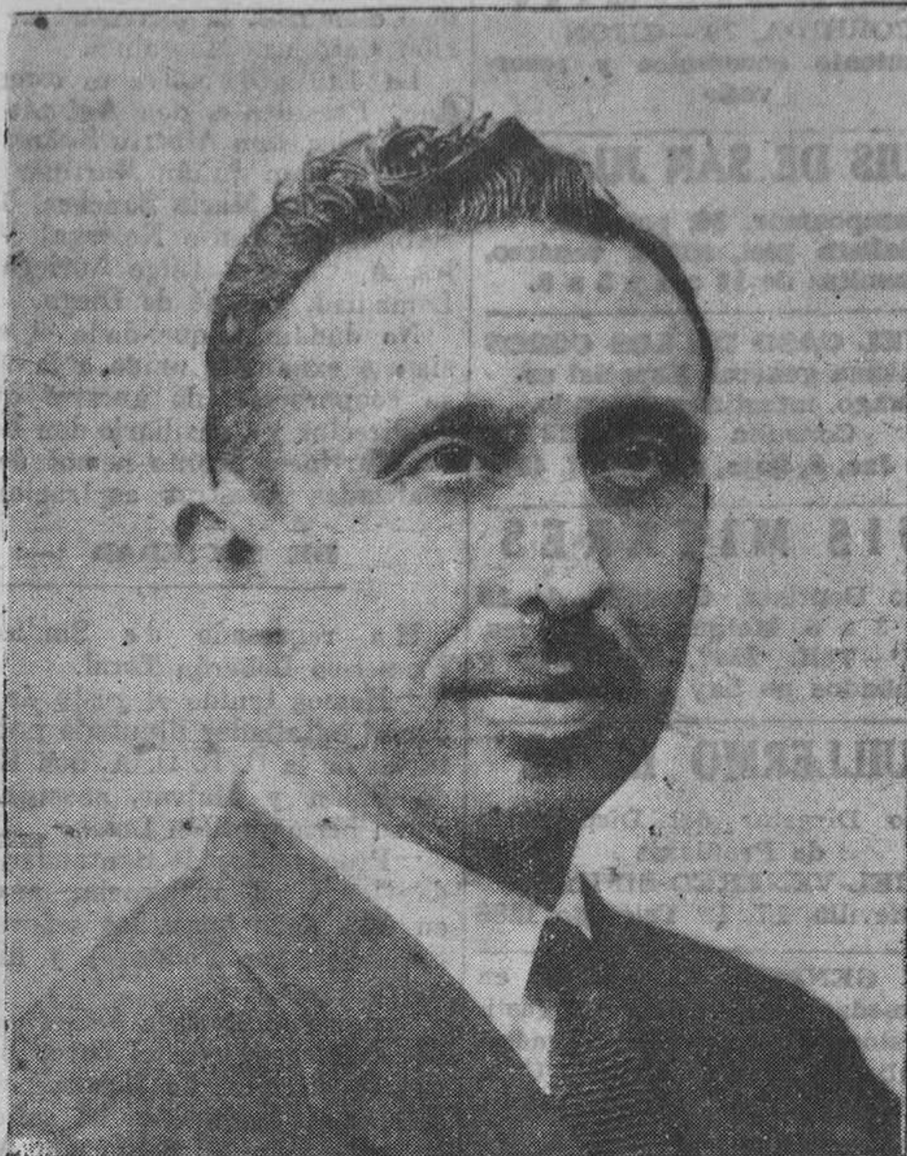
El doctor Pérez Mateo subsecretario de Sanidad y Beneficencia, a quien los sanitarios de toda España han tributado un homenaje con motivo de cumplirse el aniversario de la Previsión Médica Nacional, de cuya obra fué fundador

Otro año más que transcurre la fiesta de la Ascensión sin toros en Oviedo. El circo de Buenavista, destruido en parte por un incendio, puede darlo la afición por desaparecido en absoluto de las estadísticas taurinas.