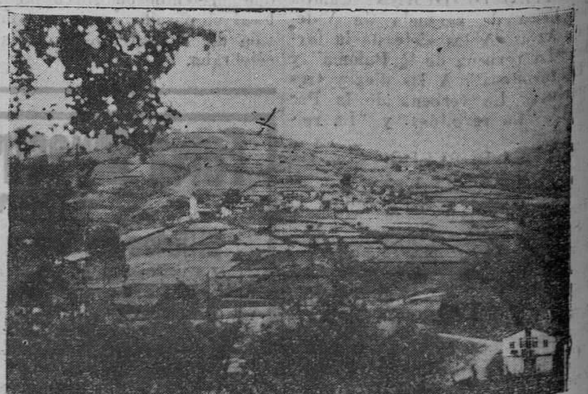
CABRANES.—Una vista panorámica de Santa Eulalia.