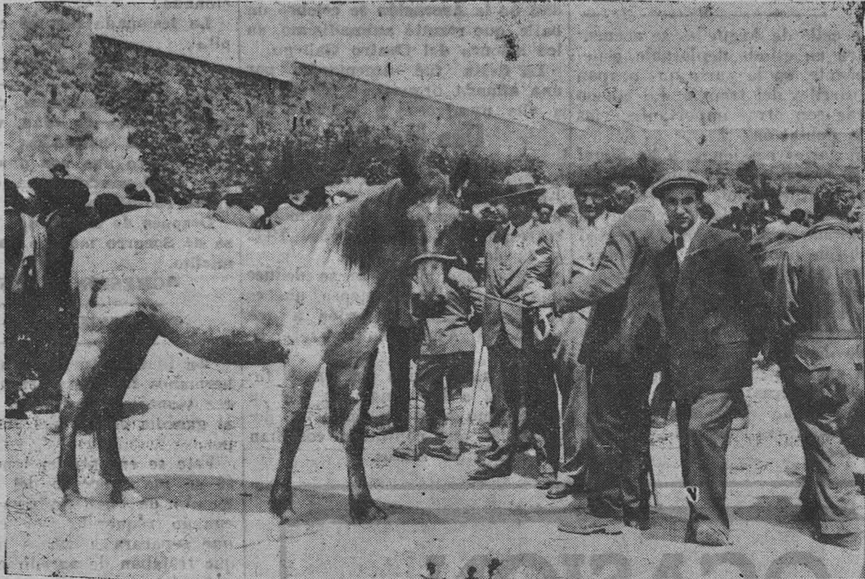
La feria de la Ascensión.— En pleno trato para vender un bonito ejemplar de caballo de los muchos que acudieron al real de la feria.

Para resumir esto de la feria, allá van unos datos estadísticos: el número total de cabezas de ganado que hubo ayer en el feria!