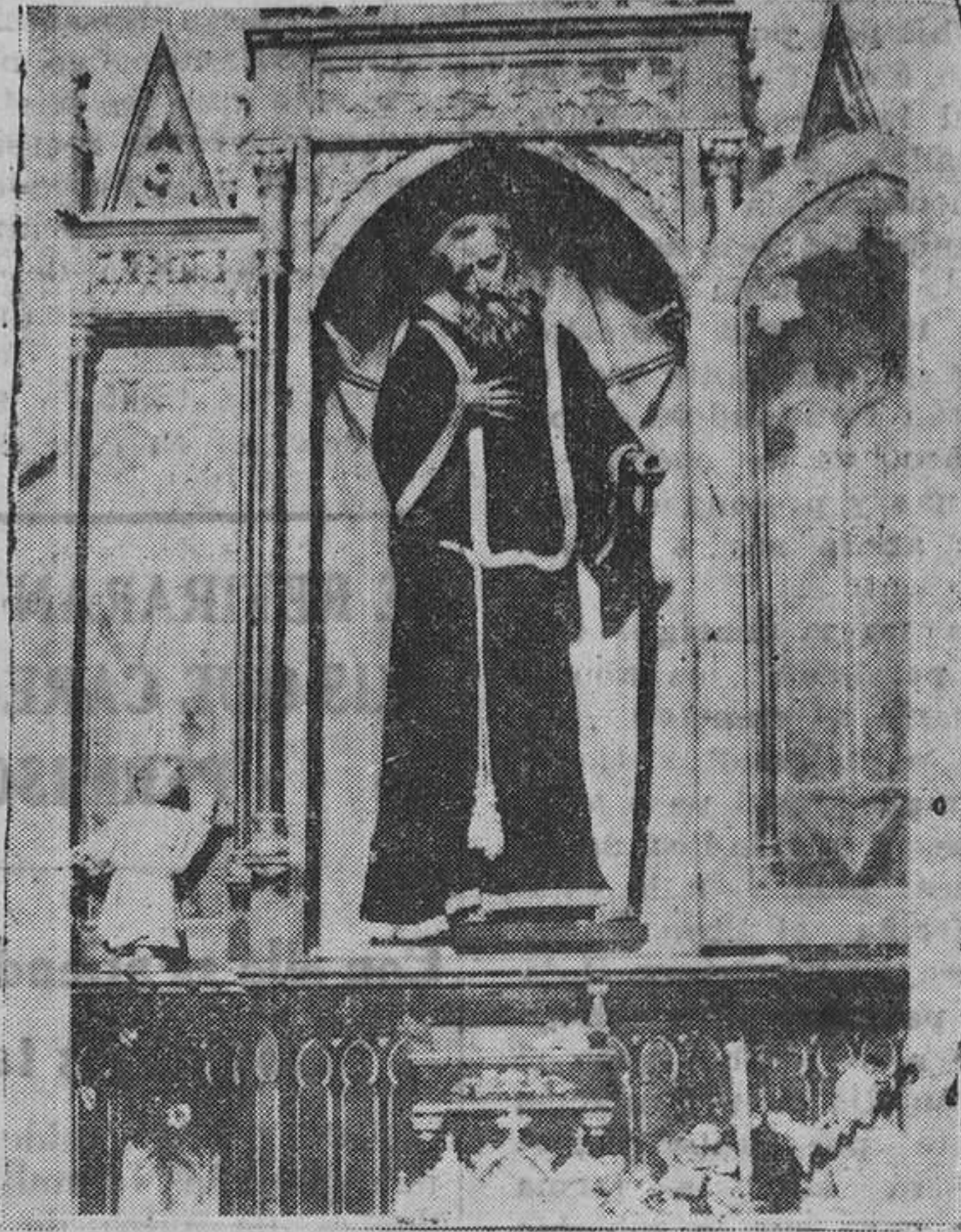
CABRANES.—La venerada imagen de San Francisco de Paula, que se venera en la iglesia de Santa Eulalia.

parroquia de Santa Eulalia don Fernando Lavarejos con una leyenda que dice, como el retratado regalo a la Iglesia un altar con su imatigua cofradía de San Francisco en el día de su fiesta. Cualquiera que haya sido la fecha en que la Cofradía haya sido