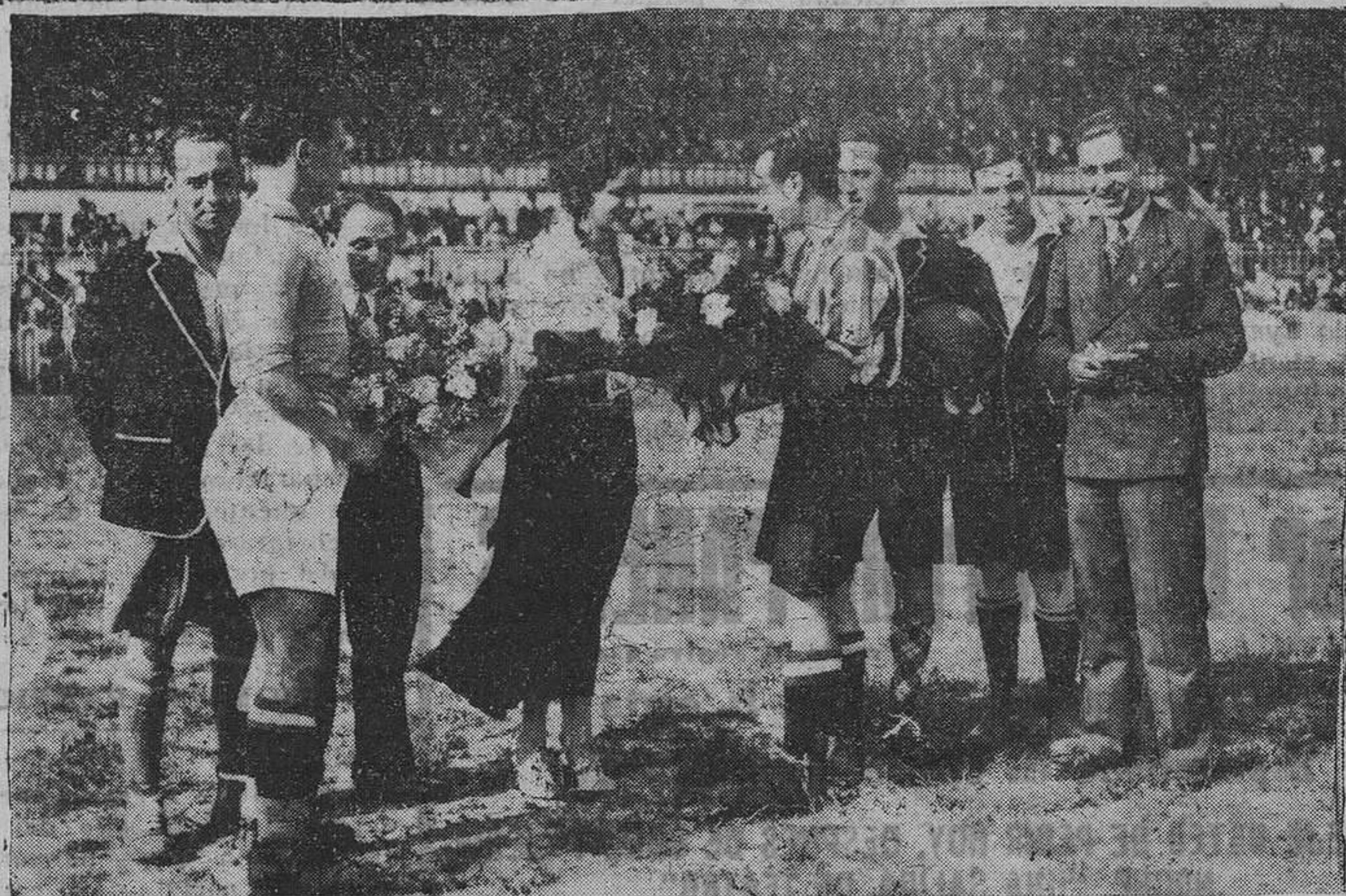
La bellísima "Miss Asturias" recibe sendos ramos de flores de manos de los capitanes del Athletic de Bilbao y el Oviedo, "Chirri" y "Calichi".