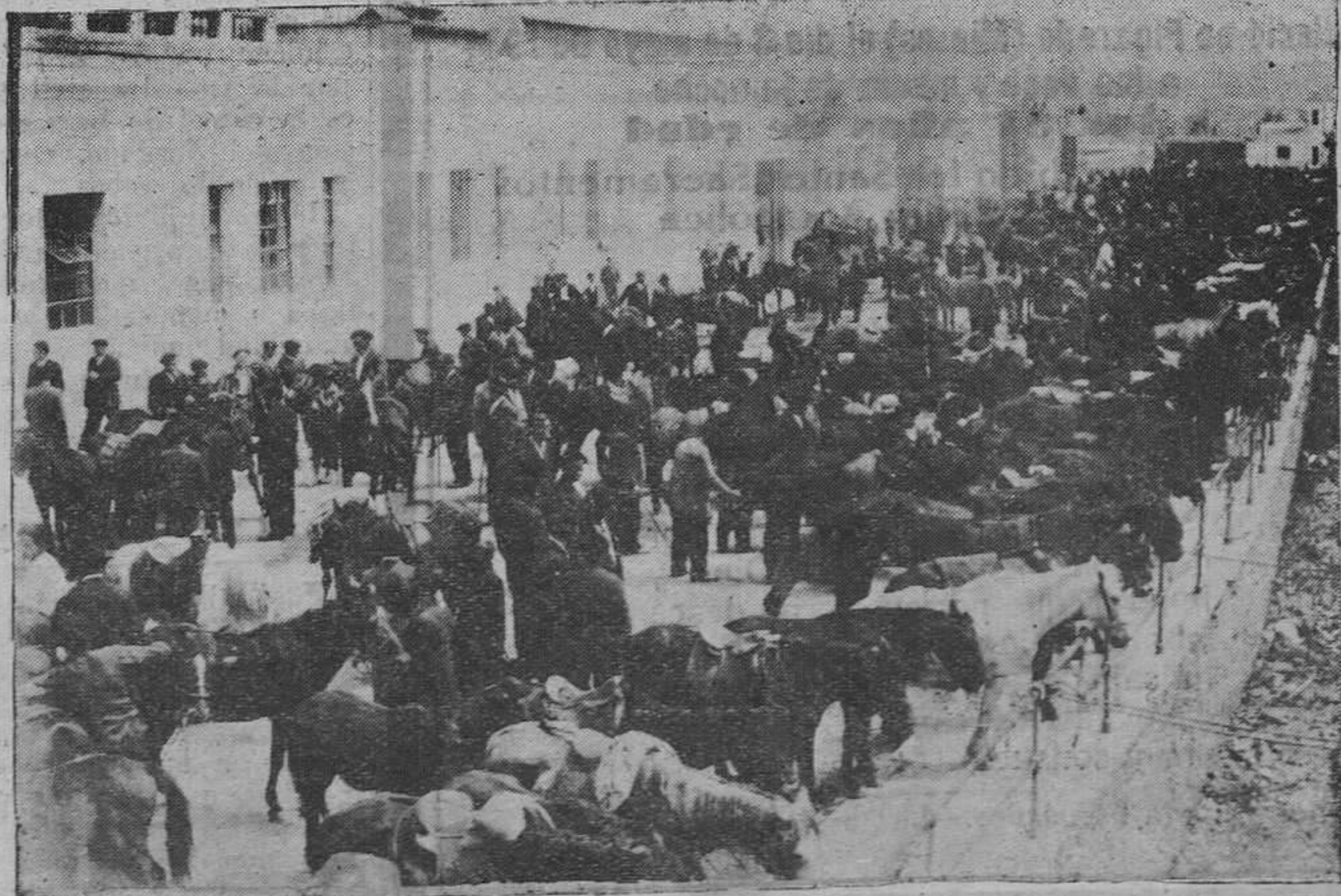
La feria de la Ascensión.— Una vista parcial del ferial.

Como decimos, a medida que se acercaba el mediodía, los feriantes, una vez realizadas sus operaciones, iban invadiendo la ciudad. Al mismo tiempo llegaban también los grandes contingentes que venían a presenciar el partido. La coincidencia de unos y otros, hizo que a las horas del aperitivo y de la comida se colmaran todos los establecimientos