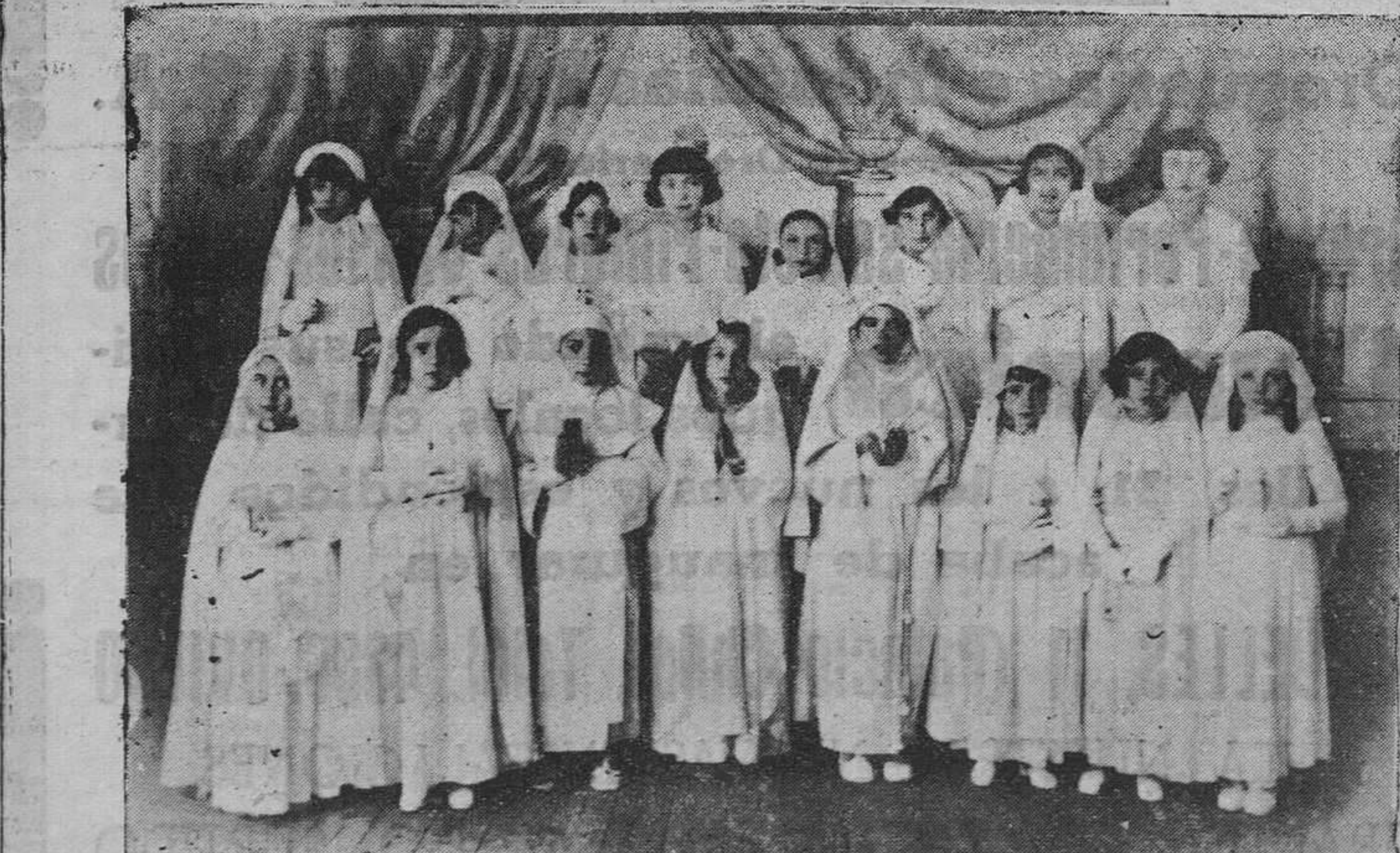
OVIEDO.— Grupo de niñas del Colegio de la Medalla Milagrosa que ayer se acercaron a la sagrada Mesa.