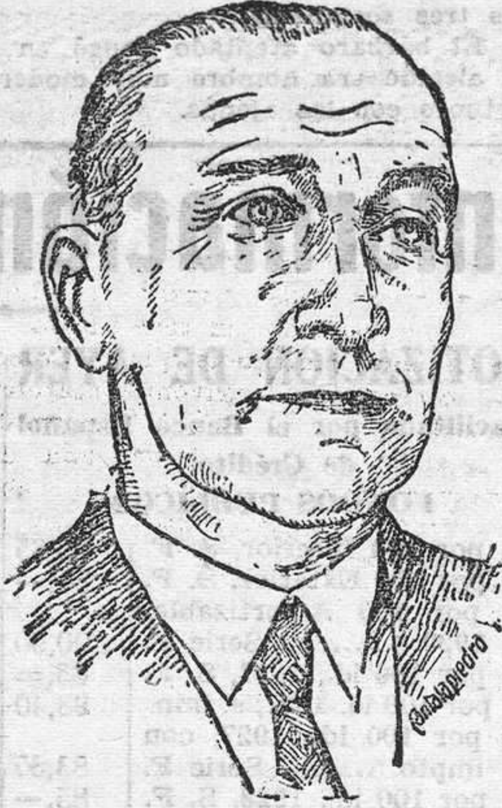
Gobierno estaba dispuesto a dar una explicación adecuada si en el salón de sesiones era preguntado.

Como se le dijera que no dejaba de extrañar la cordialidad con que acogía el acuerdo de los radicales, el ministro contestó que él se limitaba a exponer hechos y colocarlos sobre el tapete, para que la opinión decidiese, aunque el