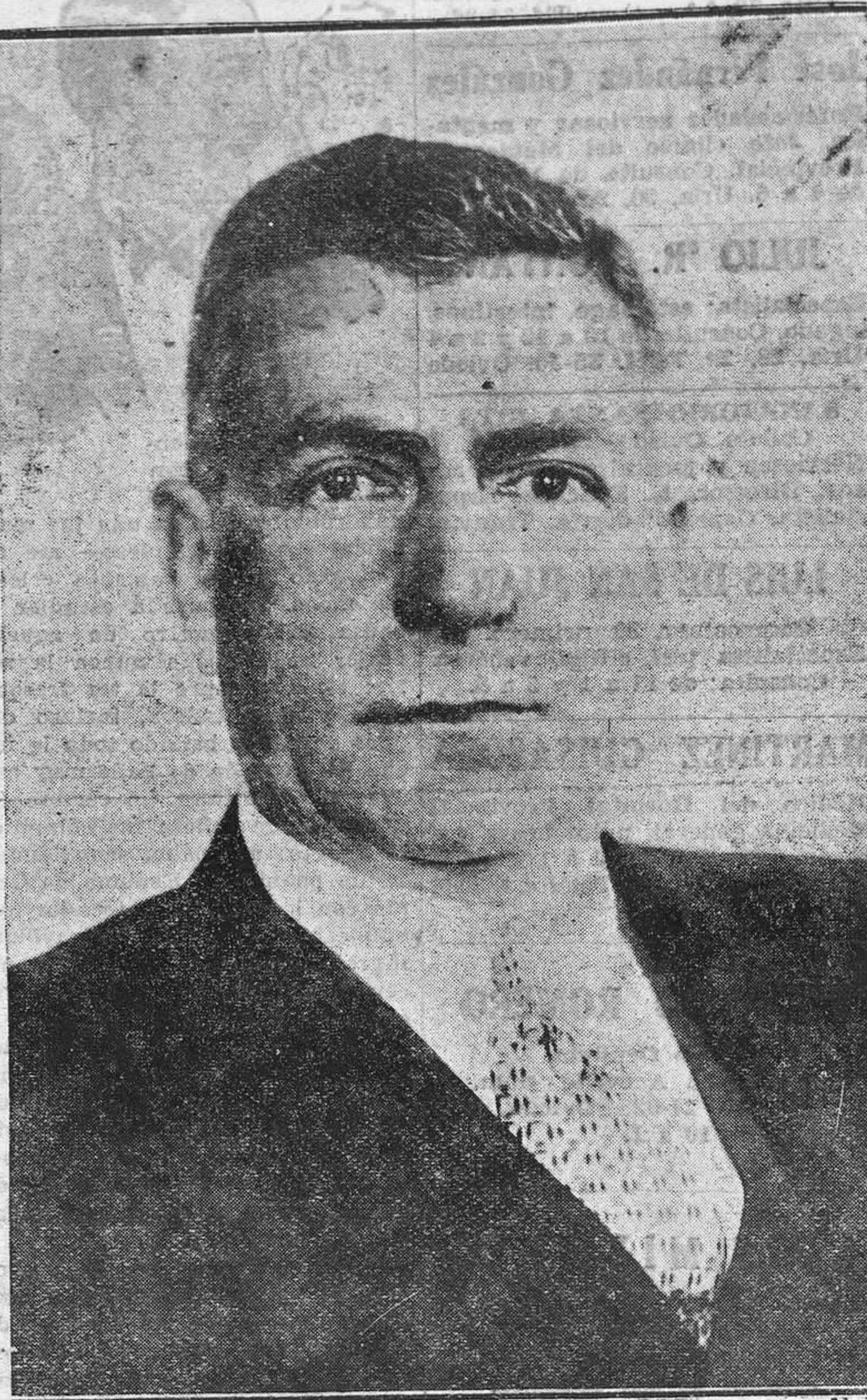
Mr. Charles Mitchell, ex presidente de del "National City Bank", de Nueva York, que ha sido detenido o acusado de un delito de fraude