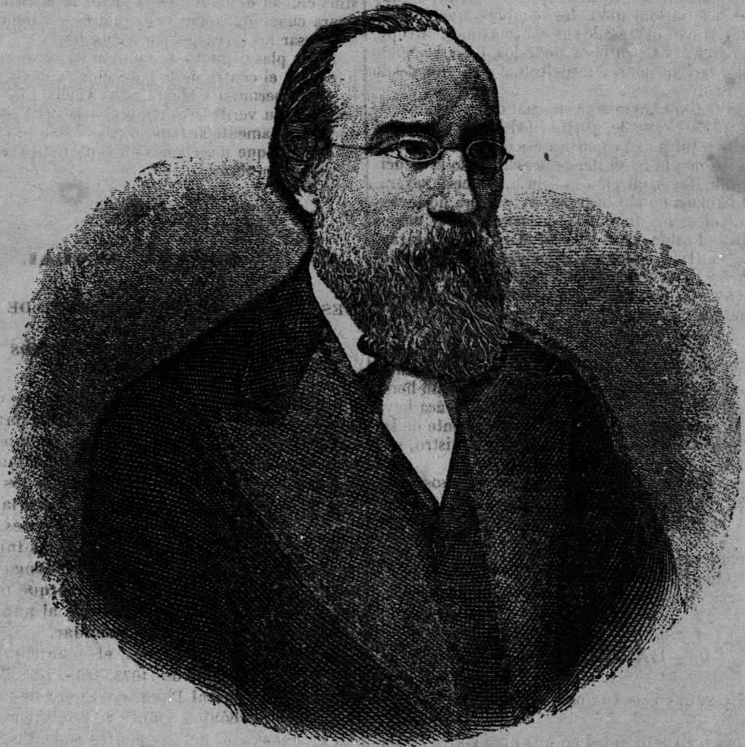
D. Francisco Pi y Margall

SEGUNDO PRESIDENTE DE LA REPÚBLICA ESPAÑOLA