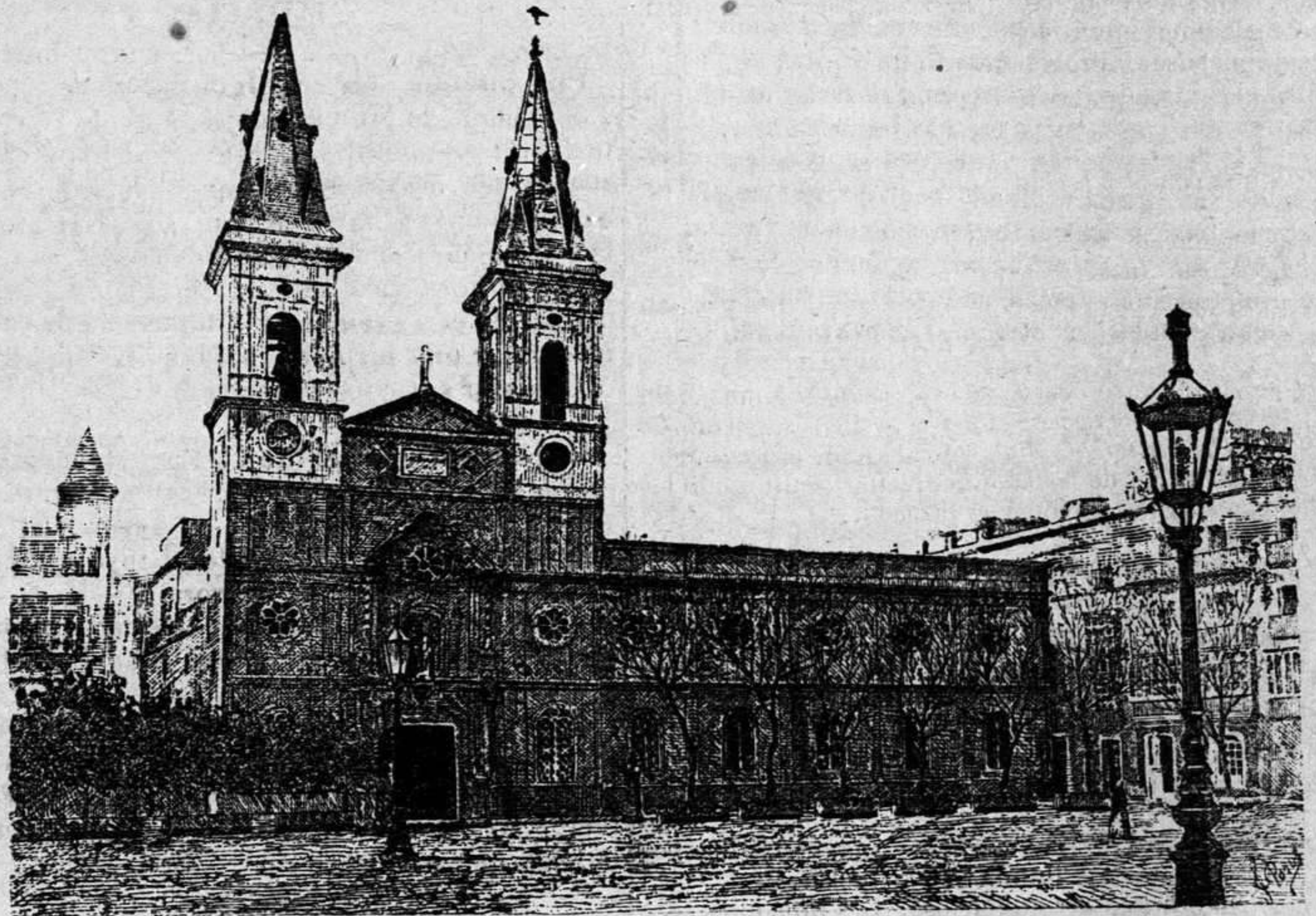
CADIZ.—Plaza de San Antonio

Después los pesos mejicanos y los españoles han tomado el lugar de aquellos, con una estimación próxima á cinco pesetas, que duró hasta hace poco, pues naturalmente habia de perder la estimación proporcional la