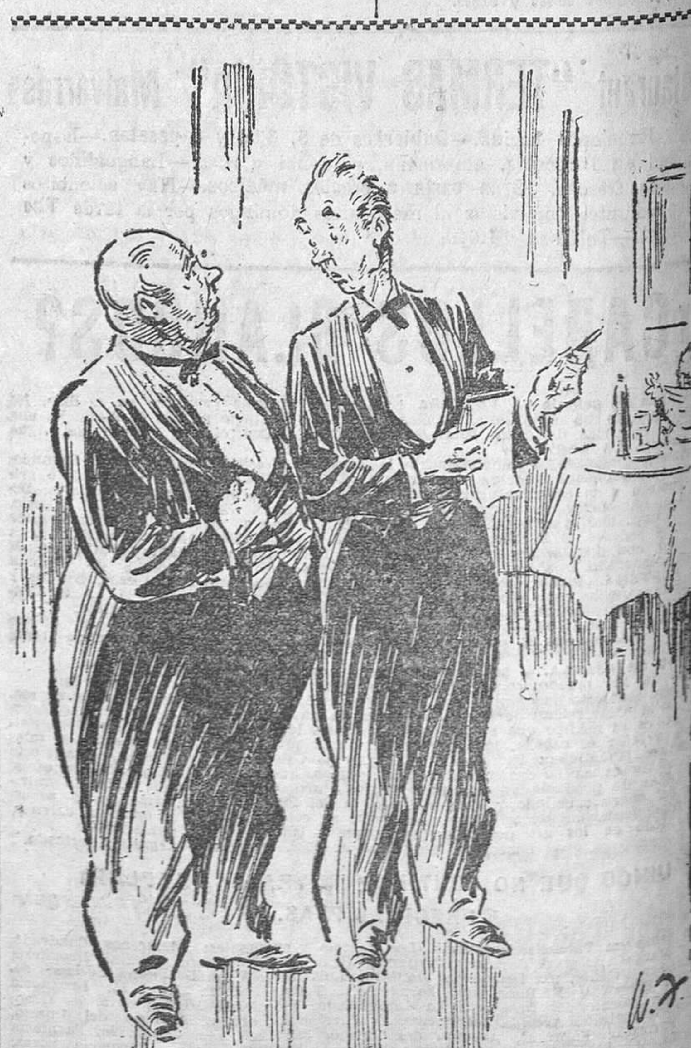
«El nuevo camarero...»