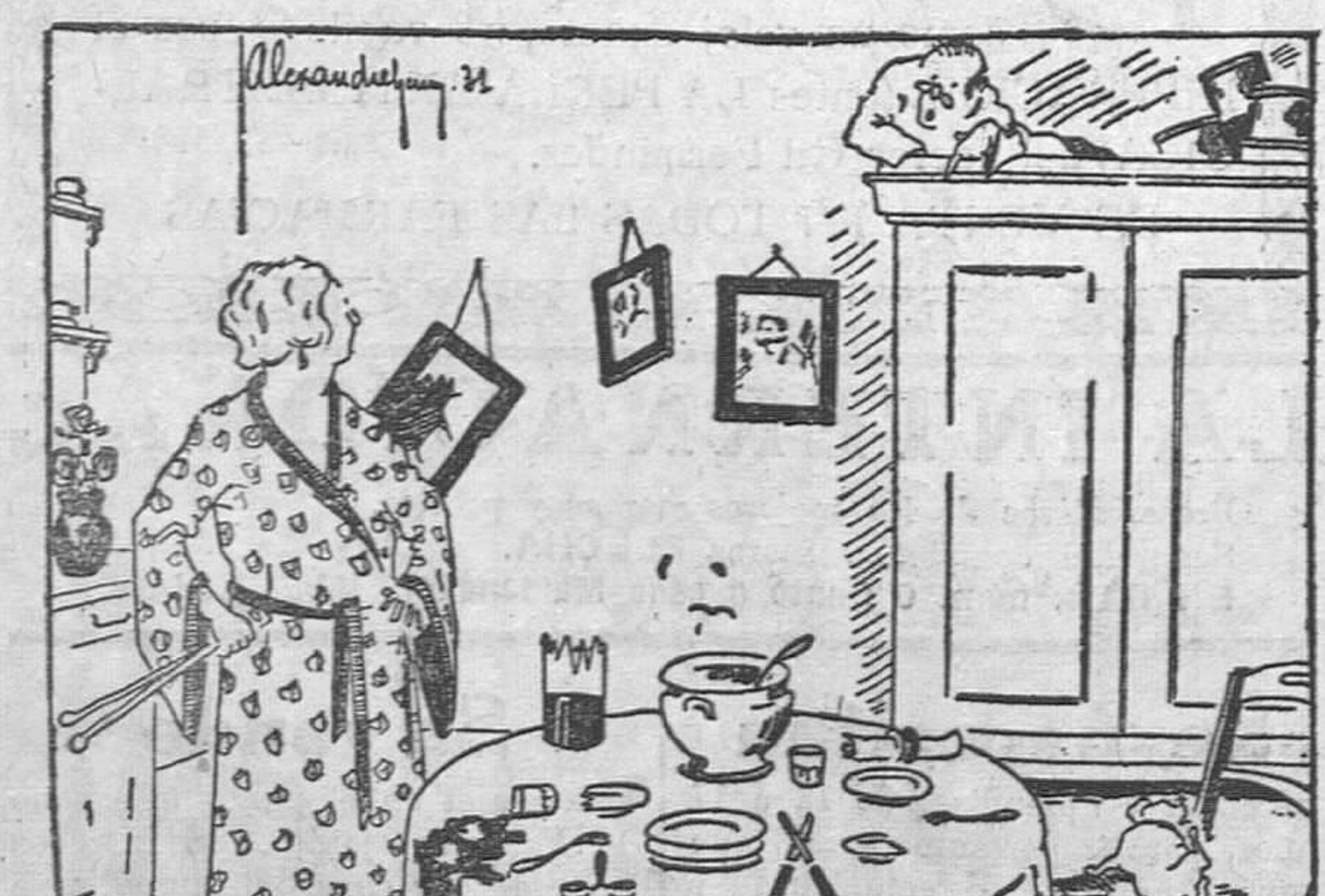
«¿Vas a bajar de ahí, si o no? No, no y no! ¡Quiero demostrarte que hago lo que me da la gana!»

«Un sabio? Pues acaba de meter el periódico en el serviliteo y se está leyendo la servilleta.»