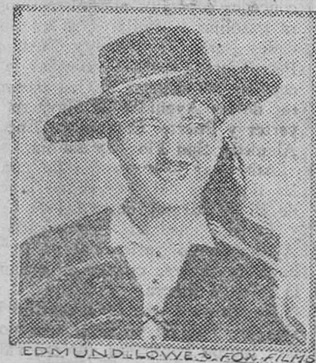
Cuyo rol en «El precio de la gloria» es una de sus más grandes creaciones

Se puede decir de «El séptimo cielo» que ha traído al firmamento de las estrellas dos que estarán mucho tiempo entre ellas y subiendo