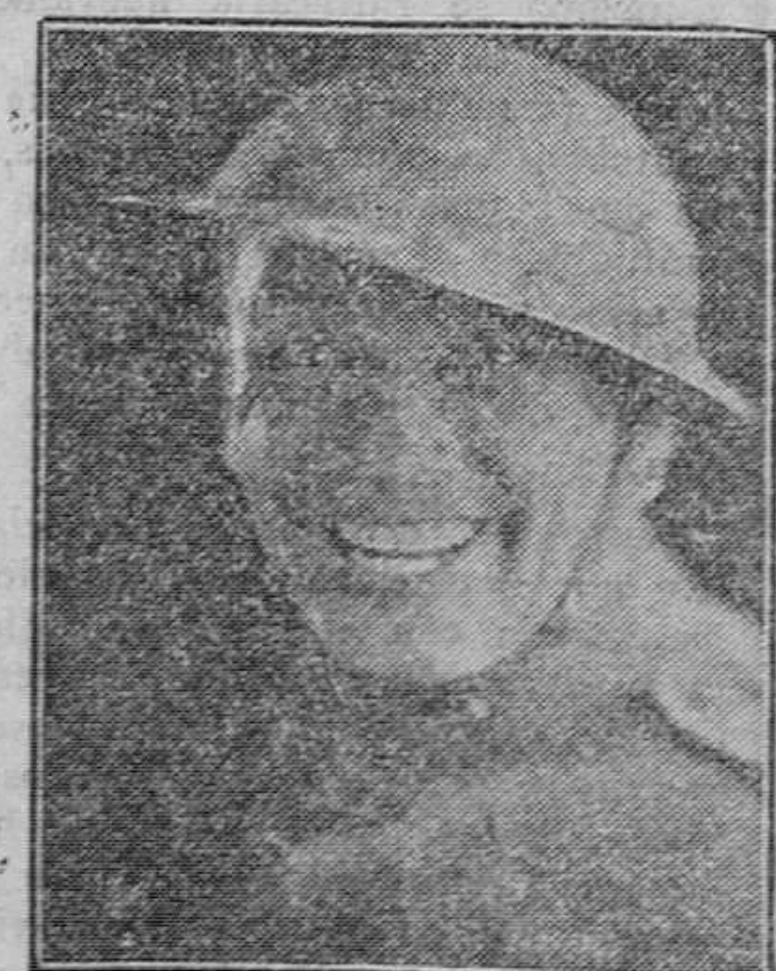
VICTOR MC LAGLEN principal intérprete de la famosa producción «El precio de la gloria»

a pesar de que sabemos perfectamente el inmenso valor de tantas y tantas películas que se han hecho antes de ésta. A pesar de esto, decimos a todo el que quiera escucharnos, sin tubos de ninguna clase, que esta es una cinta completamente excepcional por sus méritos.