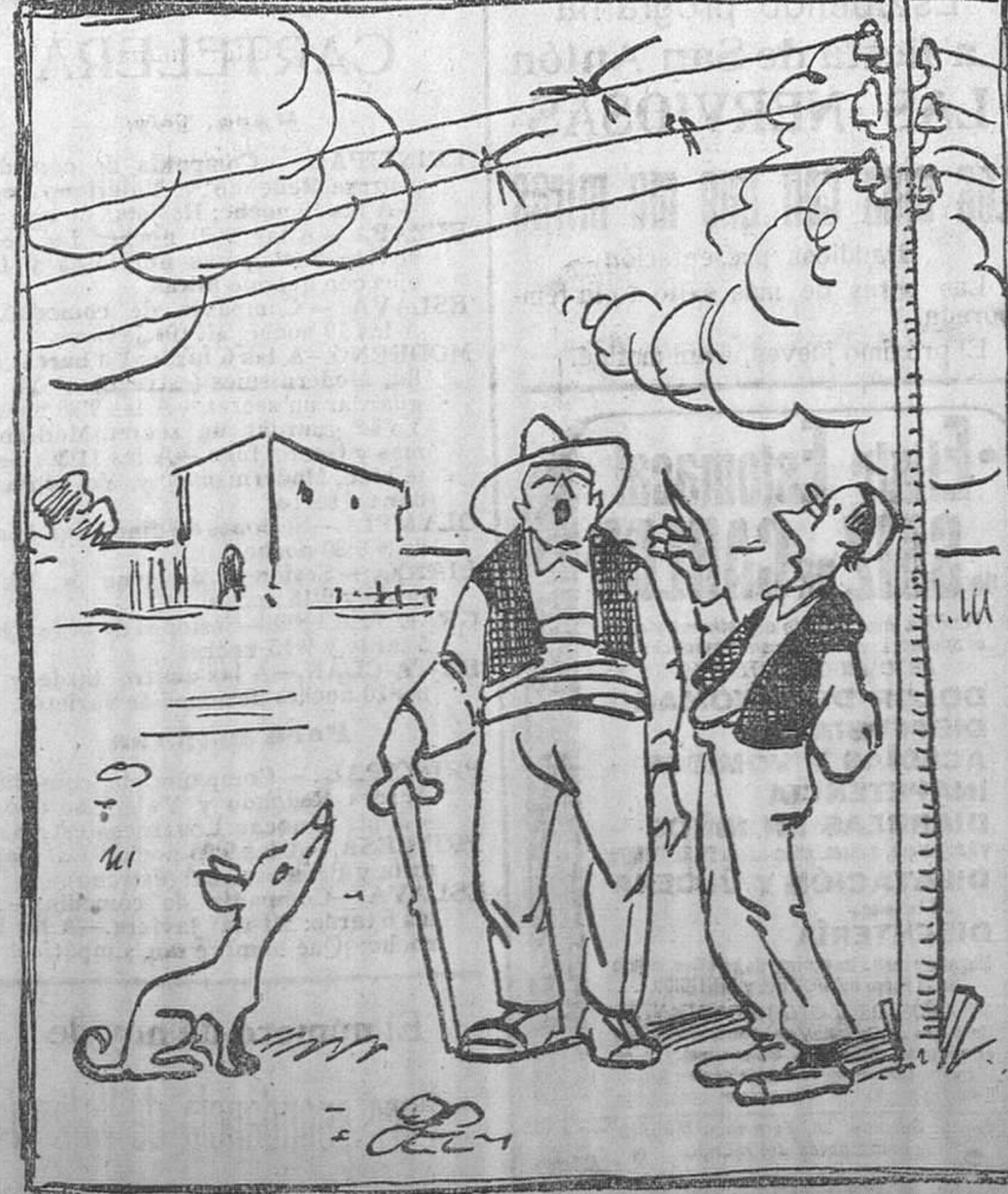
—La verdad es que tenemos la vida pendiente de un hilo.