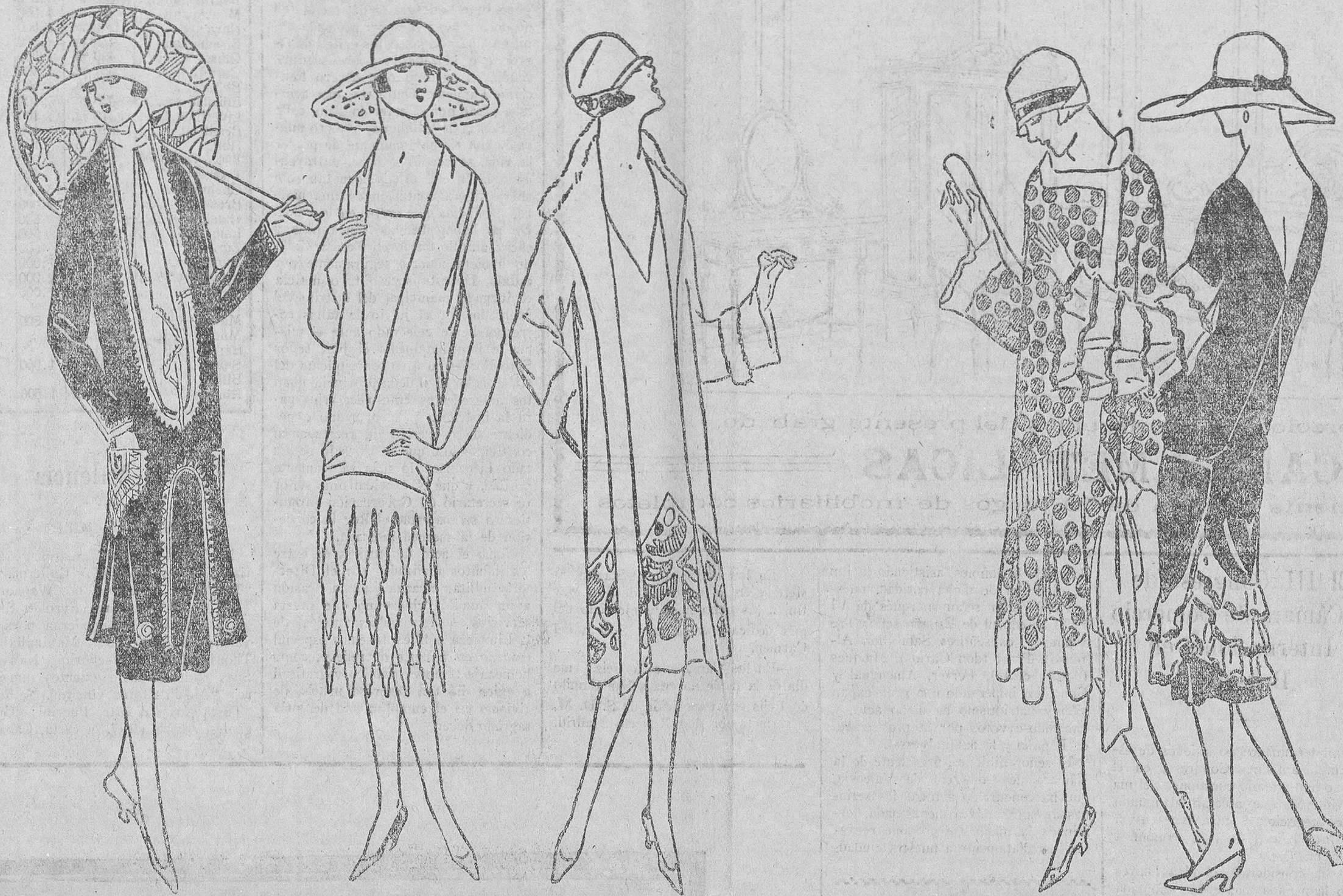
Lindo traje de satén negro, bordado en oro, con aplicaciones blancas.—Traje de crepe «Lisette». El cuerpo va adornado con hojas de fonos delicados.—Capa blanca incrustada de flores multicolores.—Toaleta de foulard amarillo, que indica, por la línea del cuerpo, la nueva tendencia de la moda.—Traje de satén azul marino, rodeado de organdí blanco y bordado con seda del mismo color.

Encontramos en un periódico parisiense una semblanza de Ninón, la célebre bella francesa que ha impuesto a las mujeres modernas su peinado de cabellos cortos. Los cabellos "a la Ninón", que todas conocéis y casi todas lleváis. Nacida de una familia hidalga—dice su comentarista—de un padre débil y perezoso, y una madre devota, Ninón no dudó mucho tiempo entre el camino que le convenía seguir. El de la virtud le pareció demasiado difícil y erizado de espinas, y prefirió seguir los consejos que su belleza le daba, lanzándose decididamente por la vía que su destino le había marcado.