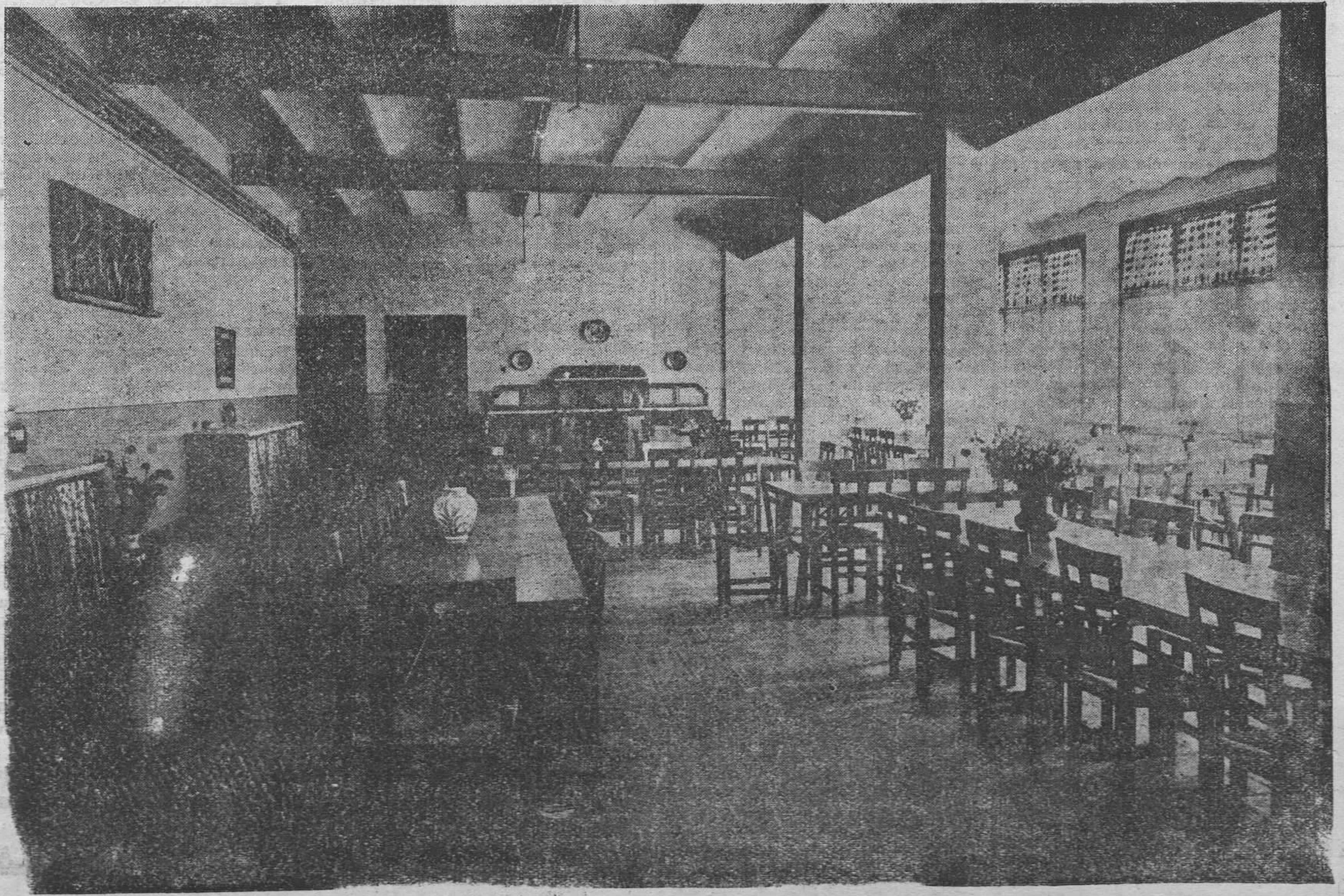
Colonia permanente de montaña en Berga. — Aspecto del comedor

Se organizó un concurso entre todos los Ayuntamientos catalanes para que ofrecieran los terrenos. Cuando entramos en el Ayuntamiento visitamos las poblaciones que habían ofrecido terrenos. Por su magnífico clima, por su situación y dimensiones, por las grandes ventajas que el Municipio de Berga ofrecía, fué aceptada su oferta.