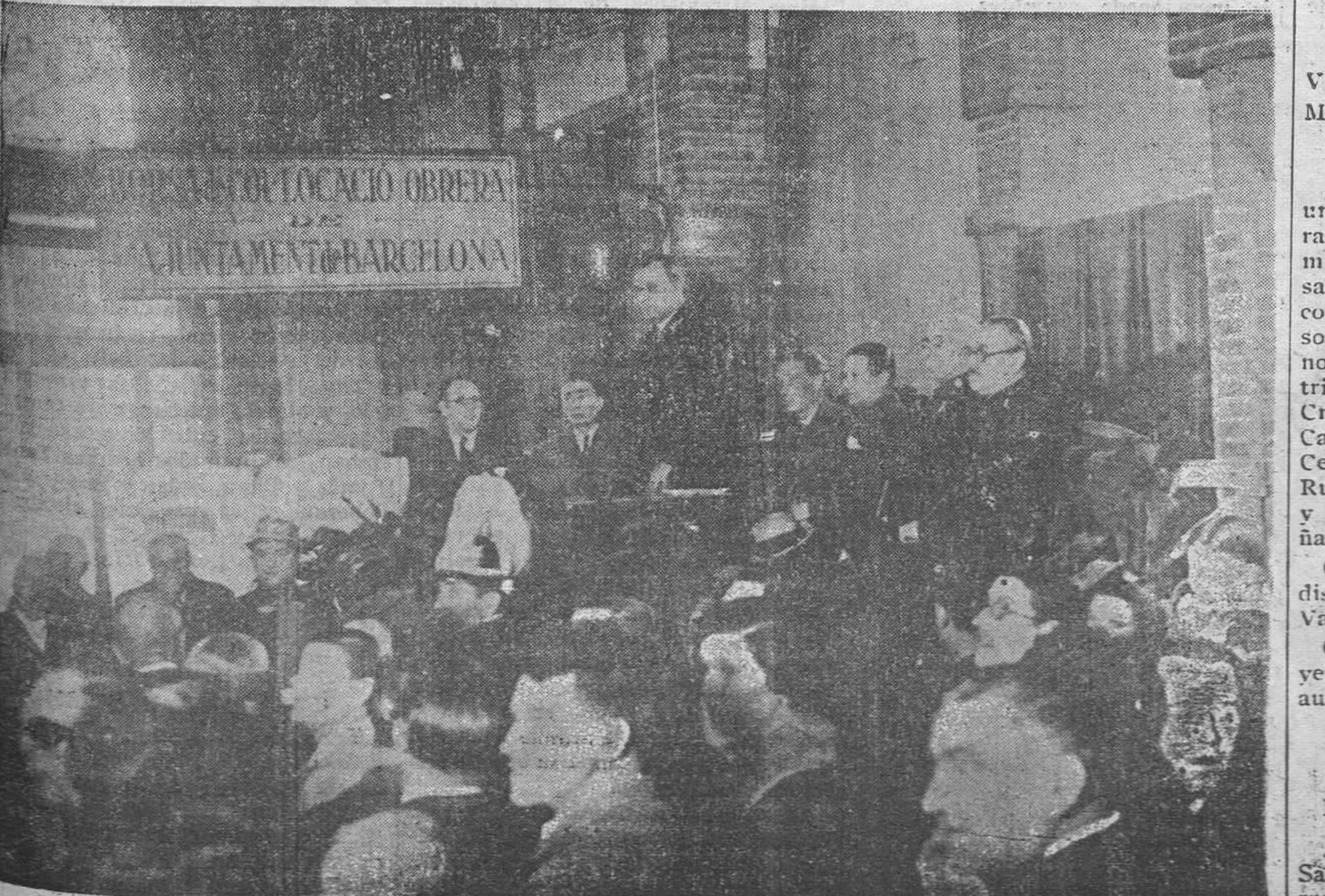
El consejero de trabajo de la Generalidad, don Martín Barrera, pronunciando un discurso en el acto inaugural de la Bolsa del Trabajo, creada por el Ayuntamiento de Barcelona.

El señor Companys visitó las dependencias de la institución, de las que prodigó elogios. La inauguración no revistió ningún carácter de solemnidad y no se pronunciaron discursos. Tanto a la entrada como a la salida del local, el Presidente de la Generalitat fué objeto de afectuosas manifestaciones de simpatía.