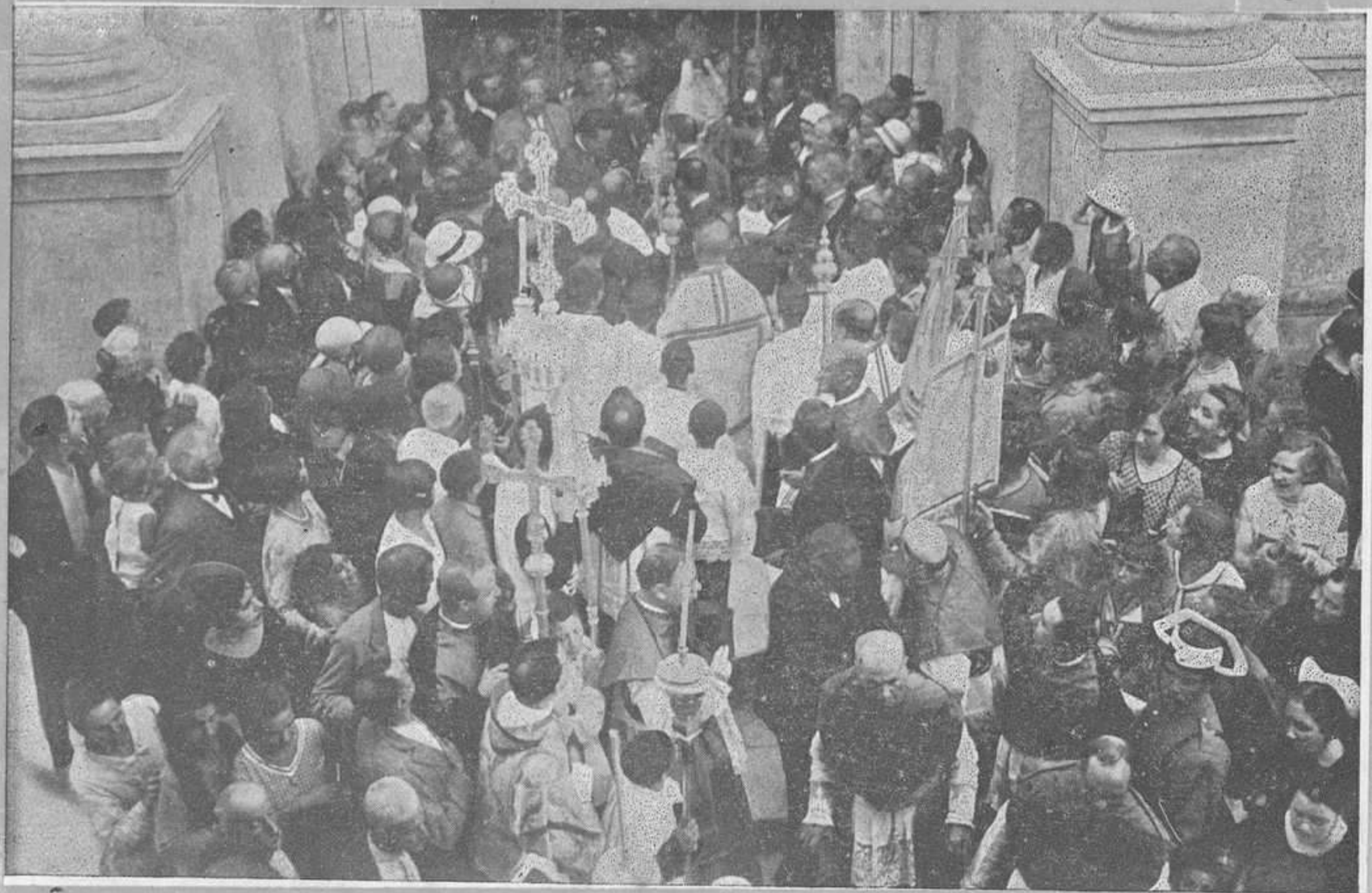
CIUDADELA.—El Infante D. Jaime acompañado del General Primo de Rivera al salir de la Catedral después del solemne «Te Deum».