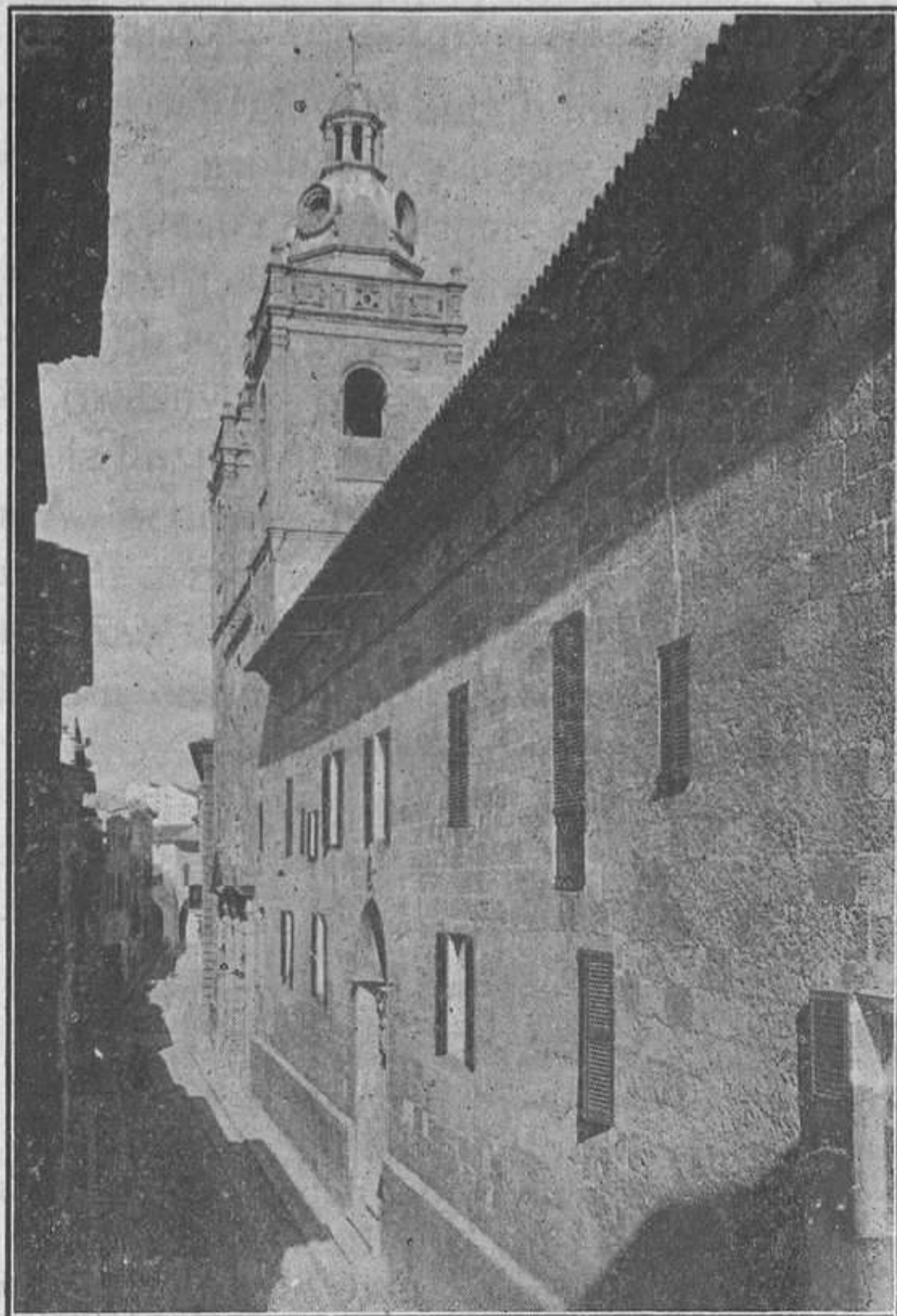
Seminario Conciliar de Menorca en donde tuvieron lugar los ejercicios espirituales para caballeros.

presentado al público la revista de la Unión, ha empezado a organizarse la hermosa cruzada eucarística, y después de todo esto, el espíritu de lucha por Cristo y por su Iglesia, palpitante y vigoroso en los corazones juveniles, busca inquieto más amplios horizontes donde triunfar de nuevo.