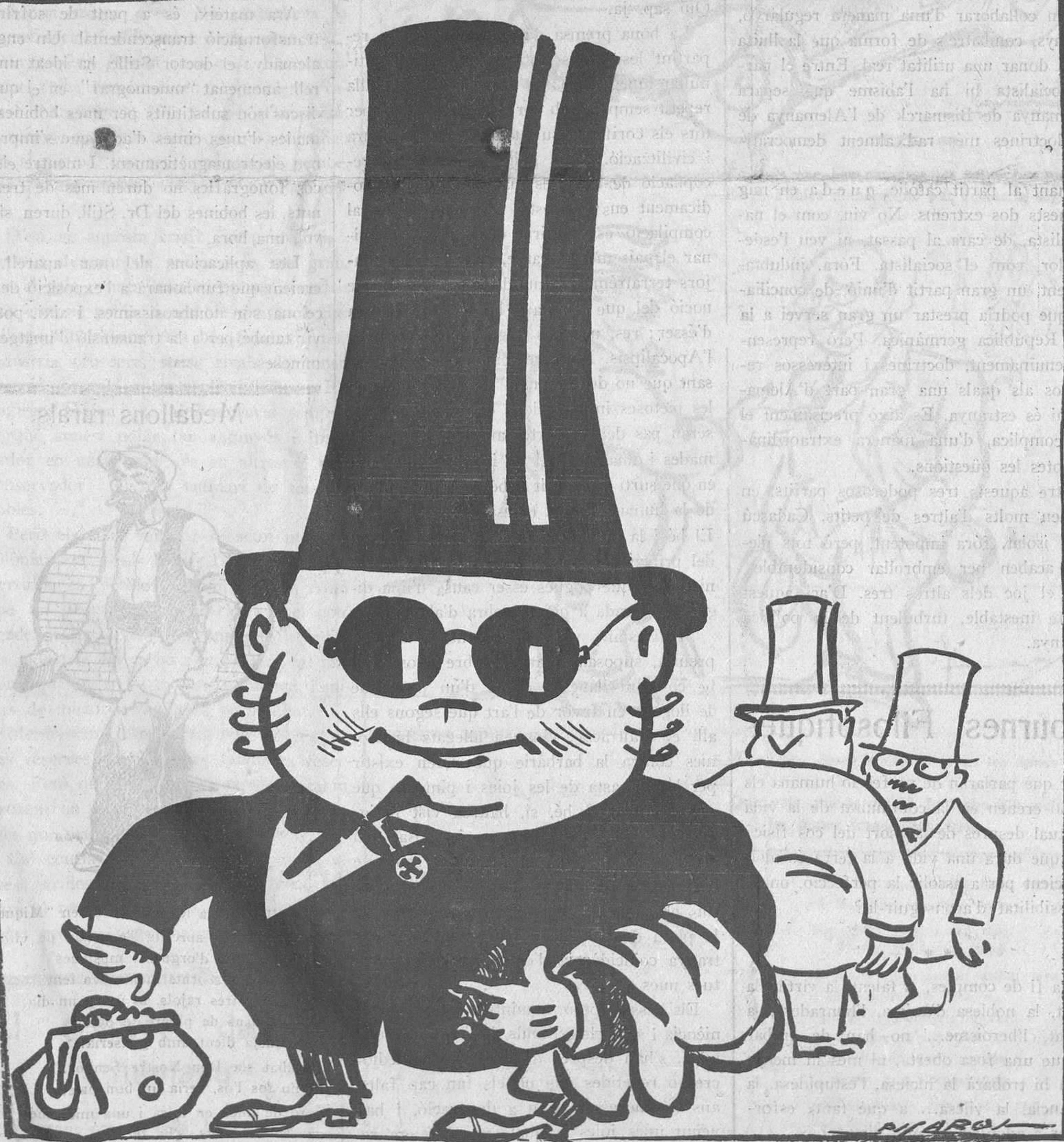
EL SENYOR ESTEVE, SATISFET

Cap dels nostres lectors no pot creure que defensem poc ni molt el luxe, que sempre hem cregut fonamentalment pertorbador per a la societat. Tenim per vils els malgastadors de tots caires. Però en la vida material no podem capir on és la justícia, si un home tant es diferencia d'altre. No ho dubti, senyor Sánchez: primer l'igualtat,