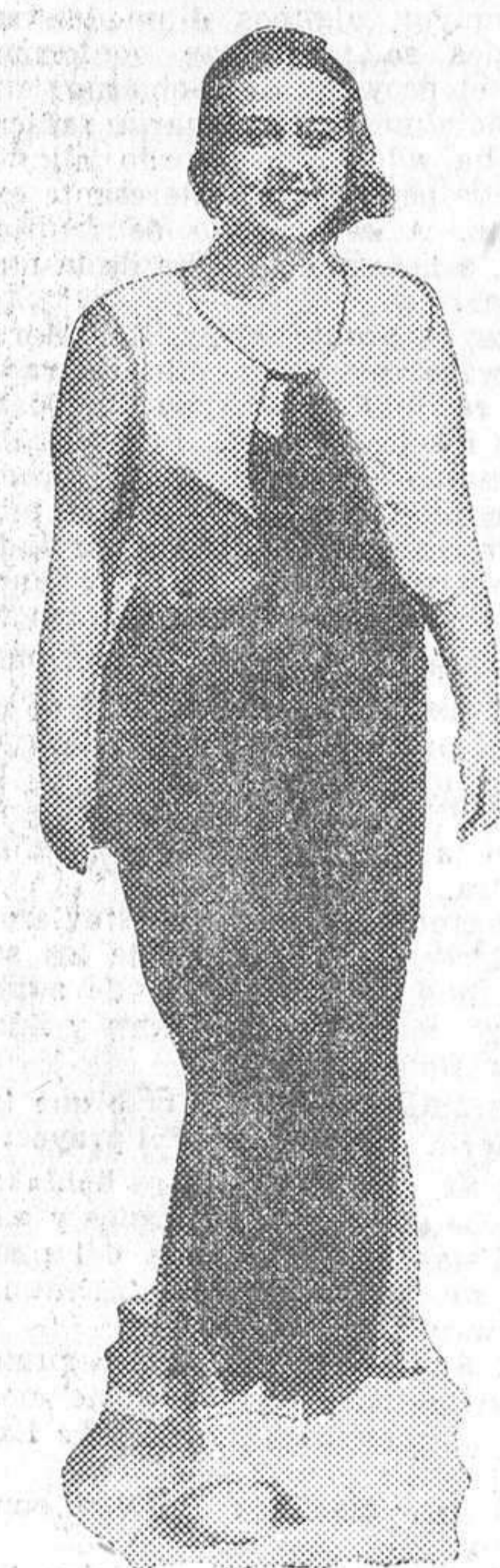
SAN SEBASTIAN.—Por las calles luce su belleza en pijama una deliciosa veraneante

Ya no es San Sebastián aquella playa mojigata que nos imponía el palacio de Miramar, centinela