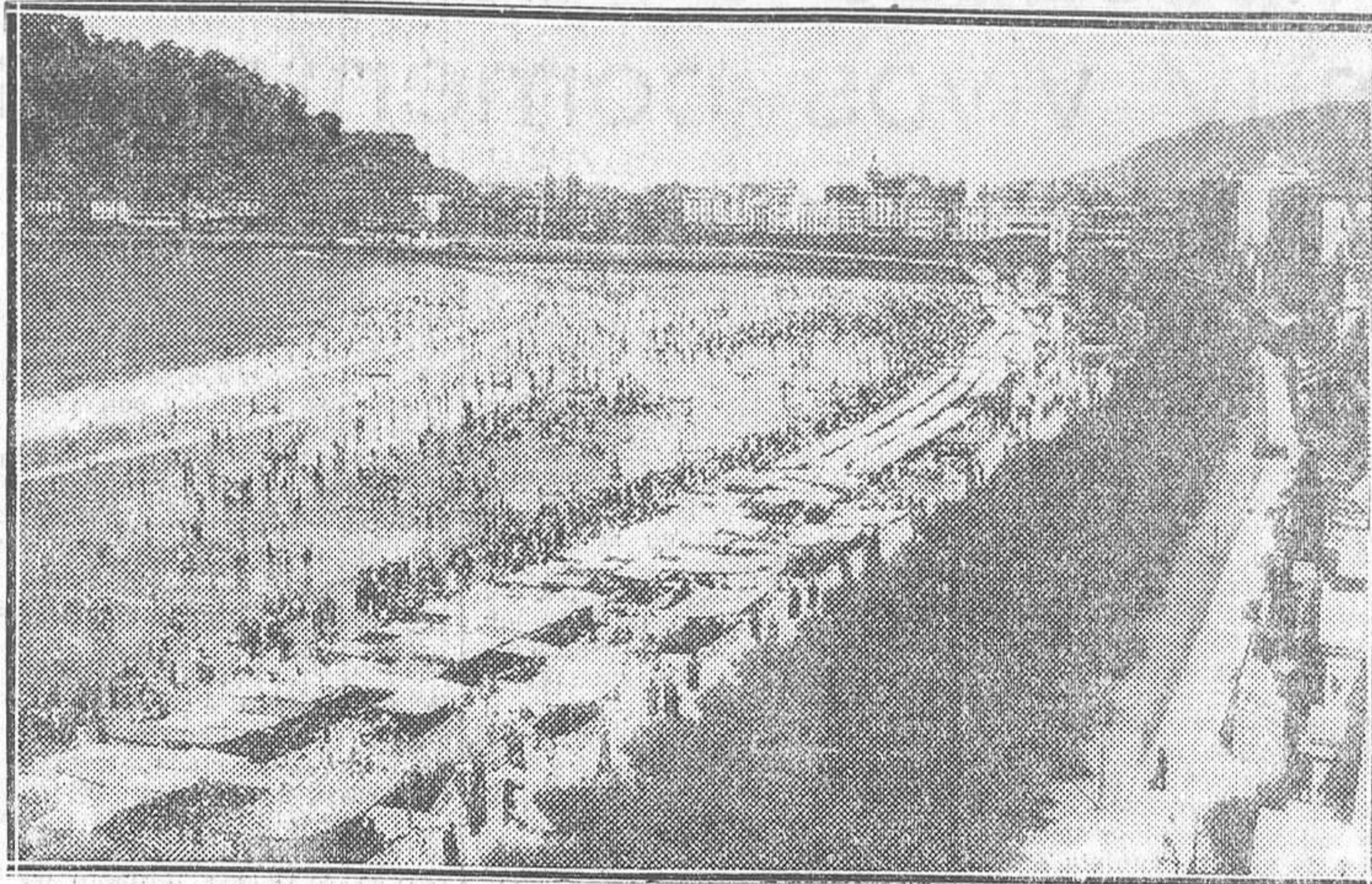
SAN SEBASTIAN.—La bellísima playa de la Concha