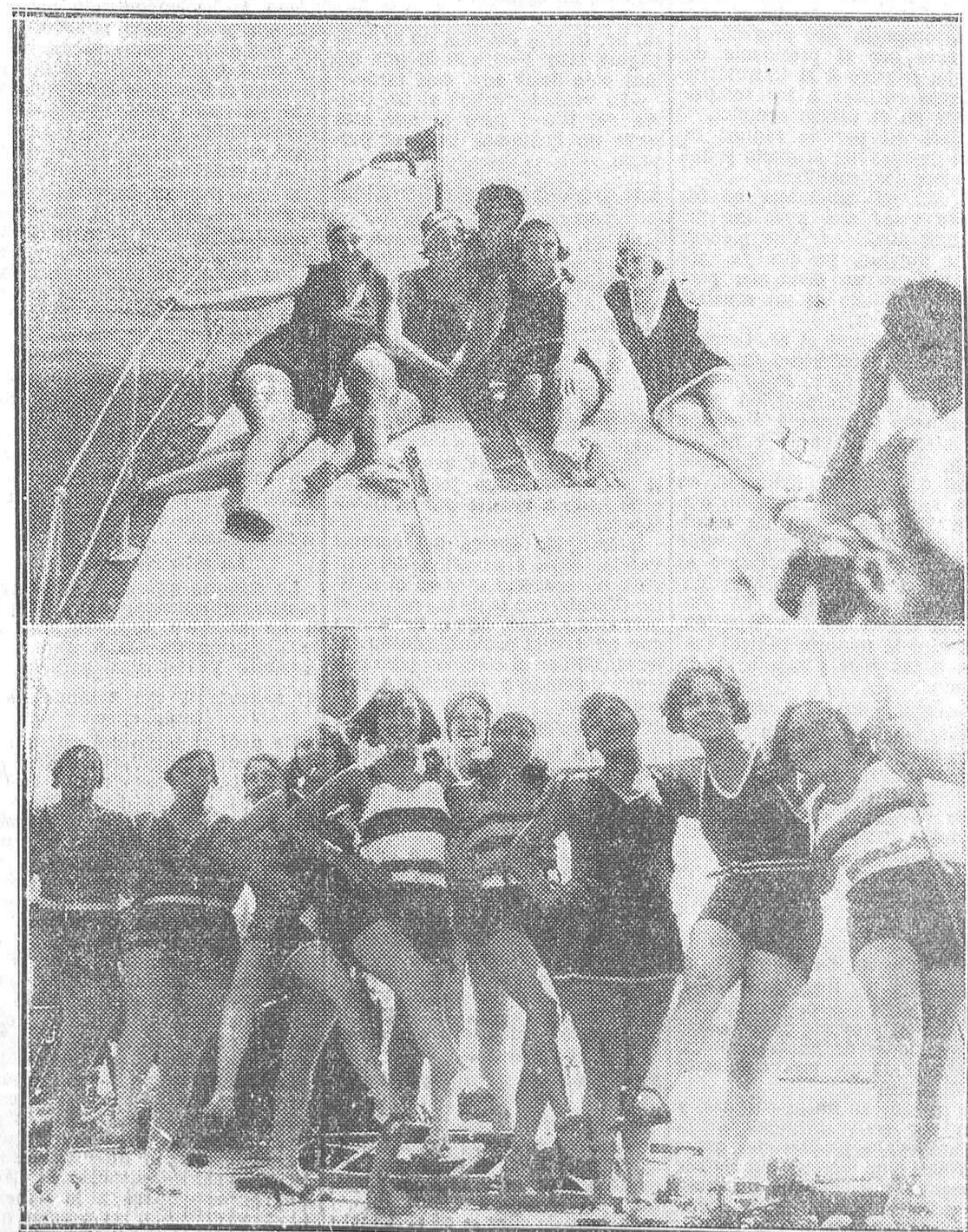
SAN SEBASTIAN.—Dos tripulaciones marciales en la bahía