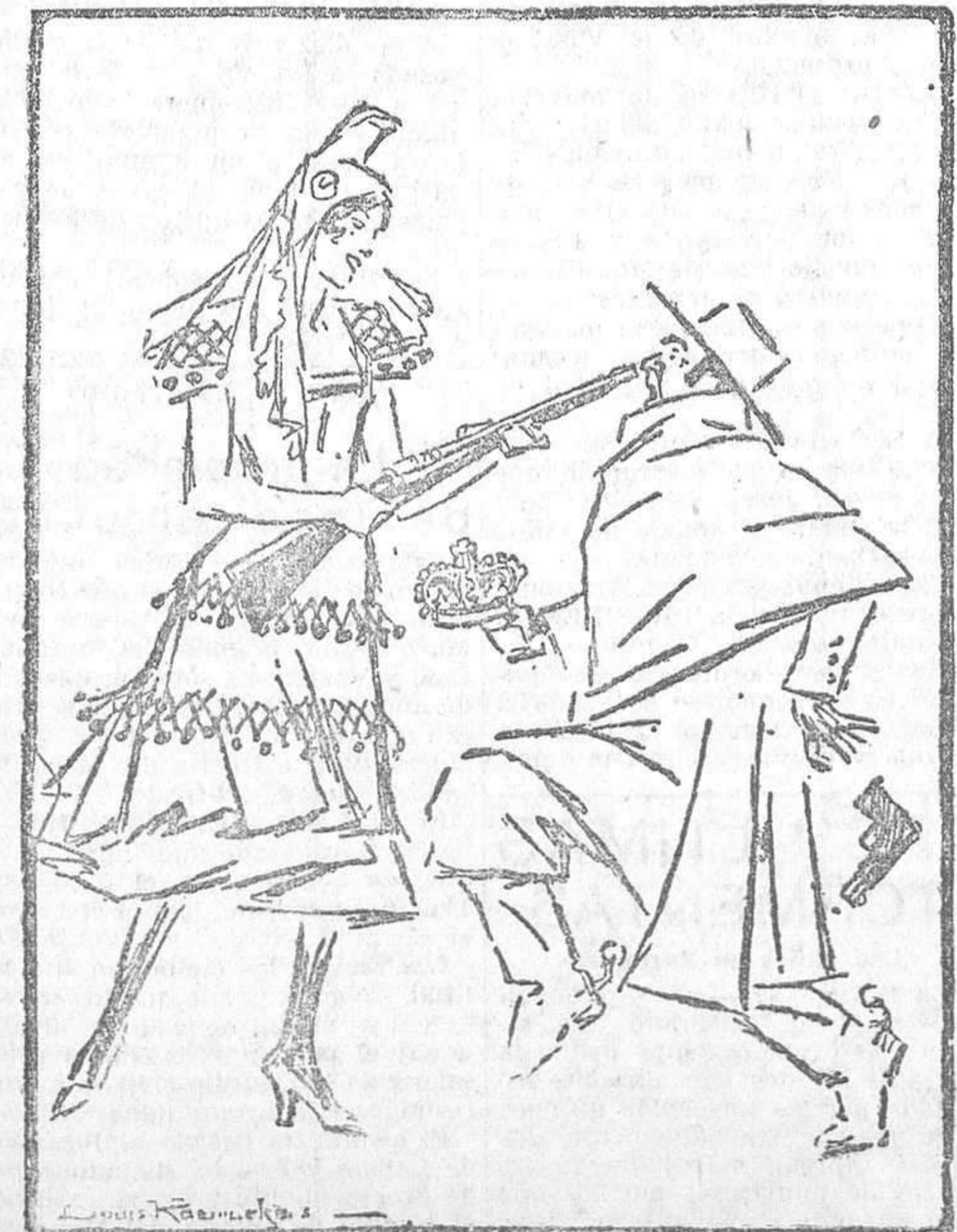
La República.—¡Alto ahí!

De esta necesidad se vino abusando por unos y otros, y fueron siempre los más humildes los que vendieron el trigo a menor pre-