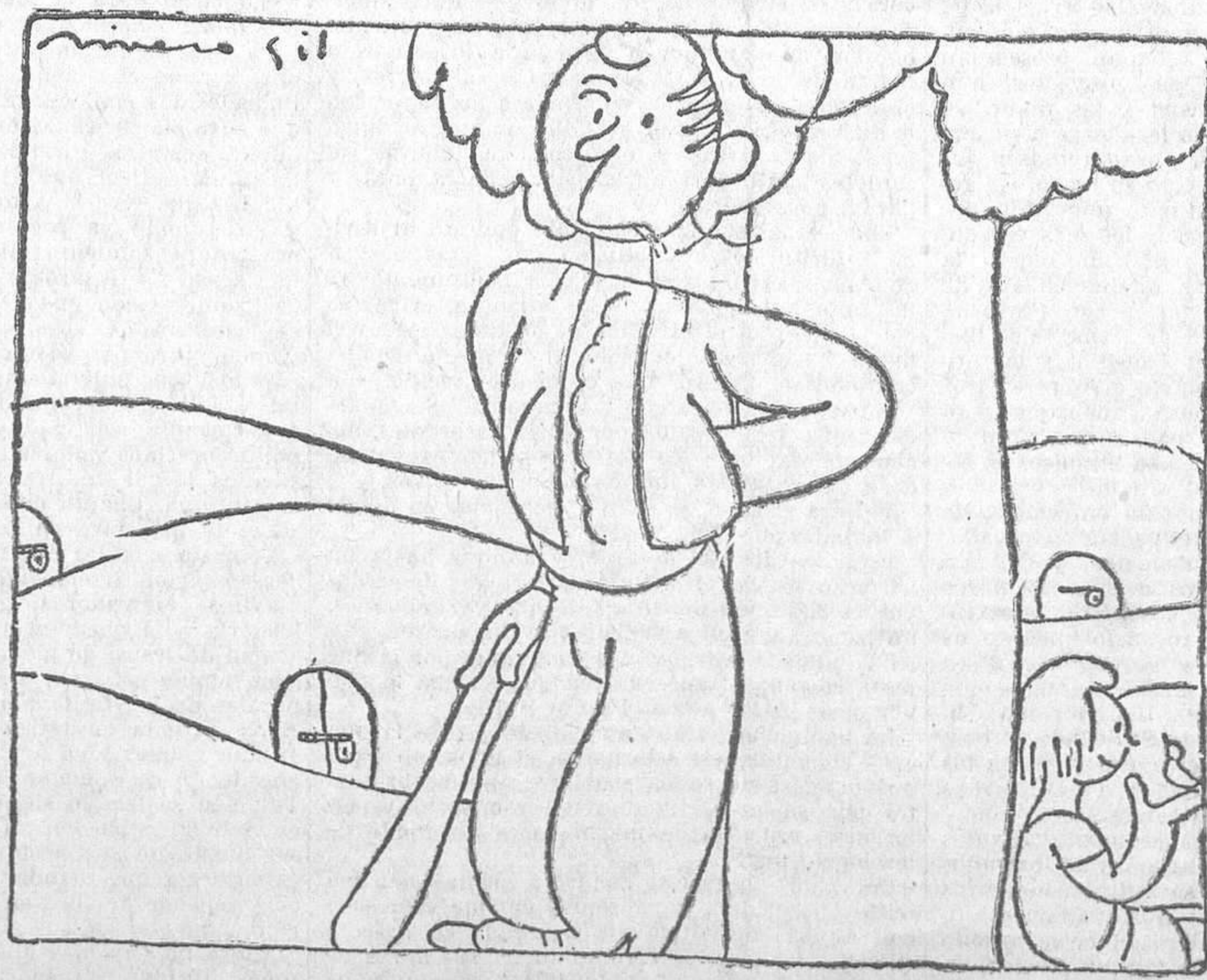
—Creo que ya no volverán a echar su cuarto a espadas...