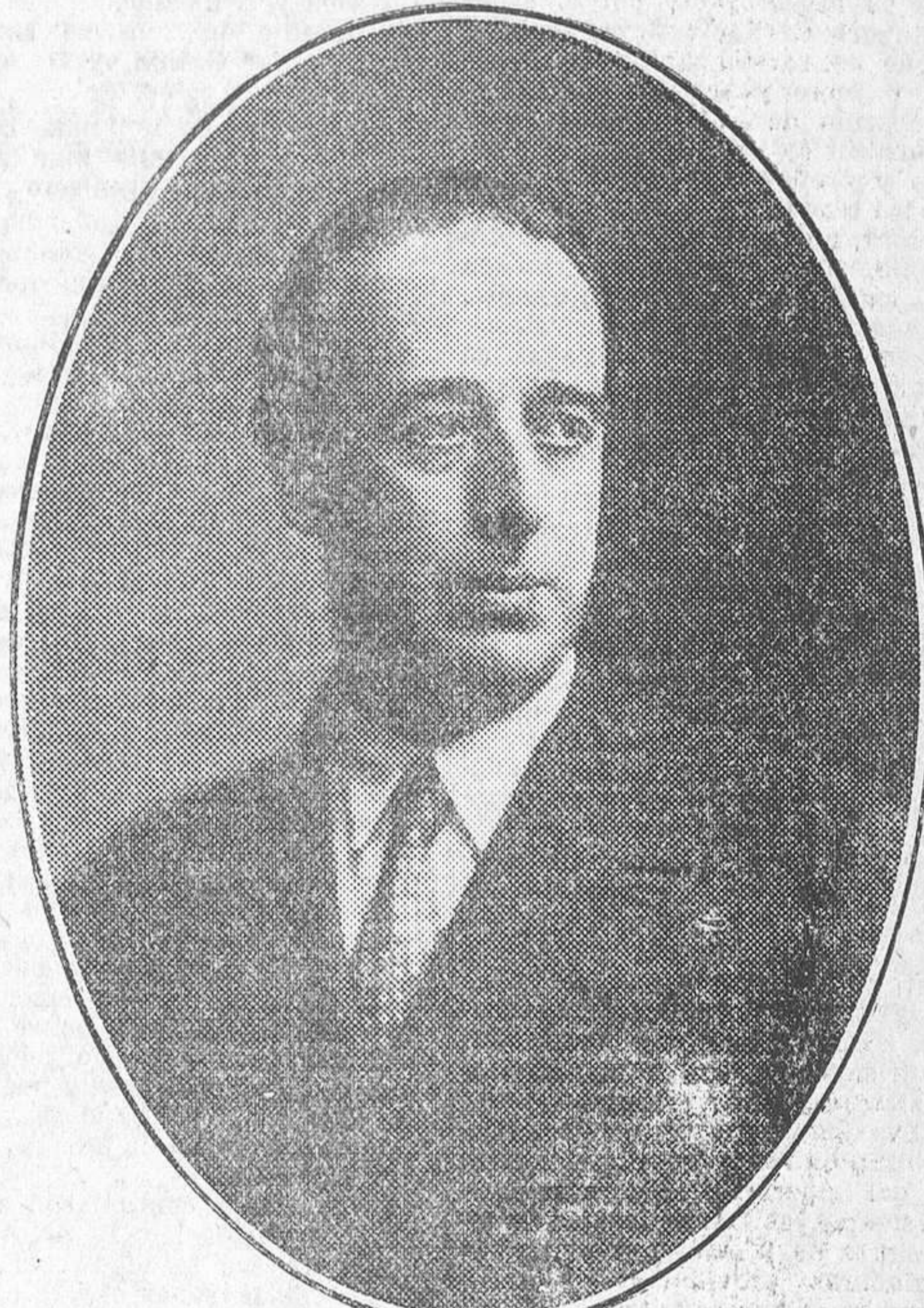
El ilustre músico Oscar Esplá, presidente de la Junta nacional de la música y teatros líricos y profesor de folklore en el Conservatorio de Madrid

Por documentos que se conservan en el archivo municipal, su origen se remonta al siglo XIII, siendo la única manifestación del primitivo teatro lírico español que se conserva. Ofrece la particularidad, entre las producciones de este género de aquella época, de